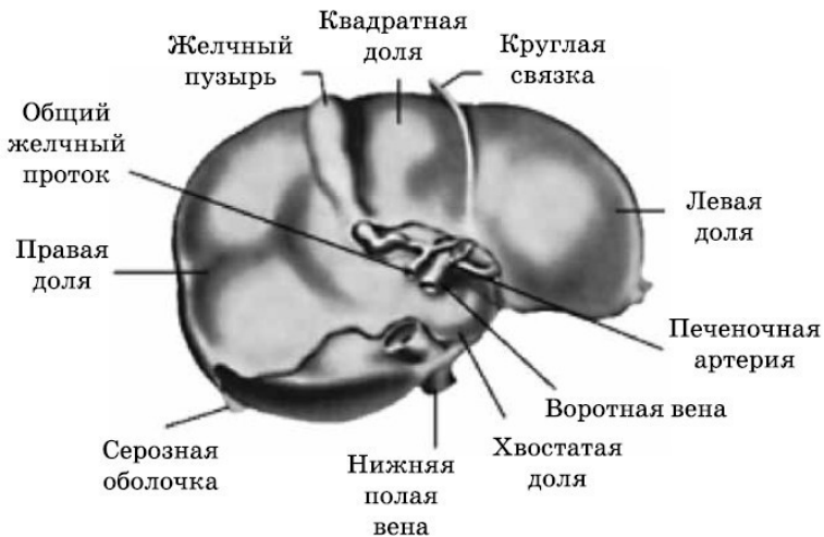
Рис. 2. Печень в разрезе

Начнем с общей картины, окинув ее пытливым взором исследователей. Мы увидим, что из печени выходят два протока: правый и левый печеночные протоки, которые сливаются в воротах в общий печеночный проток. В результате слияния печеночного протока с пузырным протоком образуется общий желчный проток. Диаметр протока, измеренный при операциях, колеблется от 0,5 см до 1,5 см. При большем диаметре общий желчный проток считается расширенным.