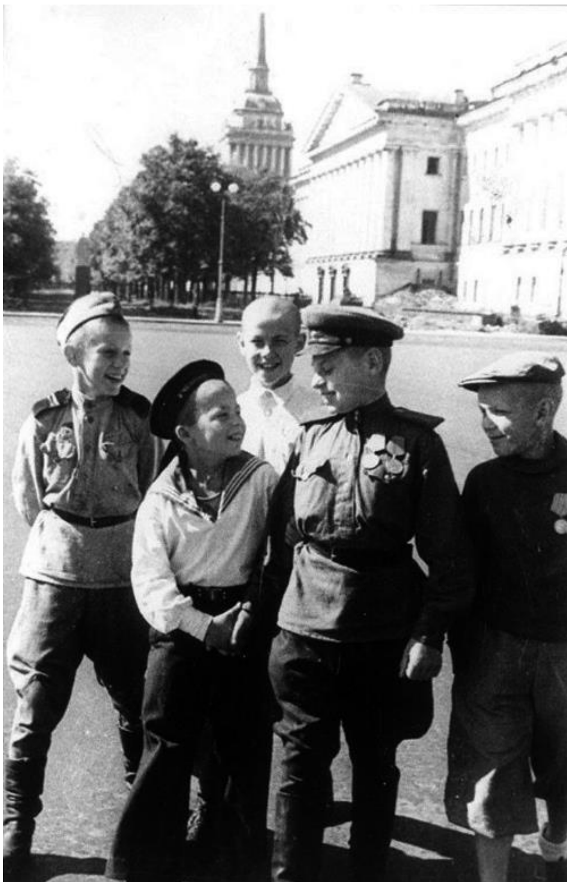
Юные защитники Ленинграда на Дворцовой площади. 1945 год

Автор проекта, составитель, автор послесловия и комментариев