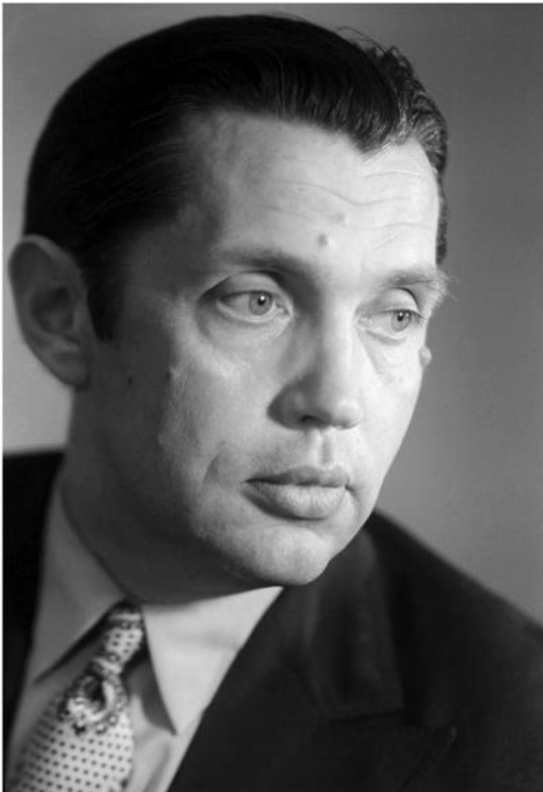
Р. И. Рождественский (1932–1994)

О неожиданном творческом вечере Рождественского я узнал случайно; возвращаясь домой (а жил с тогда на своей родной Петроградской Стороне). Проходя мимо Дворца культуры имени Ленсовета, вдруг заметил и афишу, и довольно крупный транспарант. Всё это хорошо, кроме одного: билеты все уже тут же были раскуплены, хотя время для выступления оказалось не самым удачным: и не середина дня, и не вечер. Говорили, что вечер был организован экспромтом. А дальше уже – чистой воды «техника»: длинные очереди, дискуссии с