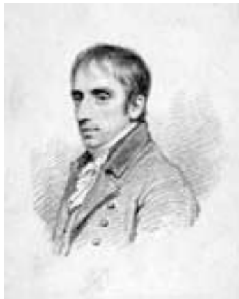
Уильям Вордсворт. Рис. Генри Эдриджа, 1805–1806 г.

время, и поэт с умилением обнаруживает в супруге множество земных, практичных талантов: «уверенность хозяйских рук», «ее размеренность во всем, единство опыта с умом»... Благодарность торопит вывод: «Венец земных начал она, / Для дома Богом создана». В общем, опять по Пушкину: «Мой идеал теперь – хозяйка, / Мои желания – покой...»