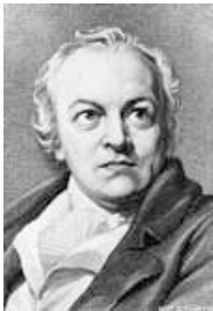
Уильям Блейк. С картины Томаса Филиппса, 1807 г.

щие книги Блейка изданы им самим и иллюстрированы собственными гравюрами.