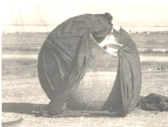
Теперь в музей!