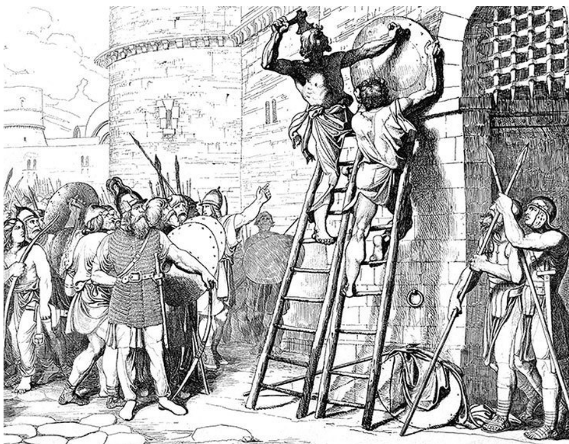
Олег прибывает щит свой к воротам Царьграда. Гравюра Ф. А. Бруни, 1839

А император и его военачальники не могли оказать помощи Солуни, потому что с севера в это время приближались войска Симеона и Олега. Что касается «колдовства» вождя «Росса», то его суть поясняют русские летописи. Когда появились тяжелые неприятельские корабли с «греческим огнем», Олег нашел способ уберечься от них. Приказал вытащить ладьи на берег. Там двигались его конница и обозы, и князь велел поставить лодки на повозки, везти по суше. Противостоять соединенным силам болгар и русичей Лев X был не в состоянии. Выслал делегации для переговоров. Впрочем, в запасе у императора имелось еще одно оружие. Почему бы не предложить «варварам» отравленные угощения? Но «колдун» Олег оказался не таким простаком, как представляли «цивилизованные» греки, распорядился не принимать от врага еду и напитки. Пришлось признать поражение, идти на уступки и откупаться.