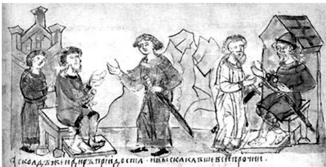
«Правление Аскольда и Дира в Киеве» Радзивилловская летопись

Варяги выполнили заказ. Ударили на подданных князя, кривичей, захватили Смоленск. Правда, развить успех не сумели, их остановили. Но цель Византии и Хазарии была достигнута, они стравили Ладогу и Киев. Поэтому Рюрик не стал продолжать боевые действия против каганата. Отправь он войска на Волгу, ему угрожал бы удар по тылам, с Днепра. Одолеть Аскольда и Дира тоже было непросто, за ними стояли две великие державы.