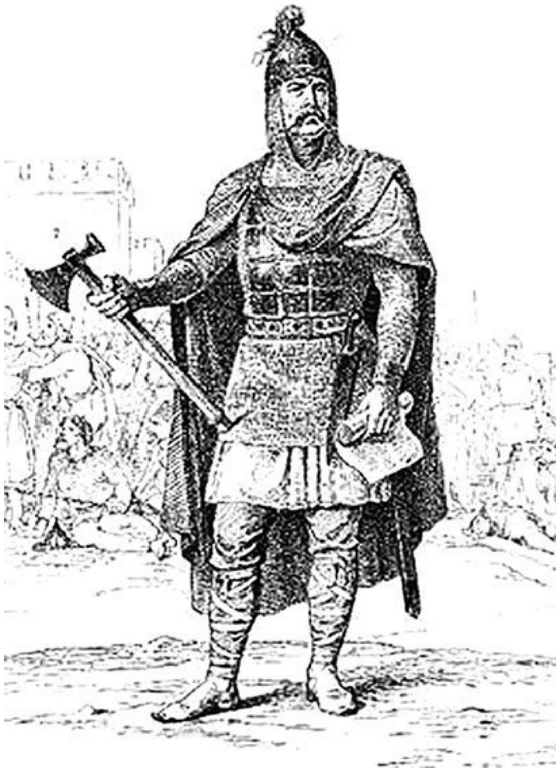
Олег I Вещий. Портрет в Радзивилловской летописи

Но летописи очень лаконичны. Они сообщают нам лишь скудные факты, излагают их весьма сжато. Так, в 883 г. Олег совершил поход на древлян и покорил их, в 884–885 гг. без боя подчинил северян и радимичей, данников Хазарского каганата, а затем начал жестокую и затяжную войну с тиверцами и уличами. В это время Киев подвергся мадьярскому нашествию, которое удалось отразить. Потом каким-то образом в состав державы Олега вошли дулебы и белые хорваты, обитавшие на Волыни и в Прикарпатье. И наконец, в 907 г. (по другим источ-