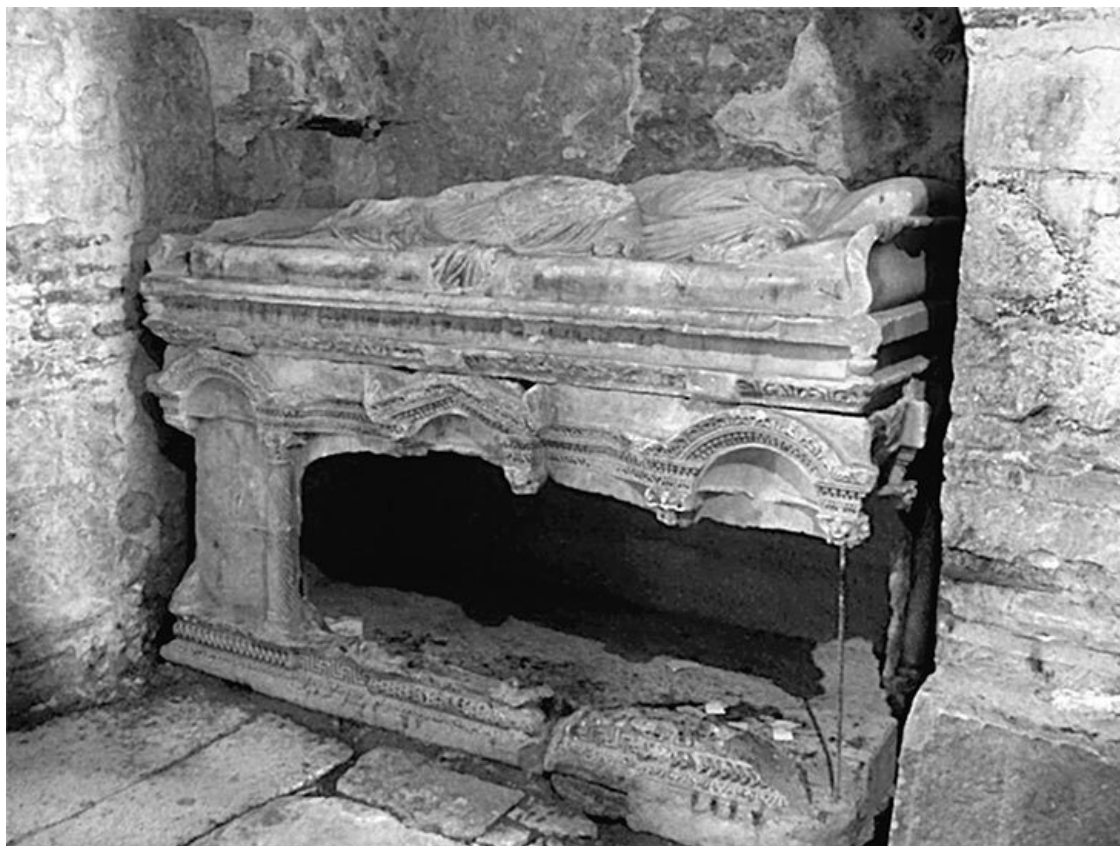
Саркофаг, в котором предположительно покоились мощи Святителя Николая до перенесения их в г. Бари (Италия)

Около 345 г. архиепископ преставился. Его гробница стала источать благовонное миро, туда потянулись многочисленные паломники, происходили исцеления. Одно из первых посмертных чудес связало св. Николая с территорией нынешней России. Группа людей, живших в устье Танаиса (Дона), тоже решила посетить Миры, снарядила корабль. К ним перед отплытием обратилась незнакомая женщина, сетовала, что не может поехать сама, и просила передать от нее к гробнице драгоценный сосуд. Но на судно обрушились штормы, раз за разом отбрасывали назад. Паломники принялись молиться св. Николаю, и он сам подплыл к ним в лодке. Объяснил, что под обликом женщины скрывался нечистый дух, и мешает им тот самый сосуд. Его выбросили в море, и корабль благополучно достиг цели.