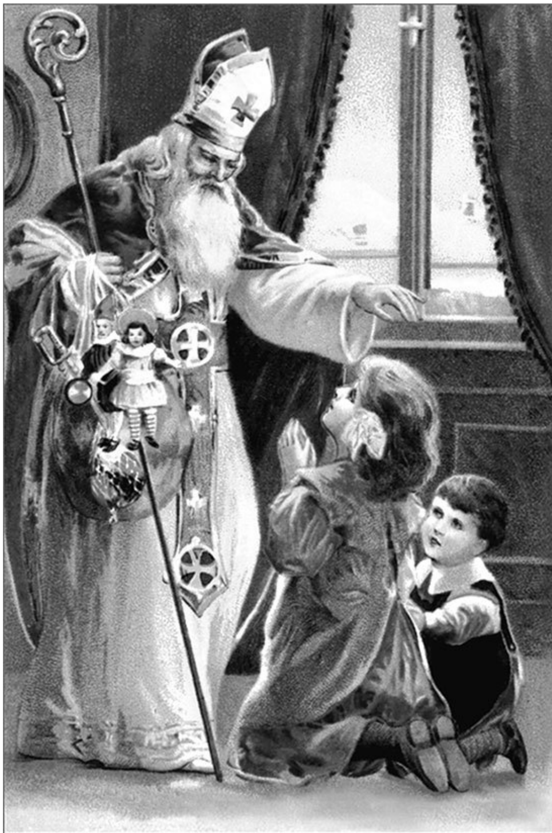
Святой Николай – Санта-Клаус

Хотя нетрудно увидеть, что духовная суть в данной традиции оказалась совершенно выхоленной. Ведь св. Николай приносил вовсе не подарки. Он спасал от гибели четыре