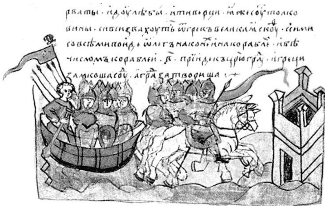
Поход Олега на Царьград. Миниатюра из Радзивилловской летописи

Вещий Олег тоже не упустил своего. Преследуя и вытесняя мадьяр, он присоединил к Руси Волынь и Прикарпатье, ему подчинились племена дулебов и белых хорват. Но подлыми методами он не пользовался. Напротив, предложил венграм примириться – мы вас не будем трогать, а вы нас. Изгнанники это оценили. Обживать на новых местах было трудно, и безопасность карпатской границы для них много значила. Но и для Руси подобный дипломатический поворот оказался крайне полезным. Из Паннонии орды мадьяр раскатились набегами по всем европейским странам, врывались даже в Италию, и лишь на русские владения они не ходили ни разу.