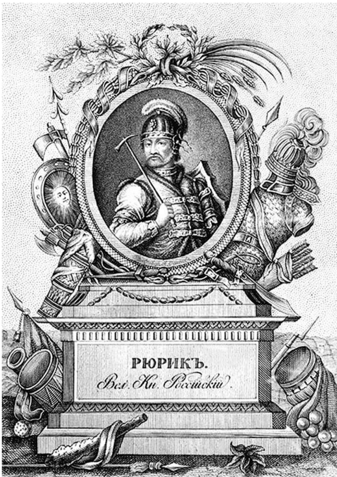
Князь Рюрик. Гравюра 1805 г.

Но... реально для возвращения наследства он не сделал ничего. Император был занят другими делами, разборками с Бретанью, Хорватией, войной с болгарами, церковными реформами. Даже внутри империи Людовик не мог толком навести порядок. Вместо этого поделил все владения между детьми, Лотарем, Пипином и Людовиком. Но потом овдовевший император пылко влюбился в молоденькую еврейку Юдифь, она произвела на свет четвертого сына