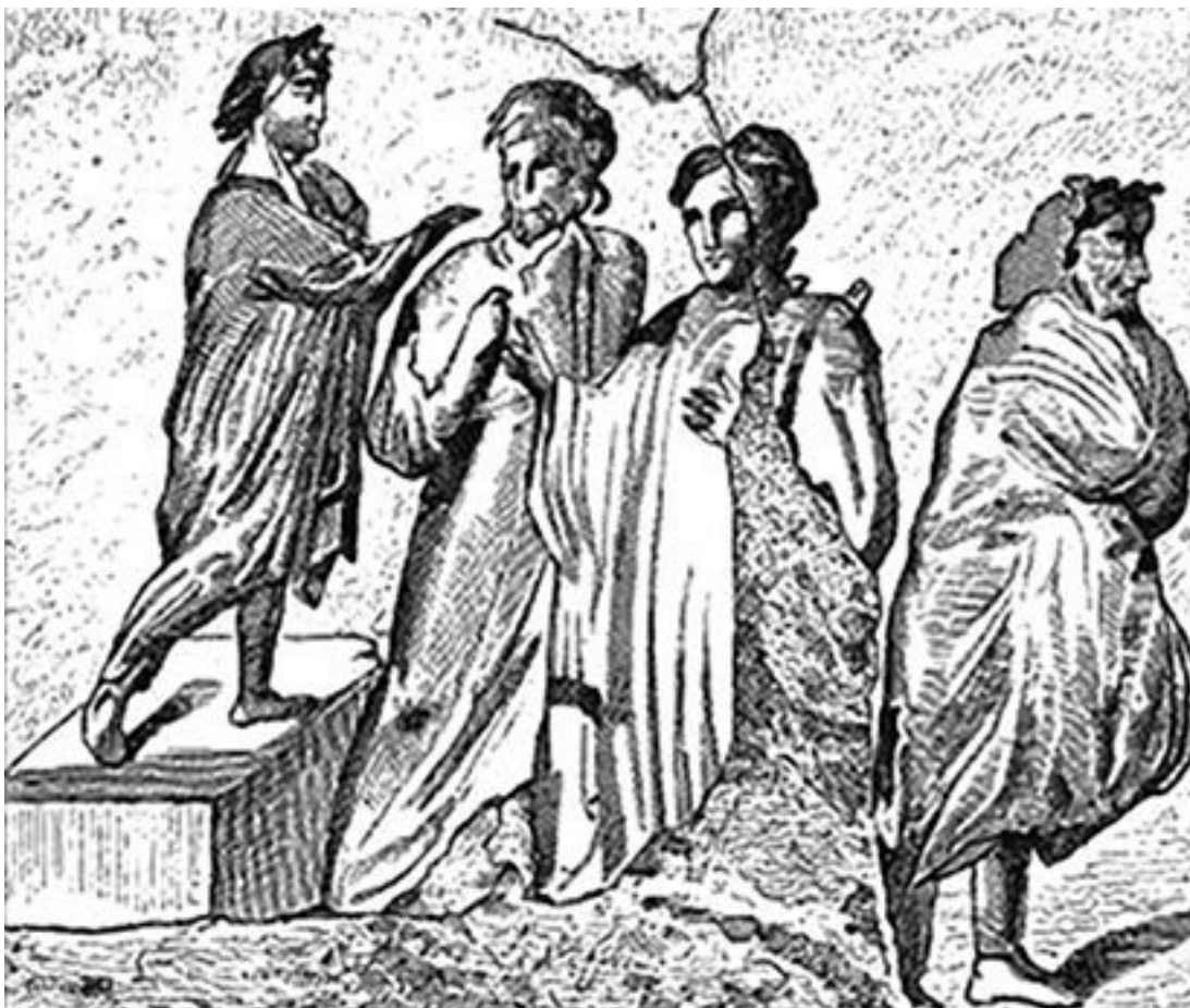
Суд над христианами. Рисунок на фреске из римских катакомб

Однако служение архиепископа в те времена означало не только почет и работу по устройству своей епархии. В 303 г. император Диоклетиан и его соправитель Галерий вспомнили прежние законы о запрете христианства, было издано четыре новых эдикта. Развернулись страшные гонения. Началась кампания в Никомидии, в день Пасхи там сожгли прямо в церкви массу собравшихся людей. Затем террор покатился по другим городам. Христиан хватали, подвергали пыткам, требуя отречься, за отказ обрекали на мучительные казни. Хоть и не сразу, кровавая волна дохлынула до Ликии. Вместе со многими прихожанами попал в темницу и св. Николай. Здесь добрый и скромный священнослужитель проявил себя железным борцом за веру. В переполненной камере терпел голод и жажду. Готовился принять мученический венец, укреплял в этом паству.