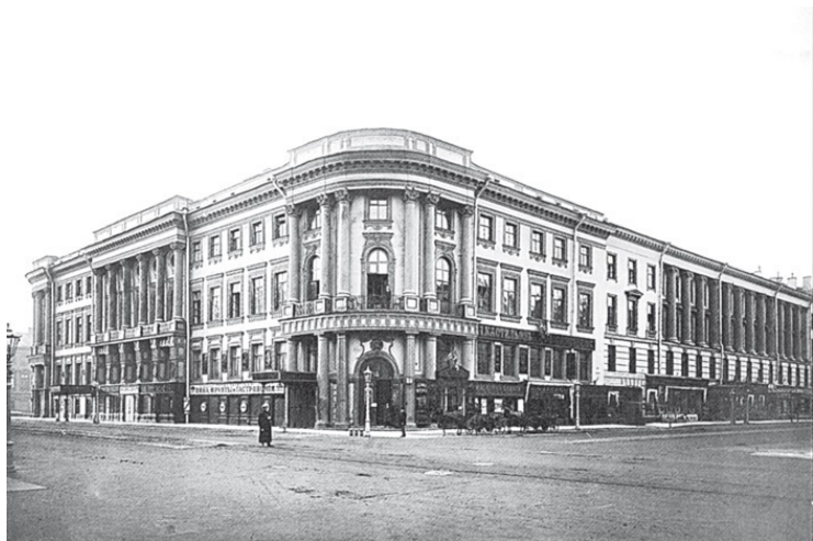
Дом Н.И. Чичерина

тами: застраивал Летний сад (грот, павильоны и галерея-колоннада), руководил возведением второго Зимнего дворца, место которого занимает ныне Эрмитажный театр, строил Партикулярную верфь – и, конечно, возводил неповторимое здание Кунсткамеры.