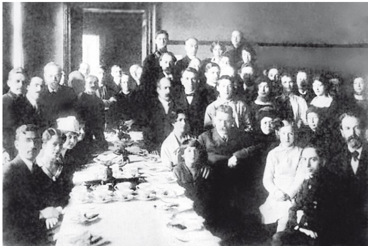
Коллектив издательства «Всемирная литература». 1919 г.

Участница событий в ДИСKe, писательница Ольга Форш, в романе «Сумасшедший корабль» показала жизнь в Доме искусств – общежитии сотрудников издательства «Всемирная литература». Создано это издательство было в сентябре 1918 г. при участии Алексея Максимовича Горького, привлекшего в качестве участников коллегиального органа управления изданием книг многих известных литераторов. Среди них можно назвать имена А.А. Блока, Н.С. Гумилева, К.И. Чуковского, Е.И. Замятина и академика С.Ф. Ольденбурга.