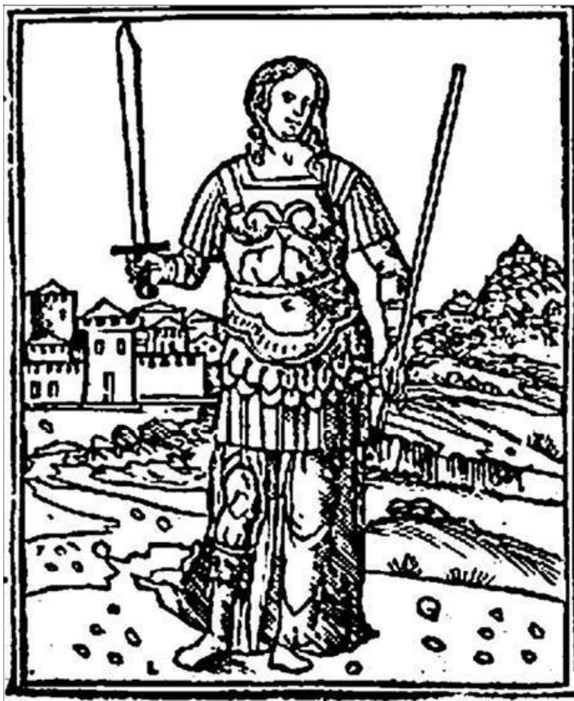
Семирамида в образе амазонки. Книжная иллюстрация XVIII века

Вскоре она родила мальчика, его назвали Ниний. Семирамида посвятила ребенку всю себя, а к царю еще больше охладела. Царь Нин не знал, что ему делать. Он вызвал советников, и те посоветовали ему исполнить любое желание красавицы, даже самое необычное. Тогда царь позвал к себе царицу и спросил о причине ее плохого настроения. Она молчала. Тогда он предложил ей потребовать у него все, что она пожелает, он все отдаст ей с удовольствием. Царица неожиданно улыбнулась и согласилась. Она попросила, чтобы он... отдал ей трон на несколько дней, чтобы она была полноправной царицей и могла править всем: советниками, городом, государством. Это бы ее развеселило, и она полюбила бы его.