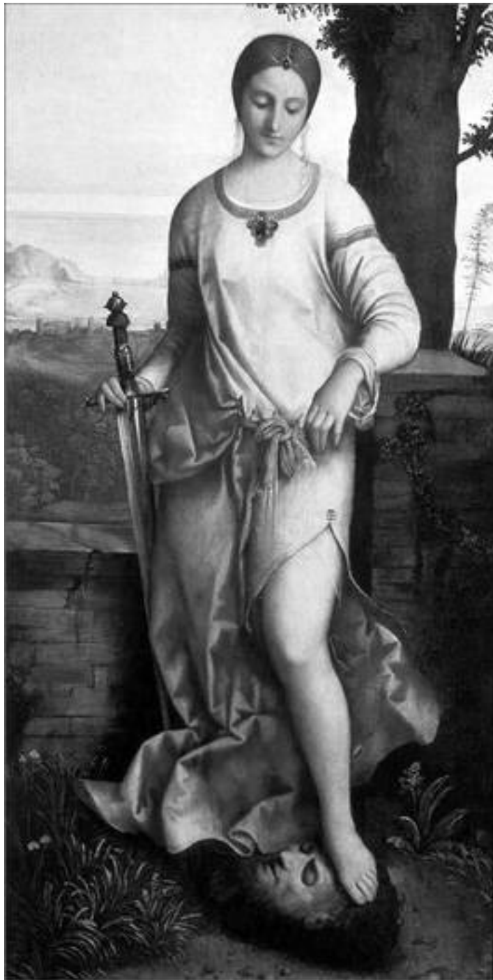
Юдифь с головой Олоферна. Художник Джорджоне

Юдифь и спящий Олоферн остались одни. Теперь ничто не мешало ей приступить к исполнению главной части плана. Она взяла в руки тяжелый меч полководца, подошла к постели и едва слышно произнесла: «Господи, Боже всякой силы! Призри в час сей на дела рук моих к возвышению Иерусалима, ибо теперь время защитить наследие Твое и исполнить мое намерение, поразить врагов, восставших на нас».