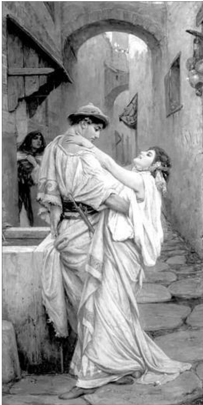
Мессалина. Художник П.А. Сведомский

Гость приходил, платил, она отдавалась ему и ждала следующего. Узнай об этом Клавдий, то, несмотря на свою слабохарактерность, в гневе мог лишить ее жизни. Но он был занят государственными делами и не принимал всерьез слухи о порочности его жены. Ночные похождения Мессалины кончились в тот день, когда она познакомилась с неким Гаем Силием, молодым красивым римлянином. Ненасытная императрица воспылала к нему страстью. Она был женат. Мессалина потребовала от него развода. Он развелся. Мессалина буквально дневала и ночевала у него. Она делала ему подарки, давала деньги.