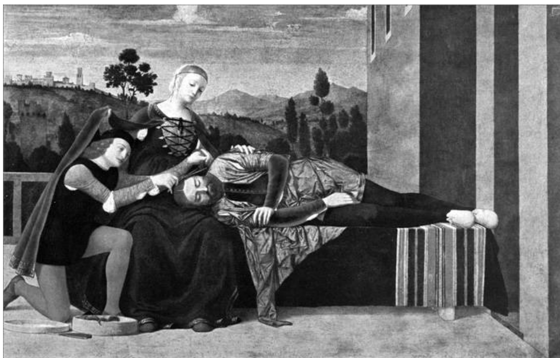
Самсон и Далила. Художник Ф. Мороне

Далида сделала все, как сказал ей Самсон, но и на этот раз он обманул ее. Мигом пробудился от ее крика и вырвал колоду вместе с тканью. В который раз стала упрекать его Далида, что не любит он ее, трижды обманул ее и не сказал ей, в чем сила его. И так мучила его, так досаждала, что Самсон не выдержал и признался ей. Он сказал ей, что он назорей Божий, бритва не касалась его головы. И если его остричь, то вся его сила отступит, и он сделается слаб, как прочие люди.