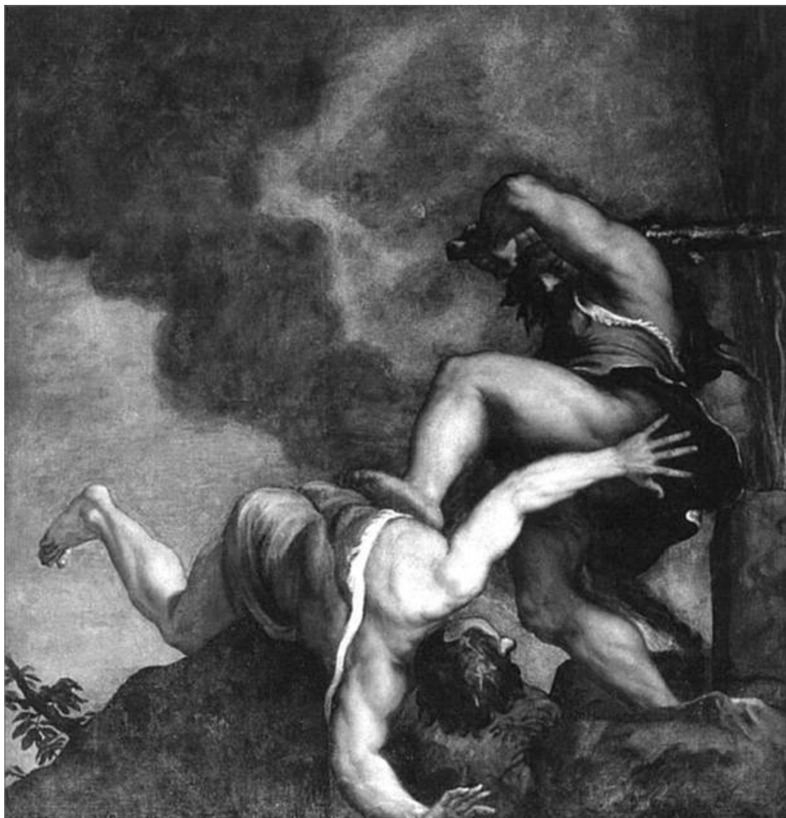
Каин и Авель. Художник Тициан

Каин ничего не ответил, он еще сильнее огорчился, не знал, на ком выместить свою злобу и недовольство. И предложил брату пойти в поле. Когда они остались одни, Каин набросился на Авеля и убил его. Так на земле появились первый убийца и первая жертва.