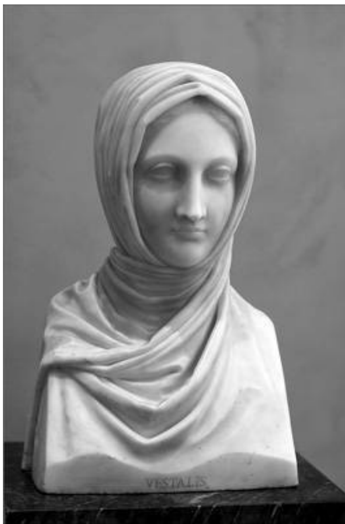
Весталка. Скульптор А. Канова

Но римские консулы не учитывали полководческий дар Ганнибала, который умел предвидеть поведение противника на поле боя. Войска сошлись в Апулии при Каннах. Варрон, ощущая перевес в живой силе, решил пустить пехоту и двигаться напролом. Ганнибал же расположил свои войска полукругом – с обоих флангов у него была приготовлена конница. Едва римляне оказались в центре полукруга, как Ганнибал дал приказ выступить коннице. Римляне попали в окружение. Попытки пробиться к успеху не привели. Карфагеняне рубили их сверху, а затем разгром римлян завершила пехота карфагенян. Римляне потеряли в этом сражении 81 тысячу человек! Потери Ганнибала оказались значительно скромнее – всего 6 тысяч.