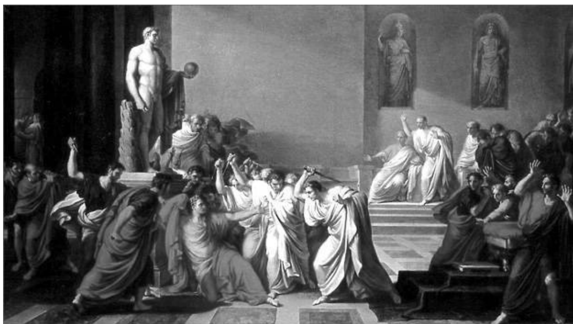
Смерть Цезаря. Художник В. Камуччини

Налицо были все признаки, что над ним сгустились смертельные тучи. Он же решил идти в сенат, показать всем, что ничего не боится. Он шел наперекор знакам, символам, предсказаниям, двигался наперекор судьбе. По пути в Сенат ему передали свиток, в котором предупреждали о заговоре. Но Цезарь был слишком занят ответами на вопросы просителей и не успел его прочесть.