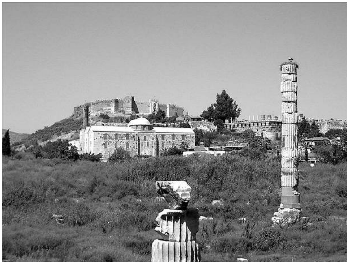
Руины (на переднем плане) сожженного Геростратом храма Артемиды в Эфесе