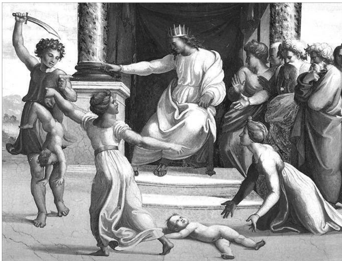
Суд Соломона. Художник Рафаэль

Третий израильский царь, сын царя Давида и Вирсавии, мудрый Соломон (990–928 до н. э.), имя которого Шалом означало «мир», прославился благими делами. Он объединил Израильское царство, достигшее за годы его правления наивысшего расцвета, построил знаменитый Иерусалимский храм, был выдающимся поэтом, автором «Книги Екклесиаста», «Песни песней Соломона», «Книги Притчей Соломоновых». Во время своего правления он старался быть справедливым судьей по отношению к своим подданным и заложил основы правосудия в своем государстве. Но сам оказался в немалой степени грешен.