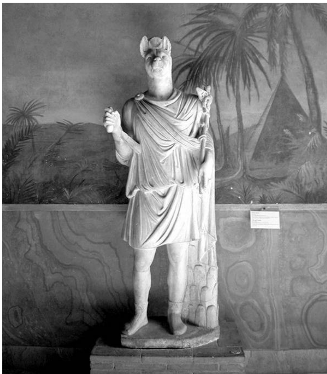
Статуя Анубиса из Ватиканского музея