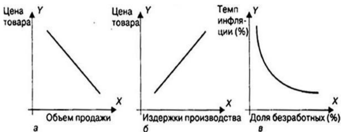
Рис. 1.1 Основные виды графиков: а – график обратной линейной зависимости; б – график прямой линейной зависимости; в – график нелинейной зависимости

Если линия графика идет слева направо по нисходящей, то между двумя переменными существует обратная связь (так, по мере снижения цен на товар обычно растет объем его продажи – рис. 1,а). Если линия графика идет по восходящей, то связь прямая (так, по мере роста издержек производства товара обычно растут цены на него – рис. 1,б). Зависимость может быть нелинейной (т.е. изменяющейся), тогда график приобретает форму кривой линии (так, по мере уменьшения инфляции безработица имеет тенденцию к увеличению – кривая Филлипса, рис. 1.1,в).