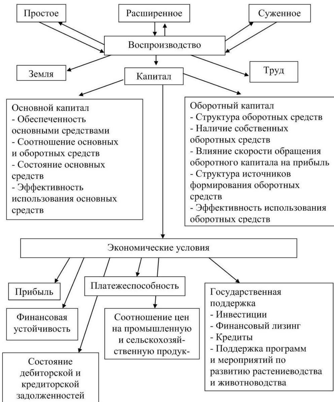
Рисунок 2 – Экономические условия воспроизводства в сельскохозяйственных организациях

На рисунке 2 схематично показаны экономические условия воспроизводства в сельскохозяйственных организациях.