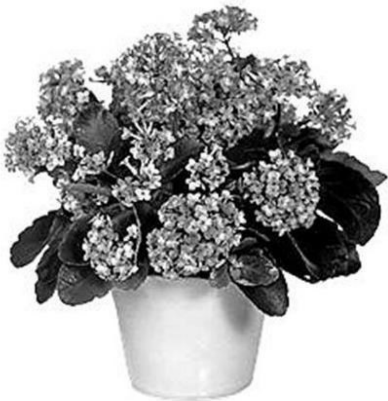
Рисунок 5 – Каланхоэ

и растения, ионизирующие воздух (хлорофитум хохлатый, циссус, фикус Бенджамина, аспарагус перистый, диффенбахия, каланхоэ, филодендрон, папоротник, сансевиерия трехполосная, пеларгония, хвойные растения и др.).