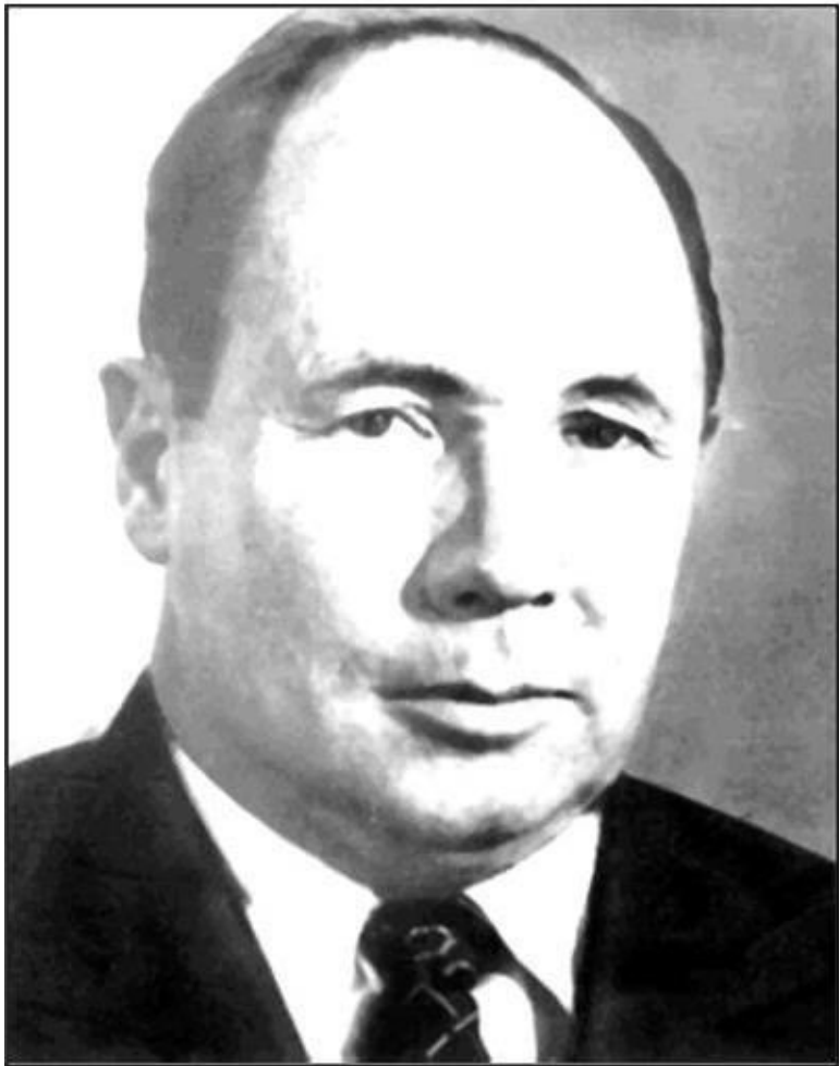
Рисунок 1 – Андрей Михайлович Гродзинский