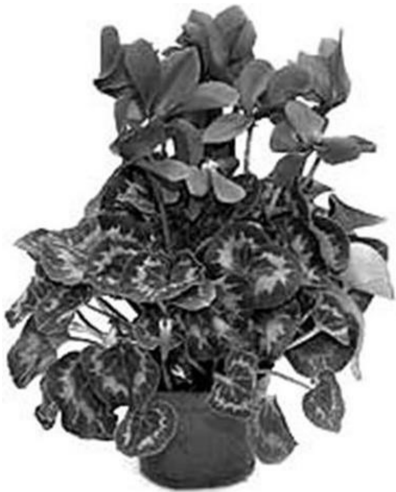
Рисунок 11 – Цикламен