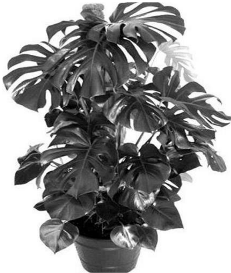
Рисунок 4 – Монстера

3 группа – растения, очищающие воздух от вредных газов