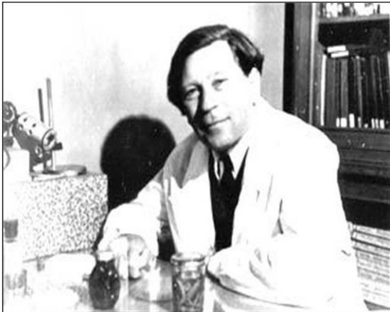
Рисунок 2 – Борис Петрович Токин

Фитонциды комнатных растений способны изменить и улучшить состав воздушной среды, подавляя жизнедеятельность патогенных микроорганизмов и нейтрализуя вредные химические вещества, содержащиеся в воздухе, а также способны положительно воздействовать на организм человека, успокаивая его нервную систему.