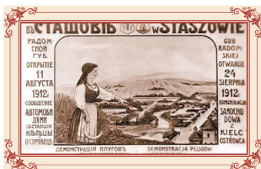
Город Сташов Сандомирского уезда Радомской губернии. 1912 г.