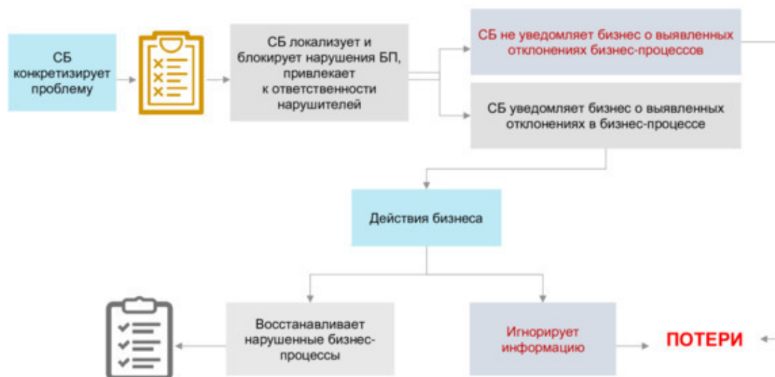
Схема взаимодействия СБ и бизнеса

P.S. Для нормального понимания и усваивания информации из книги необходимо минимальное знание законодательства и голова на плечах.