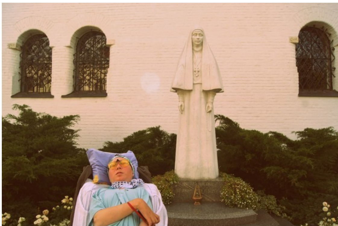
Марфо-Мариинская обитель. Москва