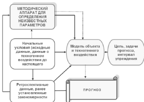
Рис. 1.1. Блок-схема прогнозирующей системы

сопровождающего такую аварию в ретроспективе и в настоящее время.