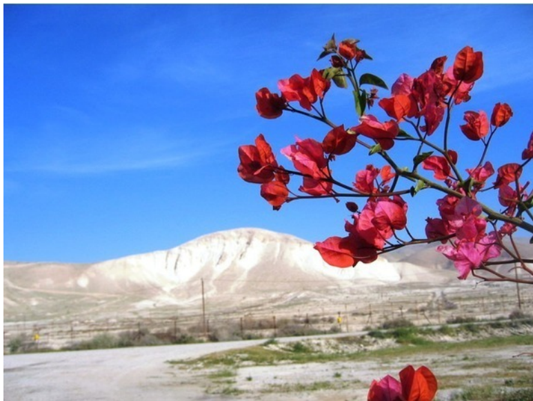
Пустыня Иудейская.