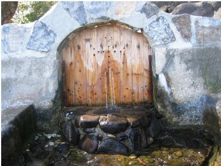
Это фото Источника Святой Марии Магдалины