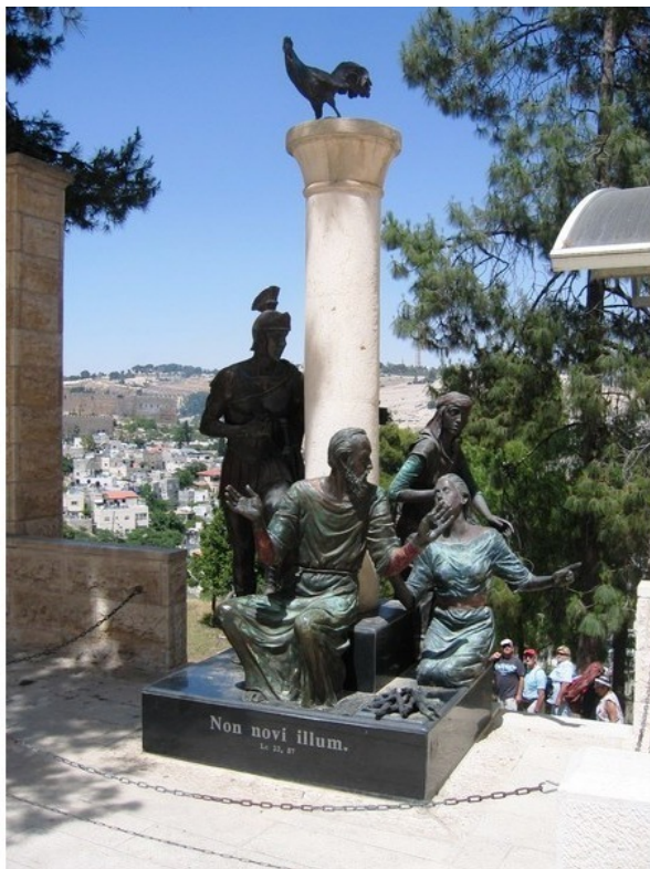
Памятник у «Церкви Петушиного Крика».