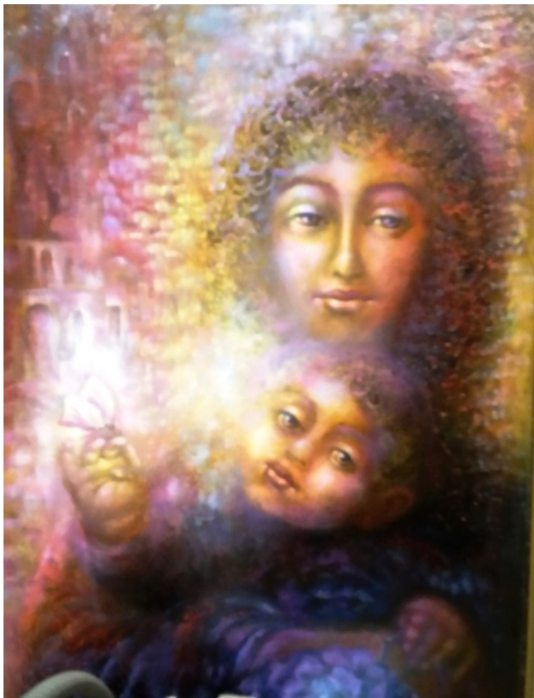
Эзотерическая картина кисти художника Юлии Лагускер