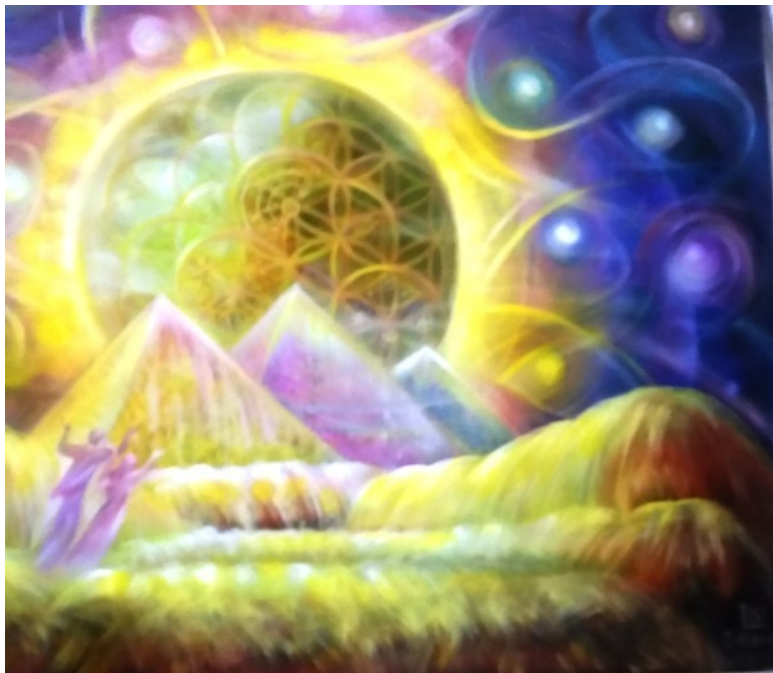
Эзотерическая картина кисти художника Юлии Лагускер