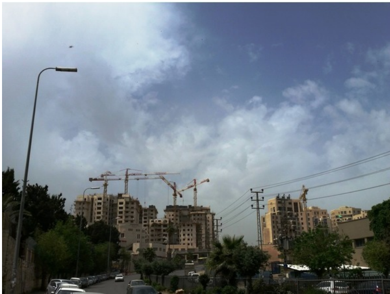
Улица Ирмиягу в Иерусалиме