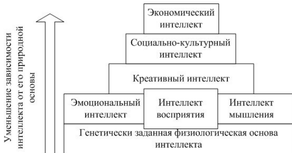
Рисунок 2 – Связь видов интеллекта с его природной основой

Ни один вид интеллекта нельзя полностью отделить от его природной основы, поэтому определенная часть i -го вида интеллекта – это природные способности, особенности, отклонения ( F ), другая же – искусственно созданные способности и умения, формируемые и развиваемые методами психологических ( P ) и социально-экономических дисциплин ( SE ).