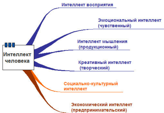
Рисунок 1 – Системное представление структуры интеллекта человека

Экономический интеллект, как и креативный, во многом определяется активностью и мощностью работы нейронной системы мозга ( F ).