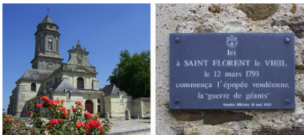
памятная табличка в Сен-Флорене