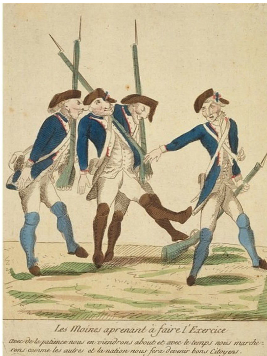
национальные гвардейцы (карикатура)

К моменту приезда в Ла Бароньер, весь Може был потрясен кровавой расправой в соседнем департаменте Дё-Севре. 12 августа, в Монкутане, 8 или 10 тысяч крестьян, вооруженные палками и косами и кое-где охотничьими ружьями, поднялись, и пошли на Бессюир. Под Белым знаменем с цветами лилии и криками «Да здравствует Король!», восставшие дошли до Шатильона. 21 августа, восставшие предъявили петицию меру Бессюира Делаше со своими требованиями. На другой день, восстание было буквально потоплено в крови жандармами и национальными гвардейцами под командованием лейтенанта жандармерии Буасарда и последовавших за ним репрессиях.