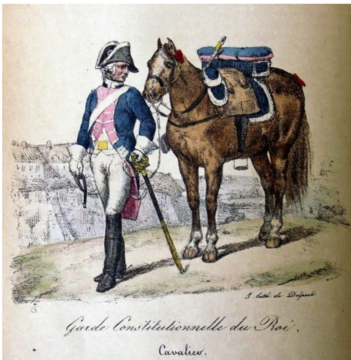
конституционный гвардеец, кавалерист

Часть роялистов пробирается в Париж и вступает в Конституционную Гвардию, которая по декрету Ассамблеи, от 3 сентября 1791 года, должна была защищать Короля и его семью. Конституционная гвардия состояла из 6 пехотных рот по 200 человек, и трех эскадронов кавалерии по 200 человек.