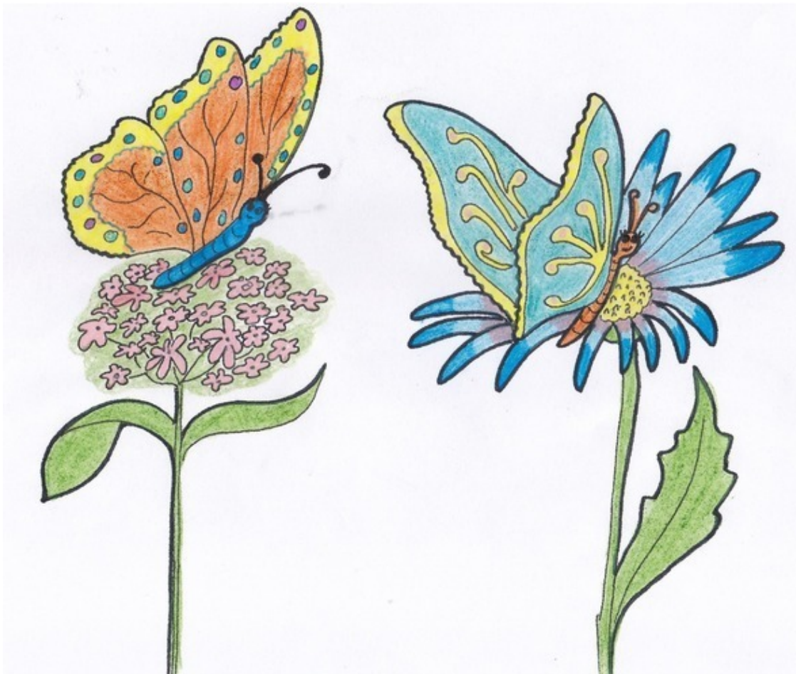
На поляне. Рис. А. Дубровиной

Тела гусениц начали испаряться, как вода на Солнце, и, перед восторженными взглядами детей, появились две огромные Бабочки.