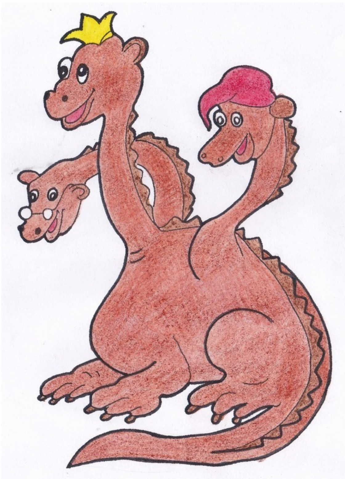
Дракон. Рис. А. Дубровиной