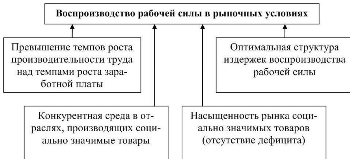
Рисунок 1 – Факторы улучшения воспроизводства рабочей силы в рыночной экономике

Мониторинг и оптимизация структуры издержек воспроизводства рабочей силы особенно важны, учитывая, что в рыночных условиях социальные обязательства государства, связанные с воспроизводством рабочей силы значительно сужаются, особенно в сфере образования, здравоохранения и жилищного строительства.