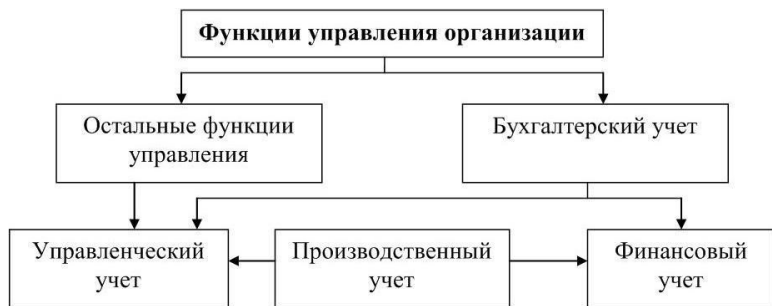
Рисунок 1.2 – Взаимосвязь между финансовым и управленческим учетом

Производственный учет сегодня призван следить за издержками производства, анализировать причины перерасхода по сравнению с предыдущими периодами, планами, сметами и прогнозами, а также выявлять возможные резервы повышения рентабельности производственной деятельности. Он должен четко и детально отражать все процессы, связанные с производством и реализацией продукции на предприятии. Современный производственный учет включает три основных раздела: