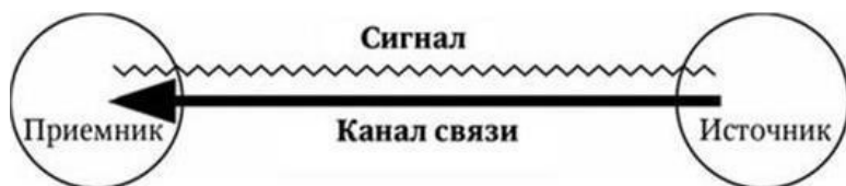
Схема 1.1. Компоненты информационного взаимодействия

То же происходит и с сигналами двух других типов. Отсюда следует первый вывод: с учетом сигнального характера переноса информации она принципиально является неполной.