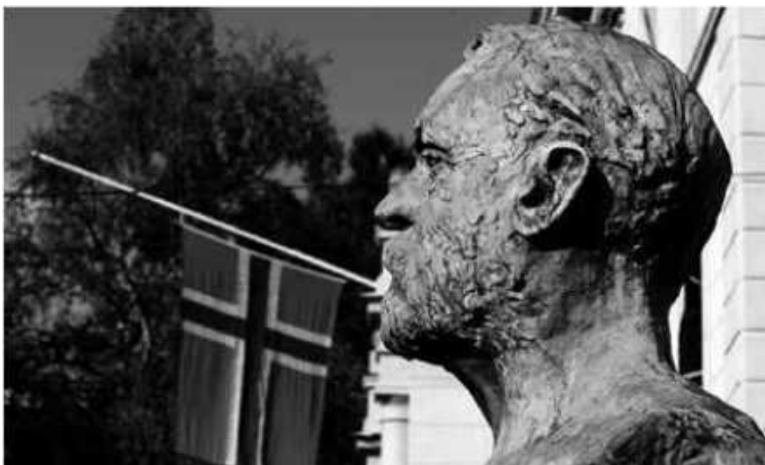
Бюст Альфреда Нобеля на фасаде Института его имени в Осло

Не чужды меценатству были и родственники Альфреда Нобеля. Ранее товарищество нефтяного производства «Братья Нобель» учредило специальную премию его брата Людвиг для выдающихся деятелей техники и промышленности России.