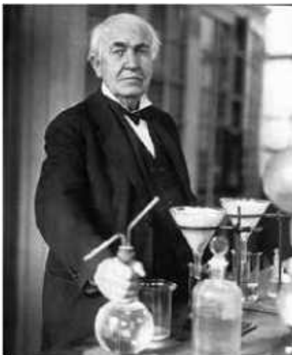
Томас Эдисон в лаборатории

К 11 годам его пылкий ум требовал все больше и больше знаний, поэтому родители привели его в местную библиотеку, – так умение самообразовываться сыграло важную роль в карьере будущего изобретателя. При всей любви к чтению Том был не особо разборчив, он брал с нижней полки первую попавшуюся книгу, прочитывал ее, хватался за рядом стоящую и доходил до самого верха, пока не прочитывал всю книжную полку.