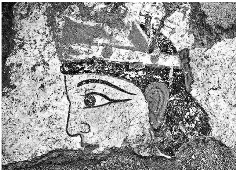
Фрагмент хорезмийской фрески. III век до н. э.

копках. 7 Керамика тогда была лепной, до гончарной дело еще не дошло. Гончарное дело возведено у узбеков в ранг искусства, и невозможно представить, что когда-то в Хорезме, одном из основных гончарных центров Узбекистана, не умели обжигать глину. Но, тем не менее, так оно и было.