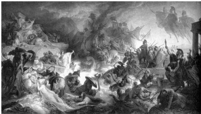
Вильгельм фон Каульбах. Битва при Саламине. 1868

сандр одержал блистательную победу, – пишет в «Сравнительных жизнеописаниях» Плутарх, 25 – он истребил более ста десяти тысяч врагов, но не смог захватить Дария, который, спасаясь бегством, опередил его на четыре или пять стадиев». 26 Спасти Дарию не удалось – его закололи приближенные, то ли для того, чтобы он не попал в плен к преследовавшим беглецов македонянам, то ли в надежде на то, что тело царя остановит преследователей.