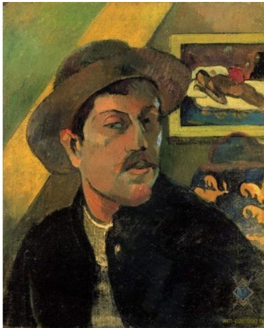
Поль Гоген, Автопортрет

Эжен Анри Поль Гоген (1848 – 1903) – французский живописец, скульптор-керамист и график и крупнейший представитель постимпрессионизма.