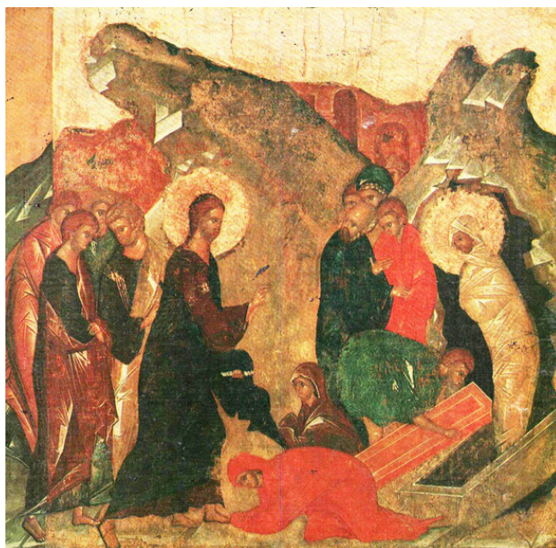
Икона Воскрешение Лазаря. Начало XV в. ГРМ, Санкт-Петербург

Этот евангельский сюжет был довольно распространён среди западноевропейских художников и особенно среди иконописцев. Традиционно у ног Христа изображали сестёр Марфу и Марию, группу иудеев, здесь же были апостолы – все они и засвидетельствовали это чудо.