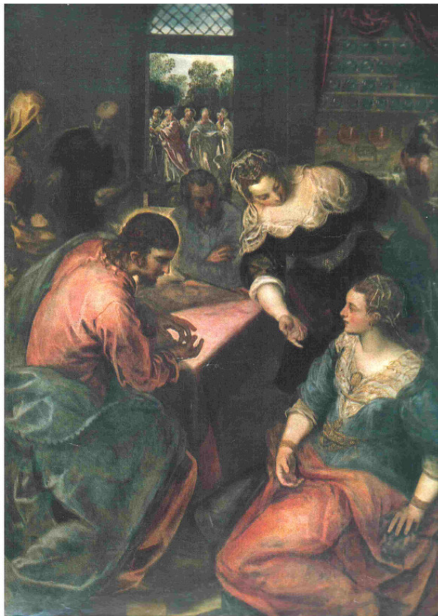
Христос у Марии и Марфы. Итальянский художник Тинторетто. Ок. 1580 г.

Этот евангельский сюжет был довольно распространён среди западноевропейских художников и особенно среди иконописцев. Традиционно у ног Христа изображали сестёр Марфу и Марию, группу иудеев, здесь же были апостолы – все они и засвидетельствовали это чудо.