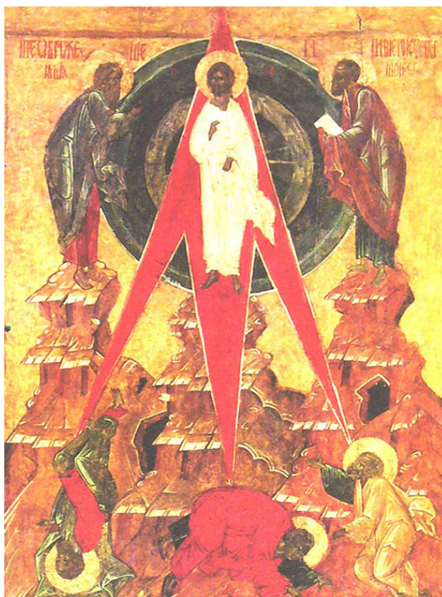
Икона Преображение . Псков, XV в.

В основе всей иконографии Преображения лежит текст Нового Завета, рассказывающий о том, что за несколько дней до своей крестной смерти «Иисус Христос взял трёх своих учеников – Петра, братьев Иакова и Иоанна – и возиёл с ними на гору Фавор. Поднявшись на вершину, Христос стал молиться и вдруг преобразился перед ними. Лик Его излучал сияние, одежды Его сделались блистательными, как снег, „как на земле белильщик не сможет выбелить“; уточняет Евангелист Марк. И явились к Иисусу Илия с Моисеем – ветхозаветные пророки – и беседовали с Ним. И вдруг ...облако осенило их, и раздался из него глас: „сей Сын Мой возлюбленный, так Его слушайте“. И, услышав, ученики от страха пали на лица свои» .