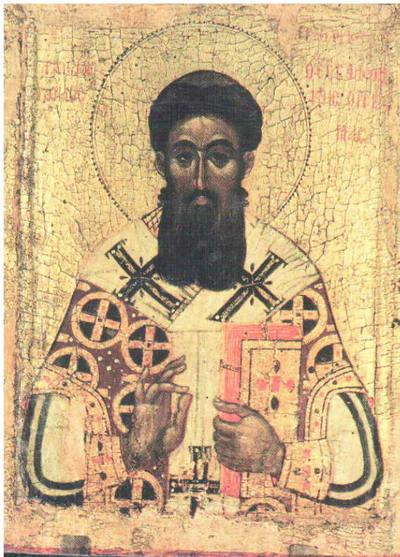
Византийская икона Григорий Палама . Один из основателей исихазма – учения о свете как божественной энергии. XIV в.

ваяния и зодчества. Основной круг научных интересов – древнерусская живопись. Одна из первых среди русских патриотов она начинает разоблачать предательскую роль М. С. Горбачёва. Ставит свою подпись первой под рядом воззваний и обращений, предостерегающих русский народ от опасных планов «прорабов перестройки».