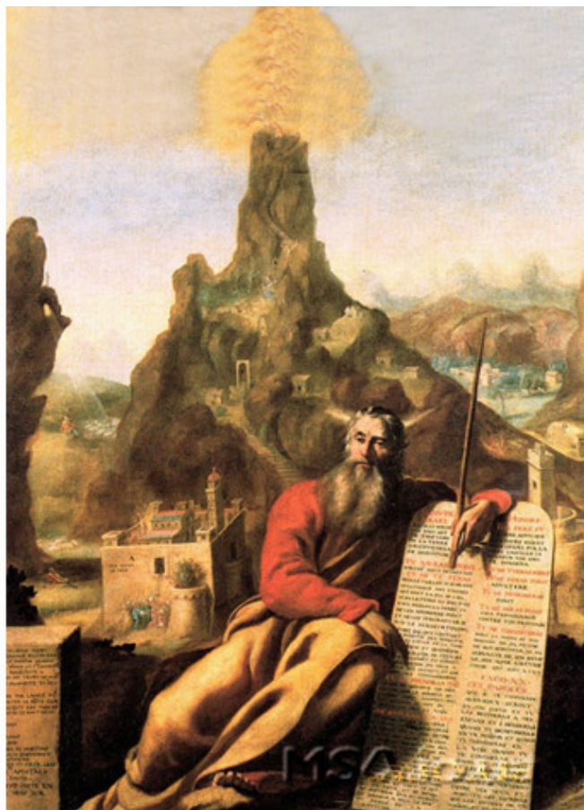
Фреска Моисей на Синае . Картина Жака де Летэна. XVII в. Музей изящных искусств. Город Тура.

Русский религиозный мыслитель двадцатого века Сергей Булгаков писал: