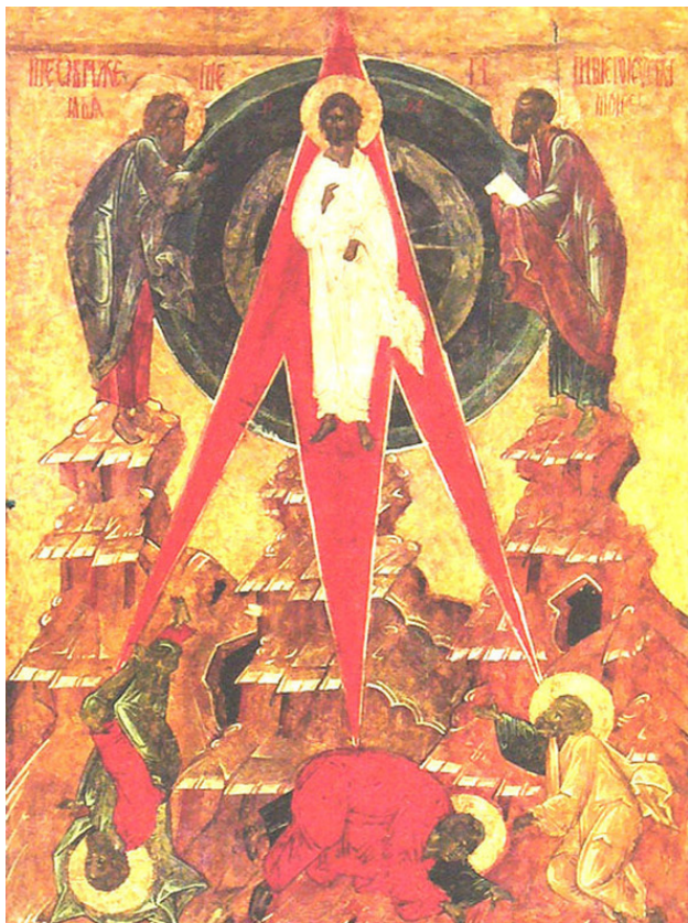
Икона Преображение . Псков, XV в.

В основе всей иконографии Преображения лежит текст Нового Завета, рассказывающий о том, что за несколько дней до своей крестной смерти « Иисус Христос взял трёх