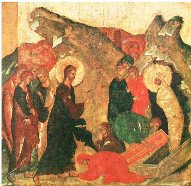
Икона Воскрешение Лазаря . Начало XV в. ГРМ, Санкт-Петербург

среди западноевропейских художников и особенно среди иконописцев. Традиционно у ног Христа изображали сестёр Марфу и Марию, группу иудеев, здесь же были апостолы – все они и засвидетельствовали это чудо.