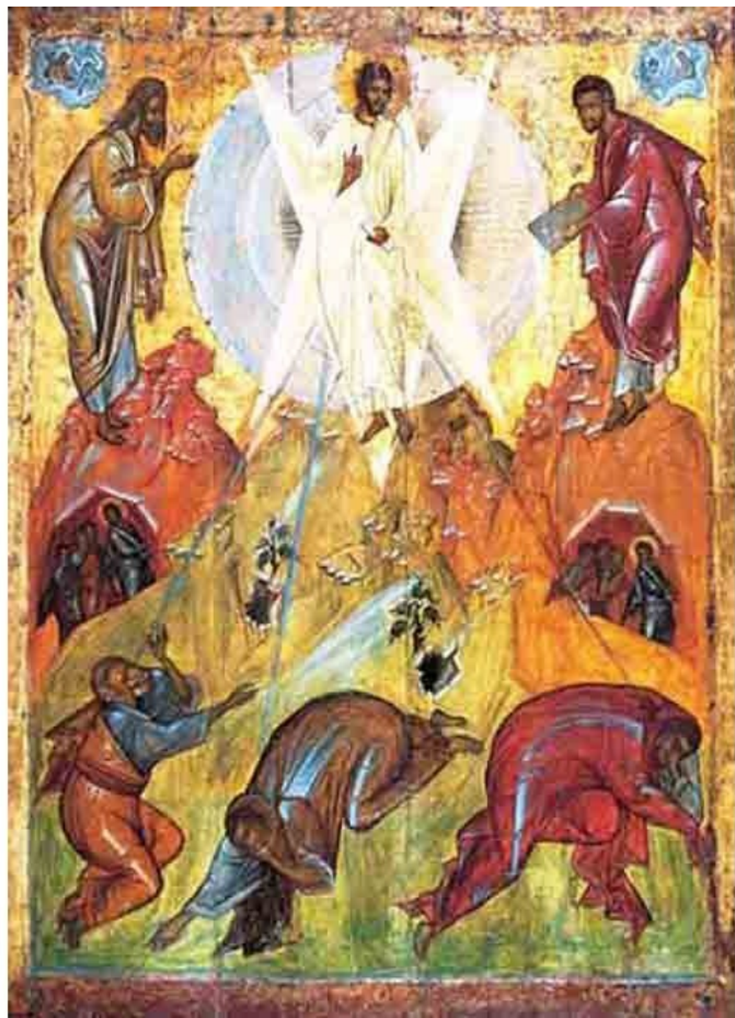
Преображение. Икона Преображенского собора Переславля-Залесского. Около 1403 г. ГТГ. Москва