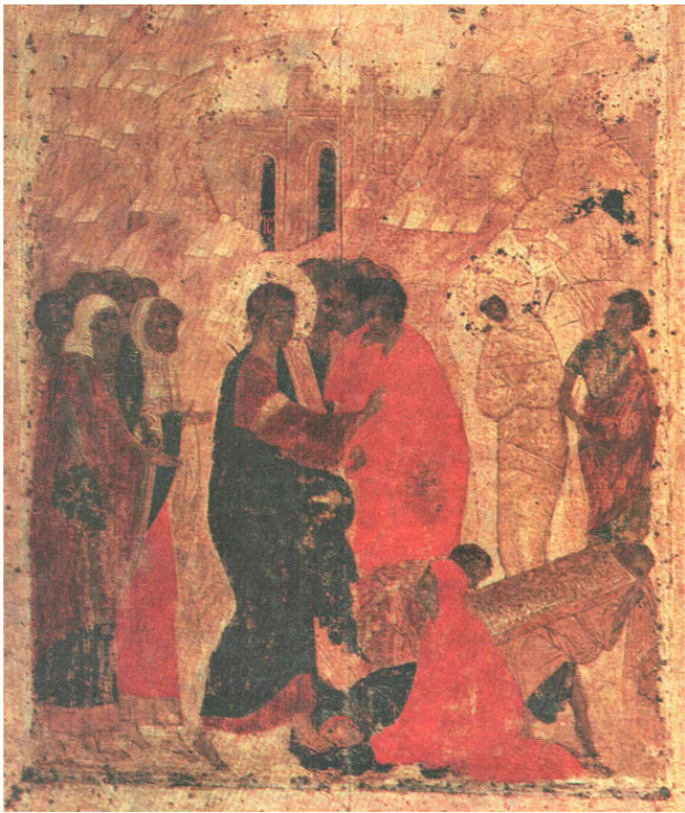
Икона Воскрешение Лазаря из Благовещенского собора Московского Кремля. 1406 г.

В Благовещенском соборе Московского Кремля сохранилось одиннадцать икон из праздничного ряда высокого иконостаса, в работе над которыми, как считает В. Брюсова, принимал участие Рублёв под руководством Даниила Чёрного. Одна из этих икон – Воскрешение Лазаря, непосред-