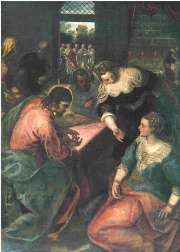
Христос у Марии и Марфы. Итальянский художник Тинторетто. Ок. 1580 г.

Этот евангельский сюжет был довольно распространён