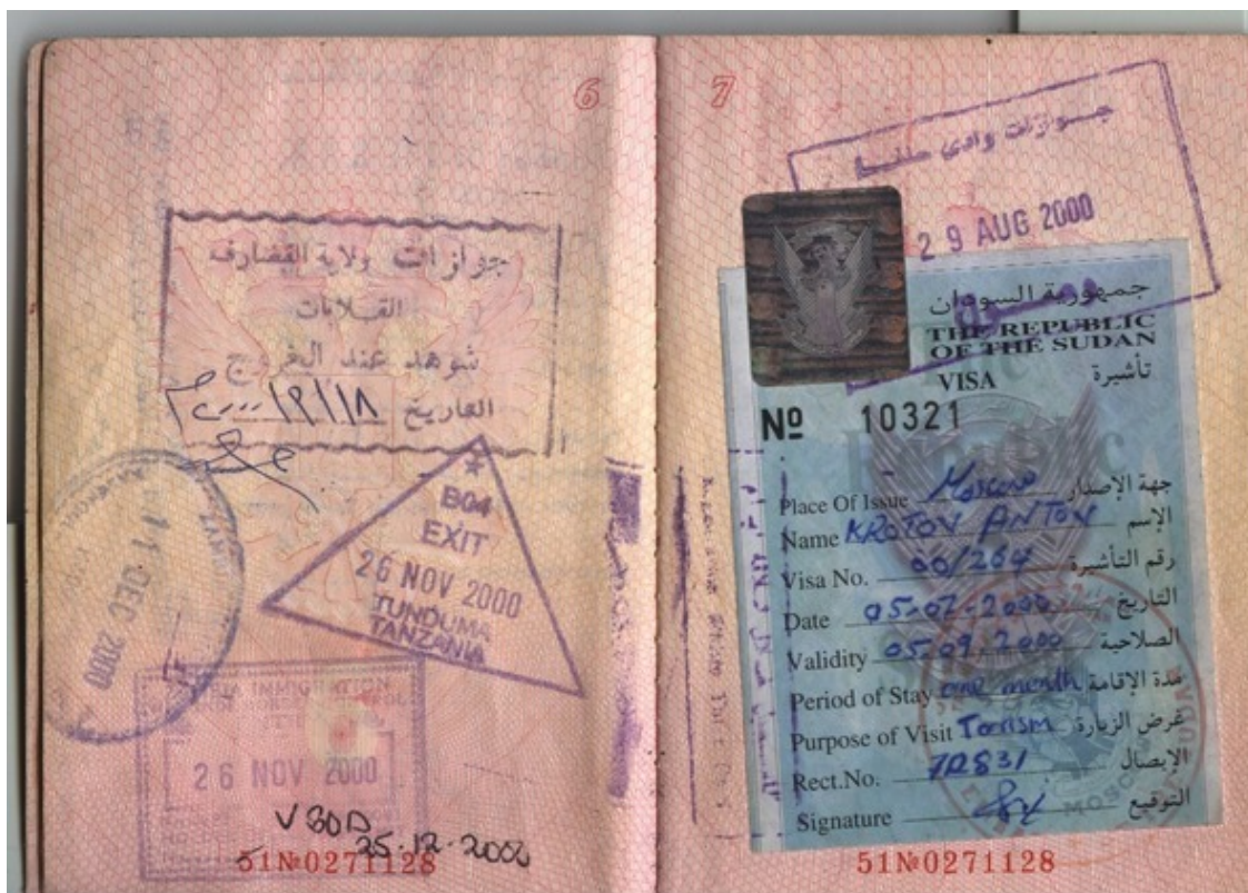
Виза Судана у меня в паспорте