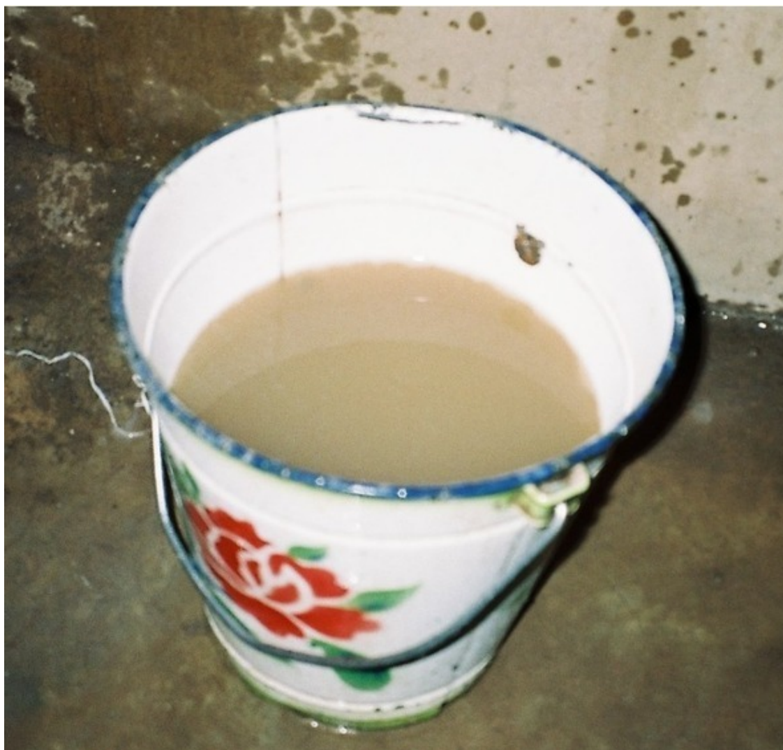
Вода питьевая водопроводная (в Кариме)