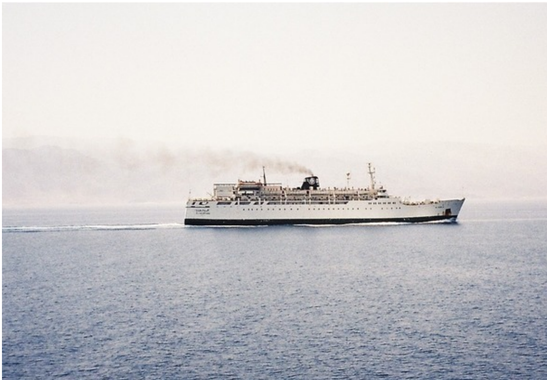
Паром через Акабский залив

нии туда-сюда мы потеряли два дня и по двадцать лишних долларов на паром, но получили ценный опыт.