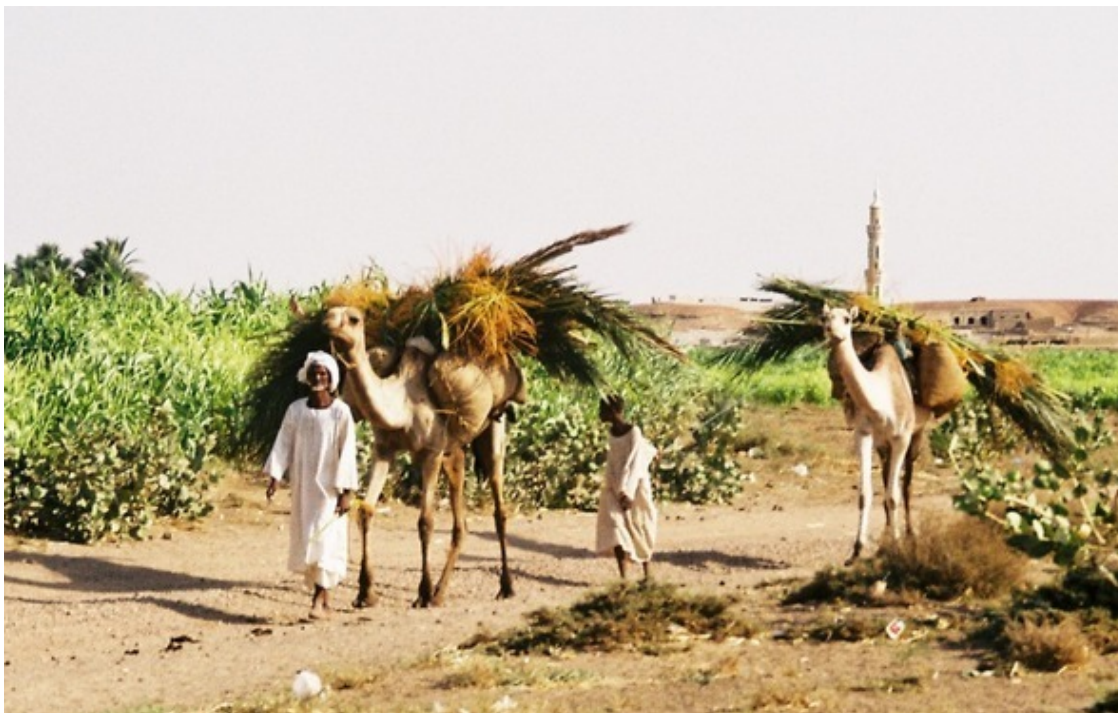
Пейзаж сельского Судана