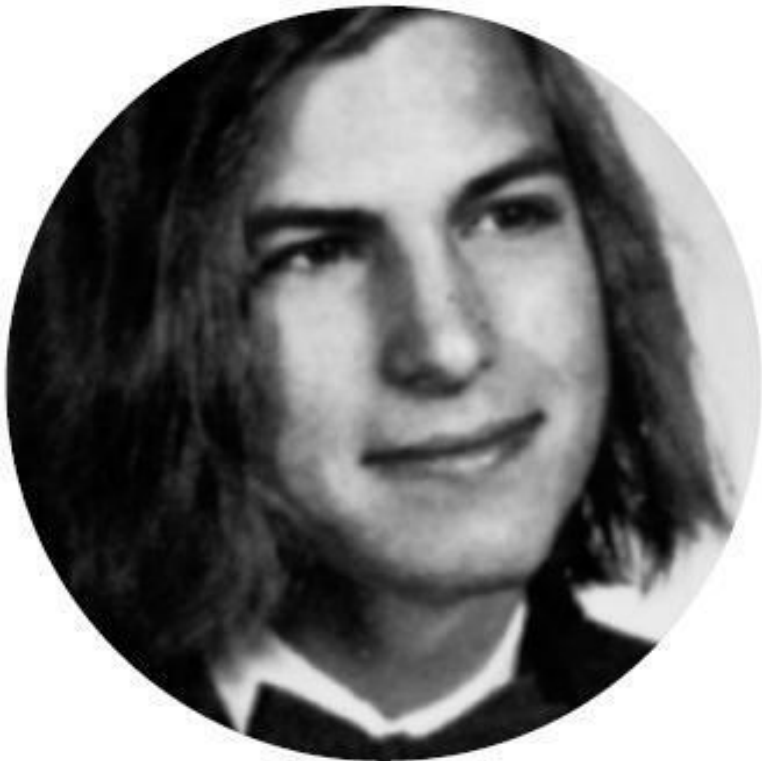
Из альбома выпускников школы Хоумстед, 1972 год