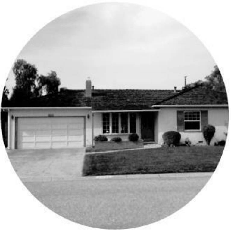
Дом в Саннивейле и гараж, где начиналась компания Apple