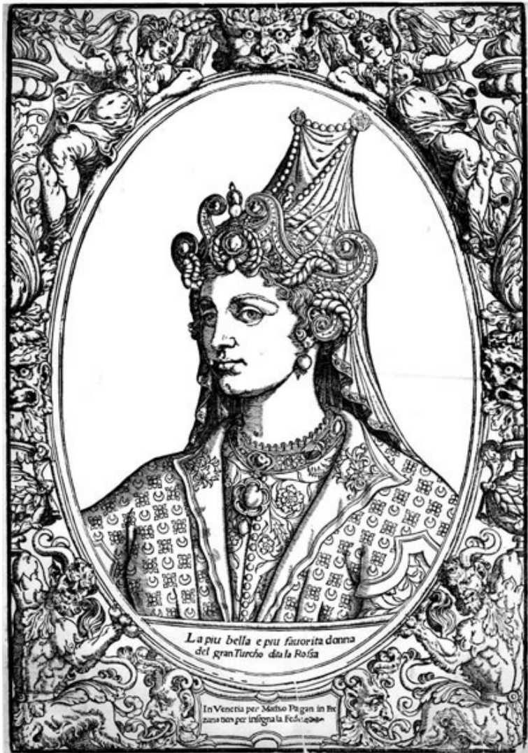
La piu bella e piu favorita donna del granTurcho da la Rosa

In Venetia per Matteo Pagan in sua bottega per l'ingegna la Felice 1688