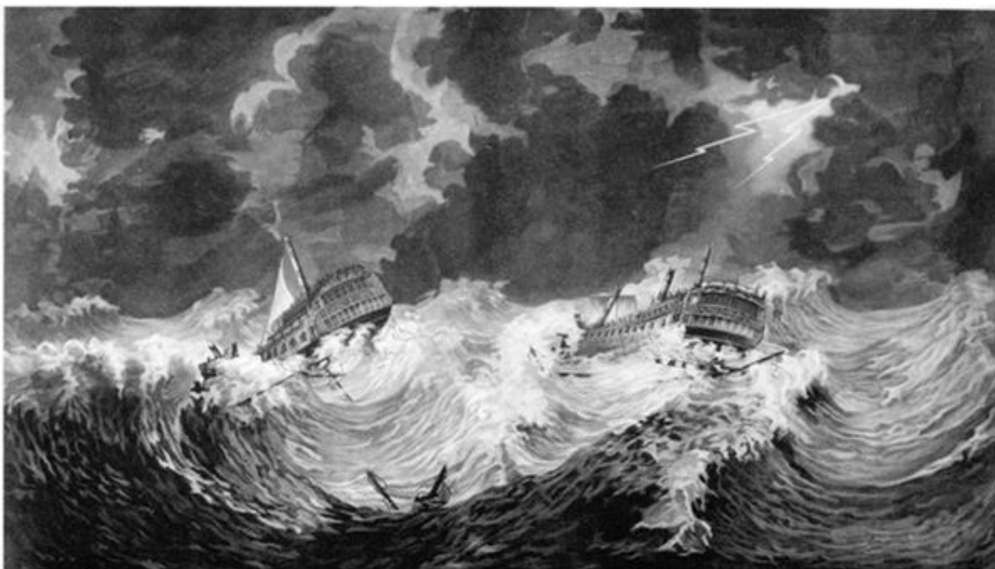
Флагманский корабль П. Паркера «Бристоль» (справа) 1780

Команда «Ловестова» относилась к молодому лейтенанту с уважением, а поэтому, когда Нельсон покидал фрегат, матросы преподнесли ему на память шкатулку из слоновой кости для хранения домино, выполненную в виде их фрегата. Такого знака внимания со стороны команды удостаивались в те времена далеко не многие из офицеров.