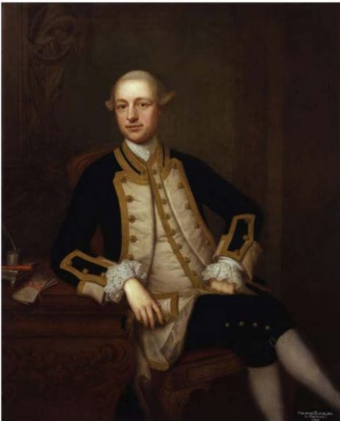
Капитан Морис Саклинг (1726 – 1778)

Весной 1770 года Горацио Нельсон прочитал в газете, что Морис Саклинг только что назначен капитаном 64-пушечного линейного корабля «Резонабль», недавно захваченного у французов, и теперь активно готовит его к предстоящим боям с испанцами. Это был шанс, и Горацио решил его не упускать! Отец в это время лечил застарелые болезни в не столь отдаленном курортном городишке Бат. Гораций тут же побежал к старшему брату Уильяму и попросил его написать отцу, что он хочет служить у дядюшки Мориса.