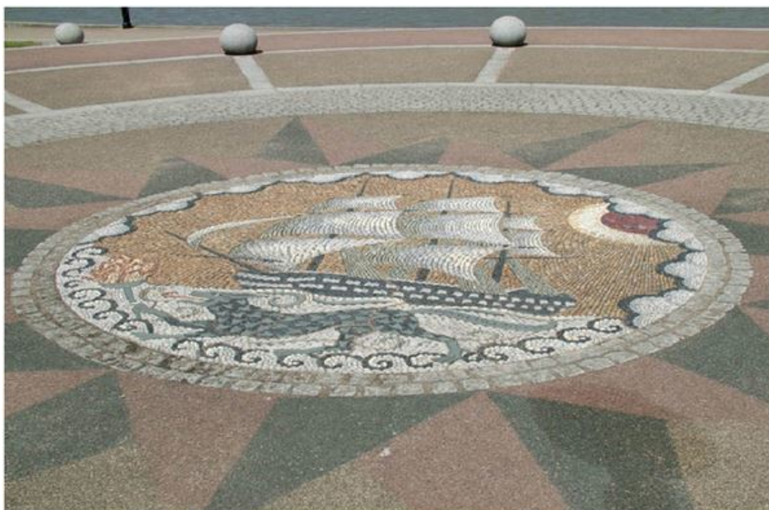
Мозаика в аббатстве Ингресс: стилизованный линейный корабль «Вустере» 15