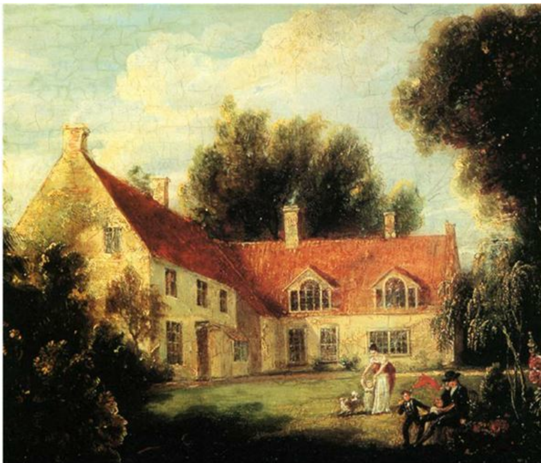
Дом в местечке Бернем-Торп, где в 1758 году родился Горацио Нельсон. Художник Ф. Пококк

Горацио выжил, однако рос на редкость хилым и болезненным. Остаток здоровья забирала местная болотная лихорадка. Однако родина всегда остается родиной, места, которые посторонним кажутся безобразными и унылыми, вызывают у тех, кто здесь родился, самое искреннее умиление и восторг.