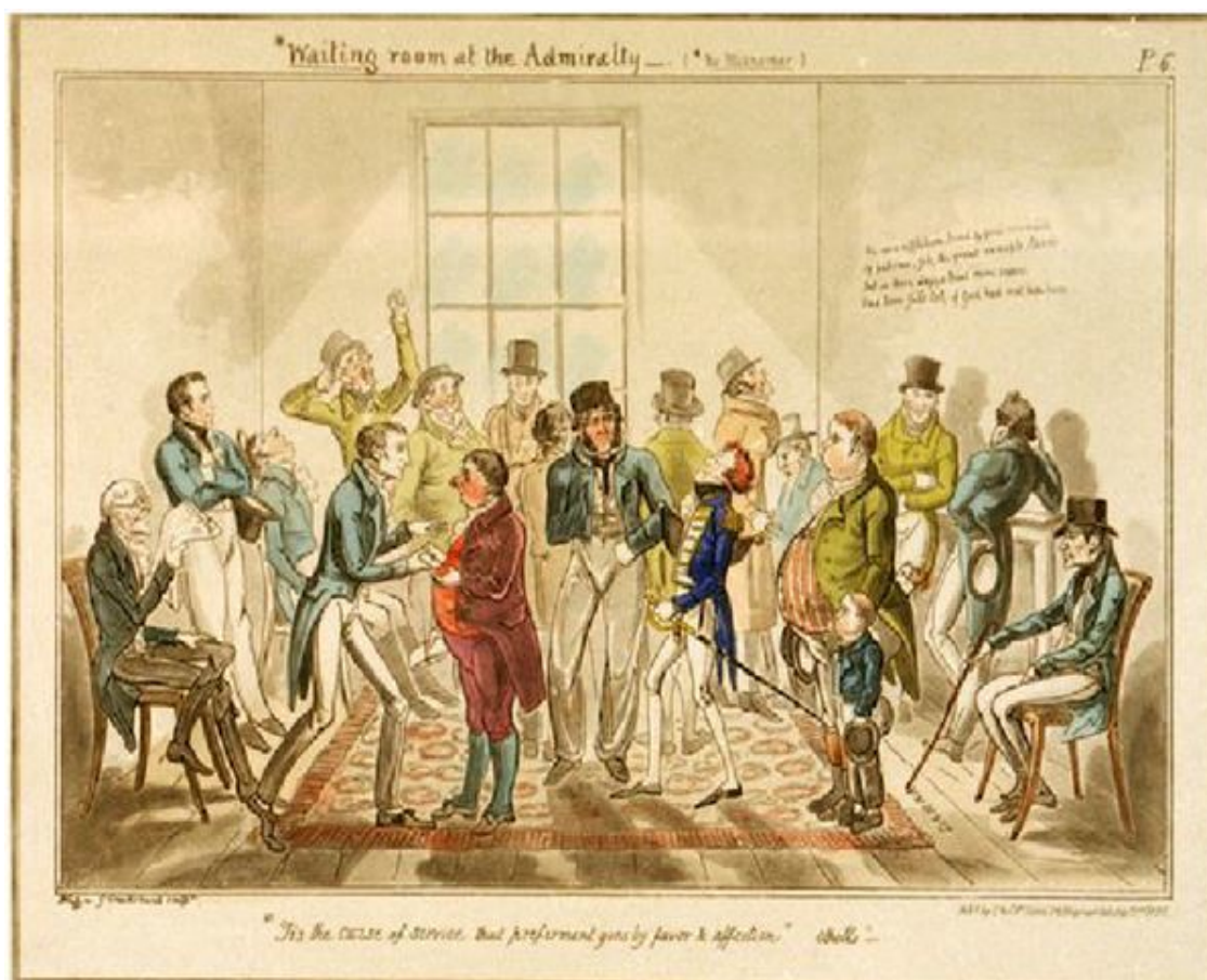
Приемная Адмиралтейства (кладбище многих надежд); карикатура 1835

Кроме этого, Нельсона ждет и новая большая проблема, с которой он никогда раньше не сталкивался. На его просьбу в Адмиралтейство о предоставлении соответствующей должности следует ответ, что для Нельсона нет вакансии. При жизни дяди Мориса такого никогда не могло быть. Ответ из Адмиралтейства – первый звонок, что теперь у Нельсона более нет связей в высших флотских сферах. Теперь он такой же, как и все.