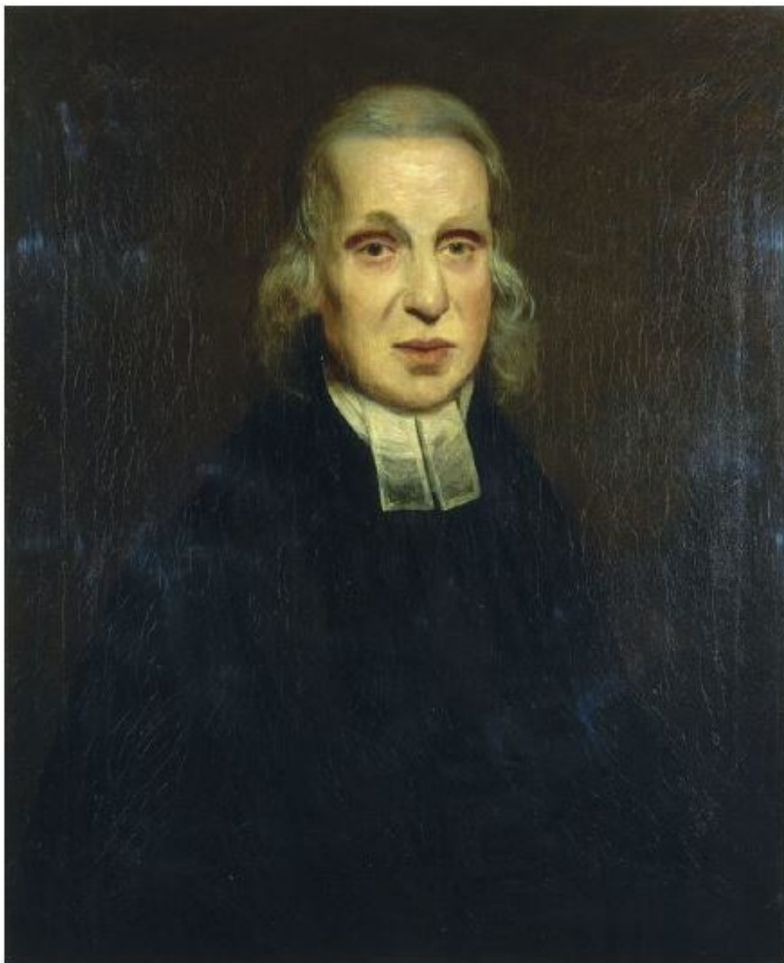
Отец лорда Нельсона преподобный Эдмунд Нельсон Художник Бичи У. (1800 год)

ный Эдмунд назвал Горацио в честь его крестного отца – второго барона Уолпола. Упрекать Эдмунда в столь чрезмерно учтивом отношении к родне своей жены вряд ли стоит. Умный священник понимал, что в жизни его детям придется нелегко без поддержки родственников. В роду самого Нельсона влиятельных людей не было, зато таковые имелись в роду жены, а потому он, отец многочисленного семейства, стремился всеми силами заручиться дружбой влиятельных Саклингов, чтобы те в будущем не оставили его детей. Как показало время, расчет дальновидного Эдмунда Нельсона оказался на редкость верен.