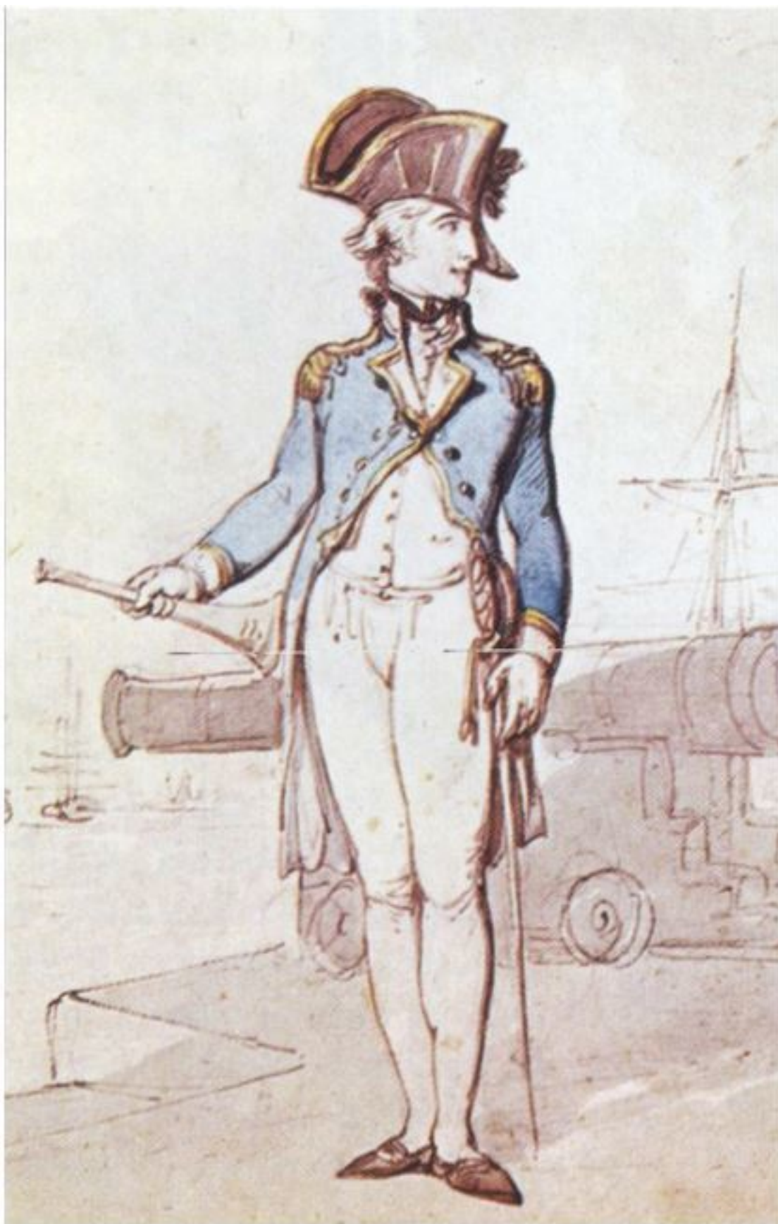
Капитан (нач. XIX в.)