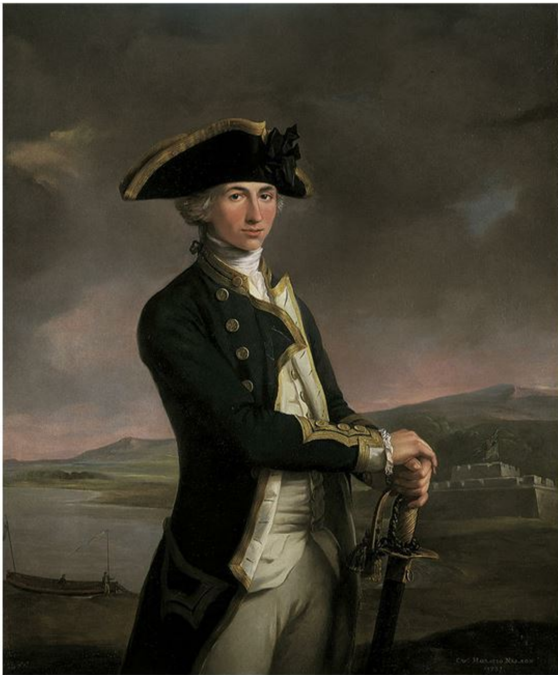
Нельсон в 1781 году. Художник Ф. Риггс

Своему бывшему начальнику, а теперь и другу капитану Локеру Нельсон писал в те тяжелые для себя дни: «Приехав сюда, я был так болен, что не мог сам подниматься с постели и испытывал невыносимую боль при малейшем движении. Однако, благодаря Богу, сейчас я на пути к выздоровлению. Трижды в день принимаю лекарство, столько же раз пью целебную воду, принимаю ванны через день – я уж не говорю о том, что совсем не пью вина, что, по моему, хуже всего».