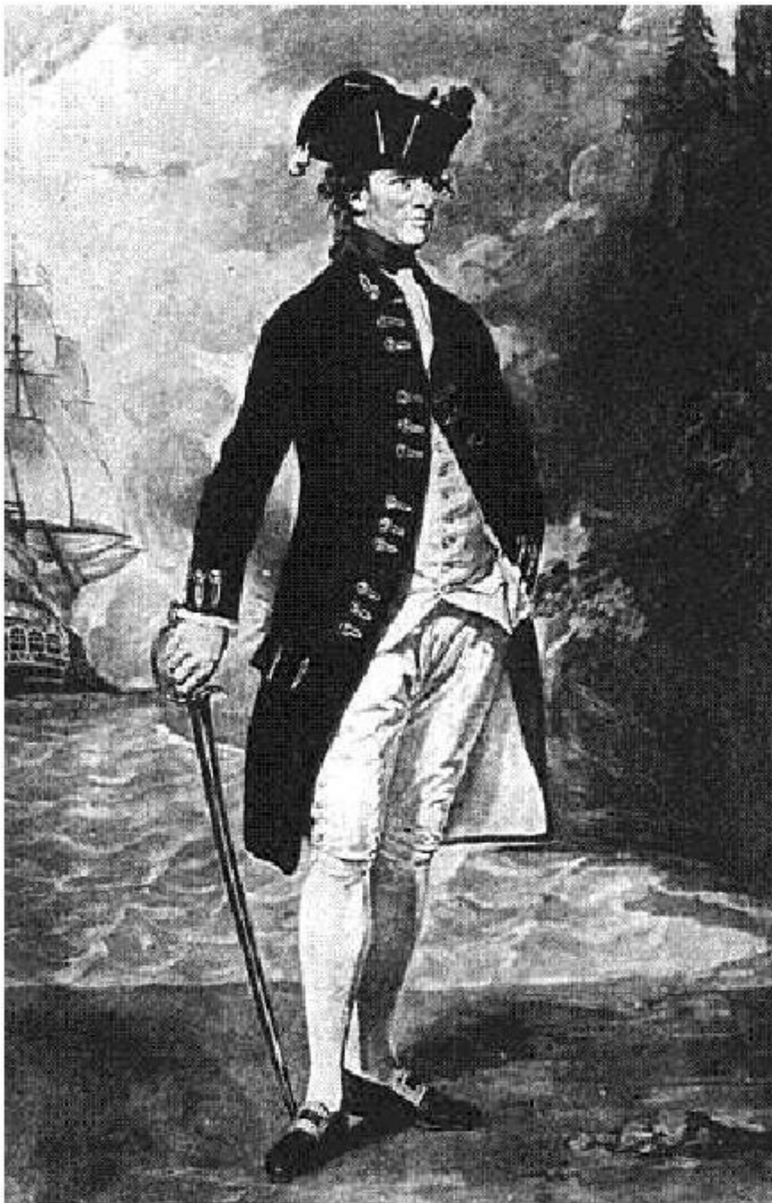
Адмирал Хайд Паркер младший (1739–1807)