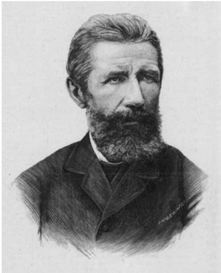
Леонард Совинский (1831–1887) – польский поэт, писатель, переводчик, историк литературы. Активный дея-