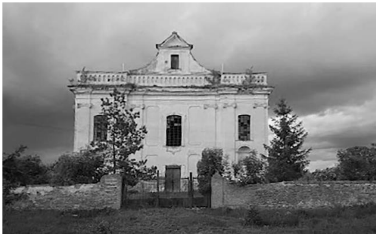
Храм в дер. Тессы