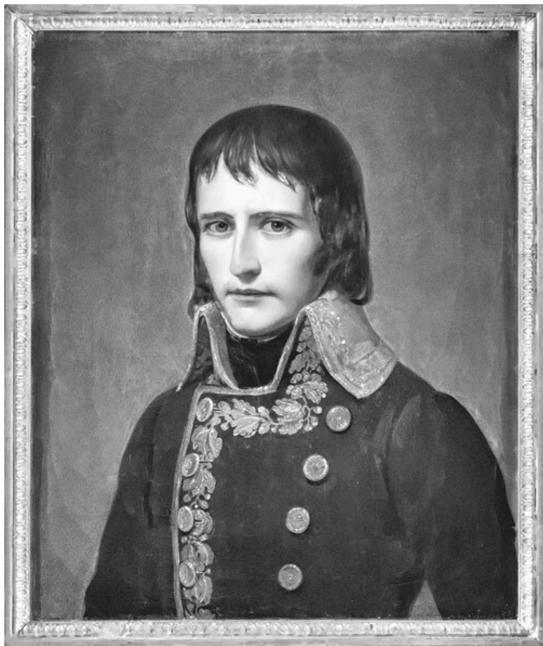
Неизв. художник. Портрет Наполеона Бонапарта. 1795