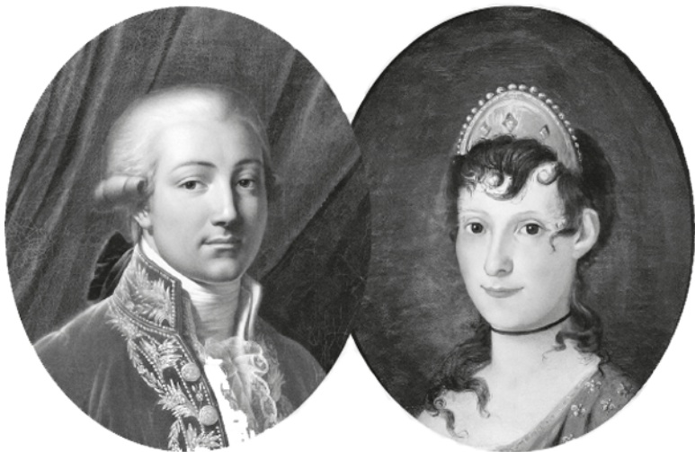
Анн-Луи Жироде-Триозон. Портрет Карло Бонапарте. 1805

Поскольку каждый имеет определенное суждение о Наполеоне, это жизнеописание никого не сможет удовлетворить полностью. Одинаково трудно удовлетворить читателей, когда пишешь о предметах либо малоинтересных, либо представляющих слишком большой интерес. Стендаль (Мари-Анри Бейль)