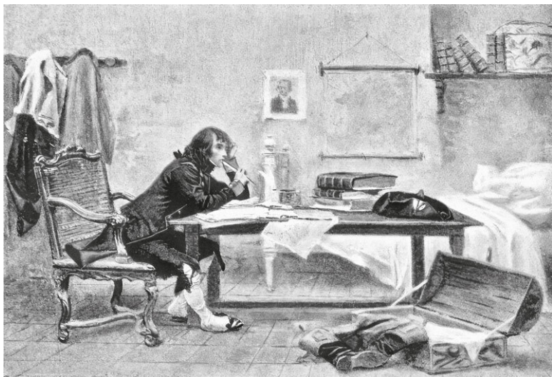
Франсуа Фламенг. Наполеон в Оксонне. 1895