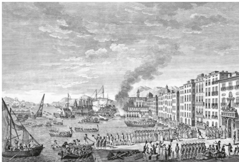
Осада Тулона. Гравюра. 1793