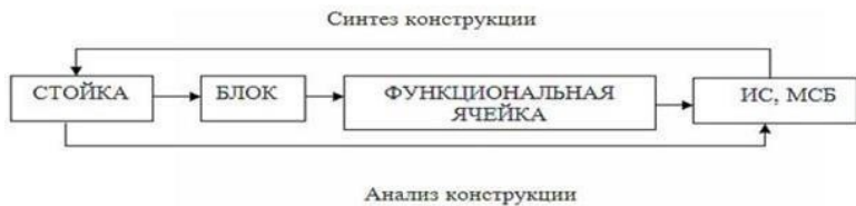
Рис. 2. Принцип системности в процессе конструирования