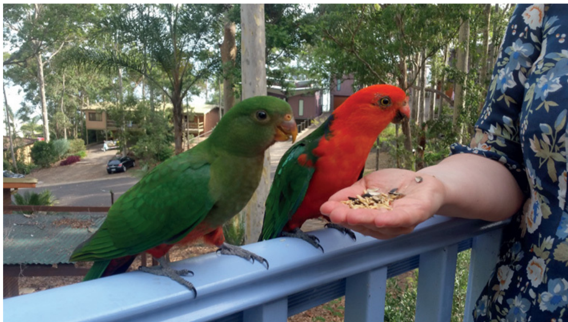
Иллюстрация для начала: это австралийские королевские попугаи восточного побережья. Встречаются даже в Сиднее, а уж в стадах в километрах от него этих птичек может быть вообще полно. Очень милые создания. И не так противно орут, как, например, какаду.

Скоро сказка сказывается, да не скоро дело делается, и начну я не со своего собственного рассказа, а с упоминания тех хороших книг про Австралию, которые я рекомендовал бы прочитать или перечитать. Первую из них отлично помню по своему детству, и она, если честно, – лишь отчасти об этой стране. Это хорошо известные моему поколению «Дети капитана Гранта» Жюль Верна. Поскольку злополучная 37-я параллель, вдоль которой герои искали своего капитана, проходит и через Австралию, то немалая часть книги посвящена описанию этой страны. Более того, мне почему-то кажется, что моя следующая цитата из Жюль Верна вас очень заинтересует: