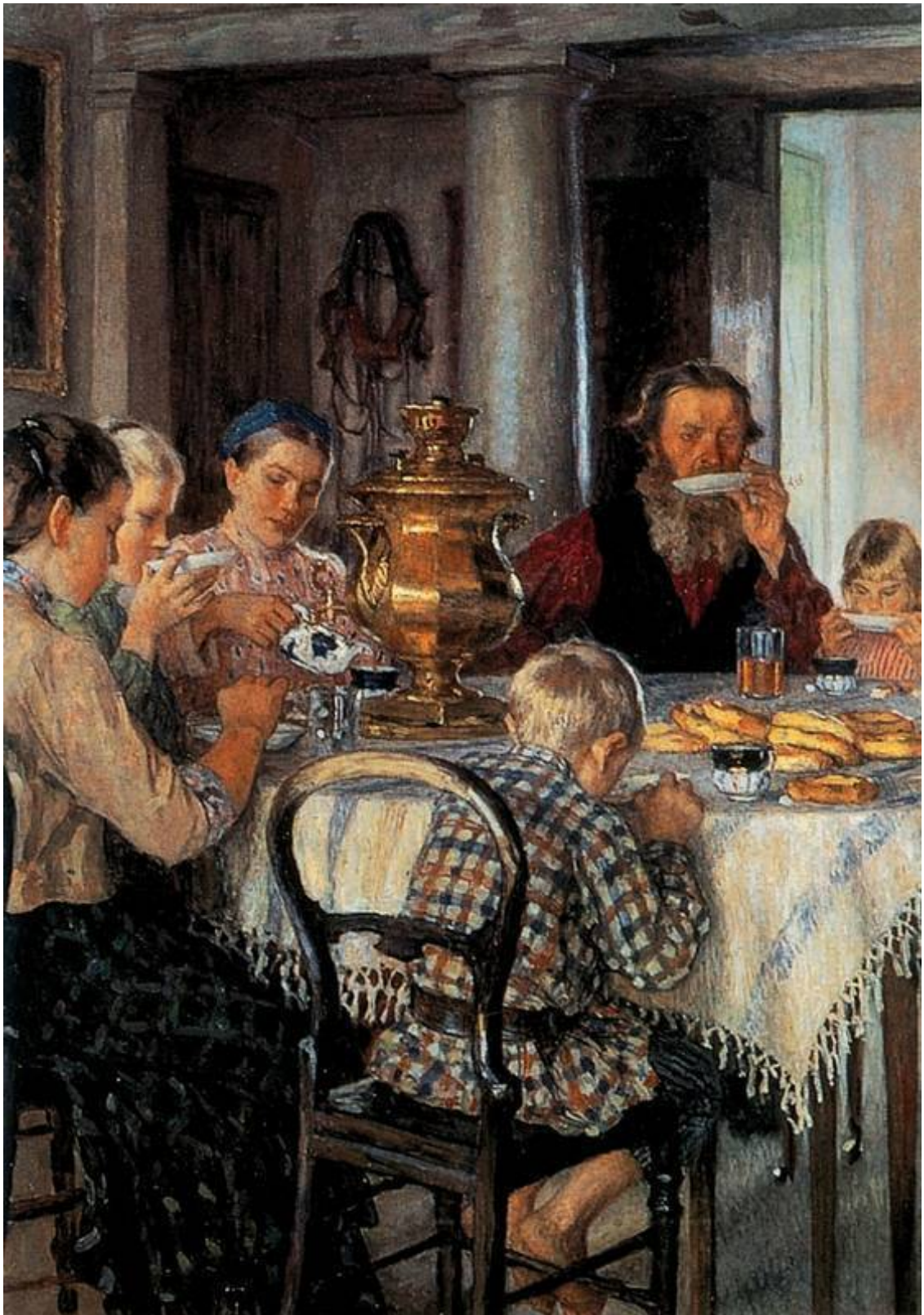
Новые хозяева (фрагмент). Богданов-Бельский Н. П.