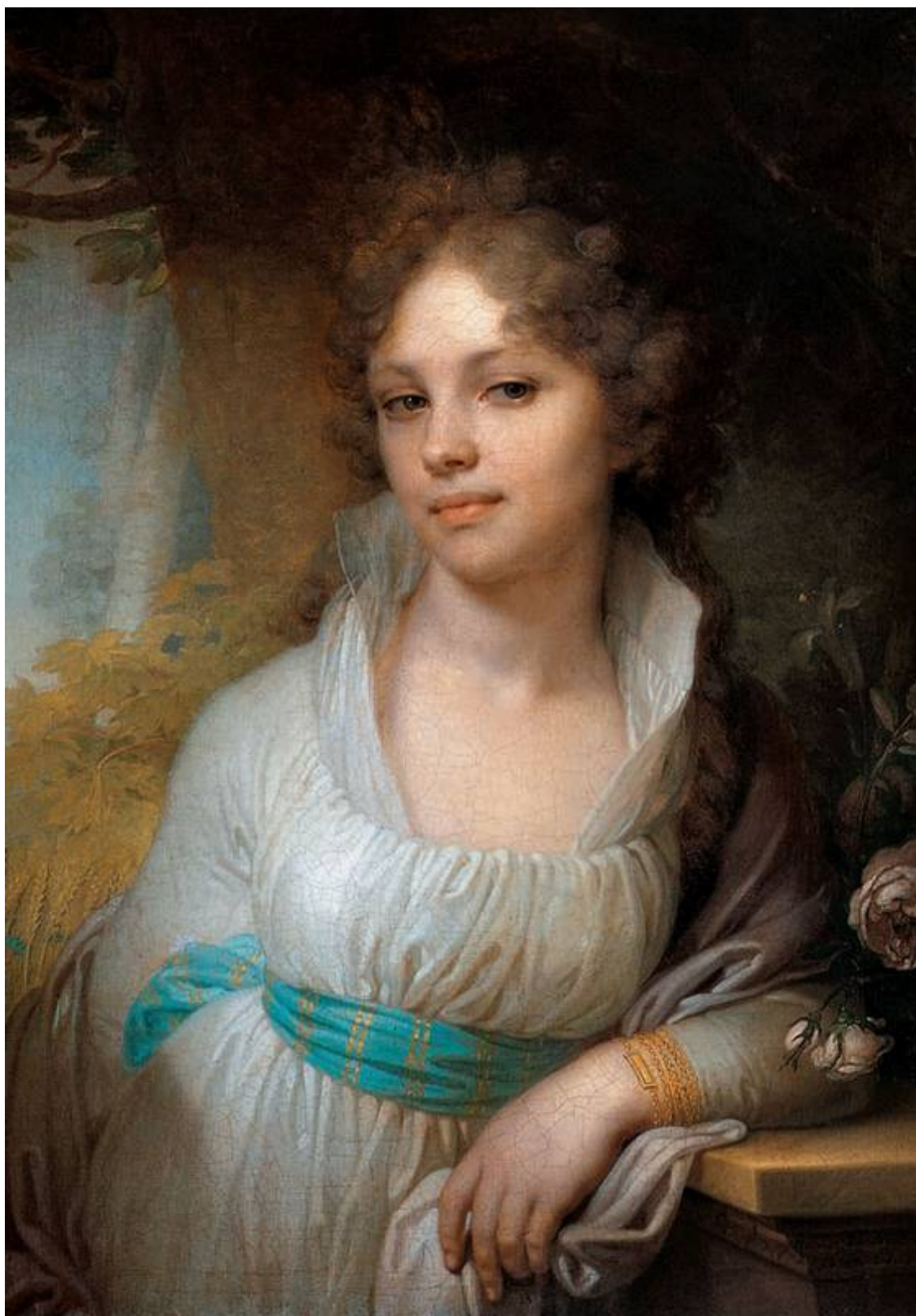
Портрет М. И. Лопухиной. Боровиковский В. Л.

Самолюбие и самомнение у нас европейские, а развитие и поступки азиатские. А. П. Чехов