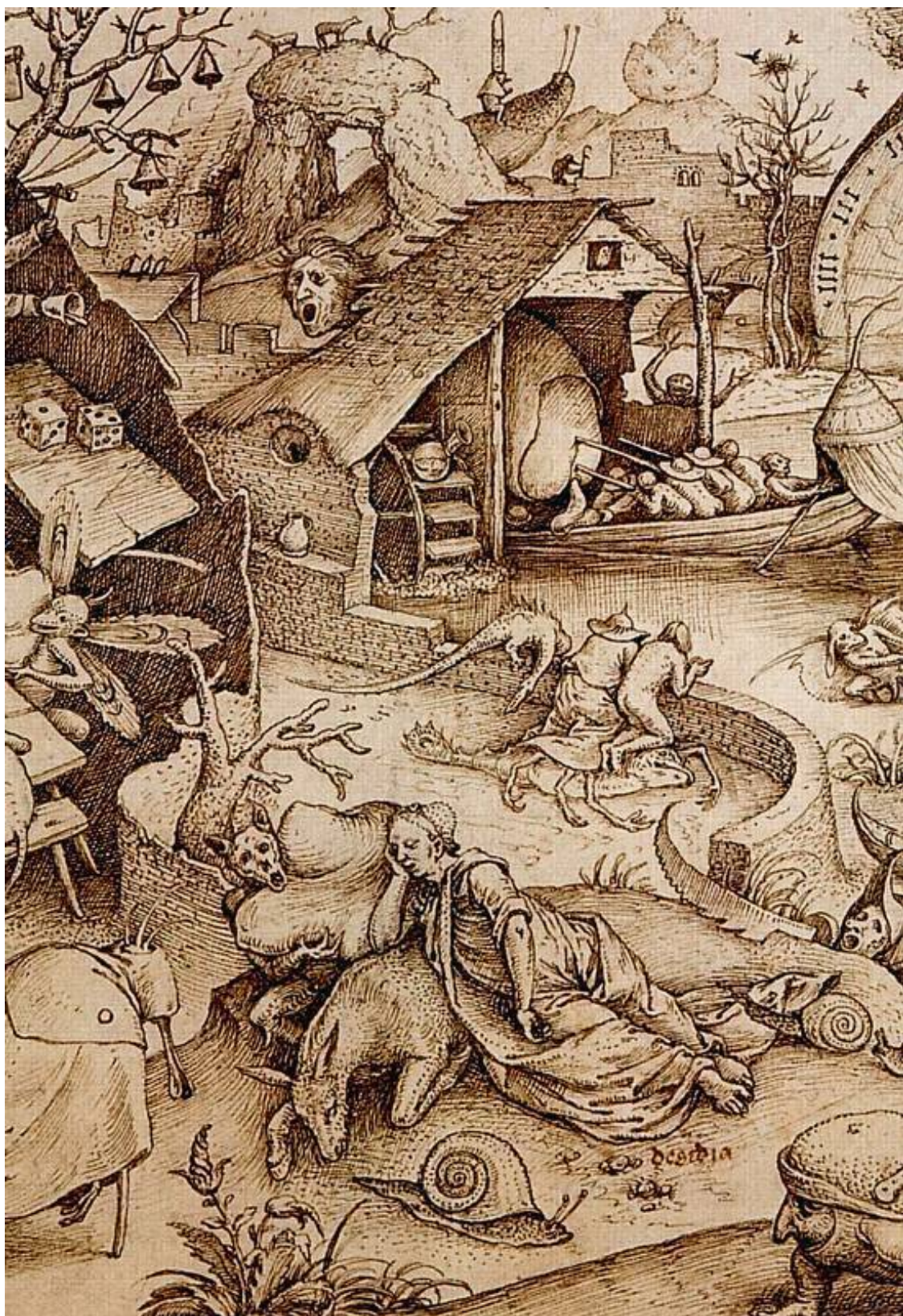
Брейгель П. Лень (фрагмент)

Есть несколько способов справиться с искушением. Самый верный из них – трусость. Марк Твен