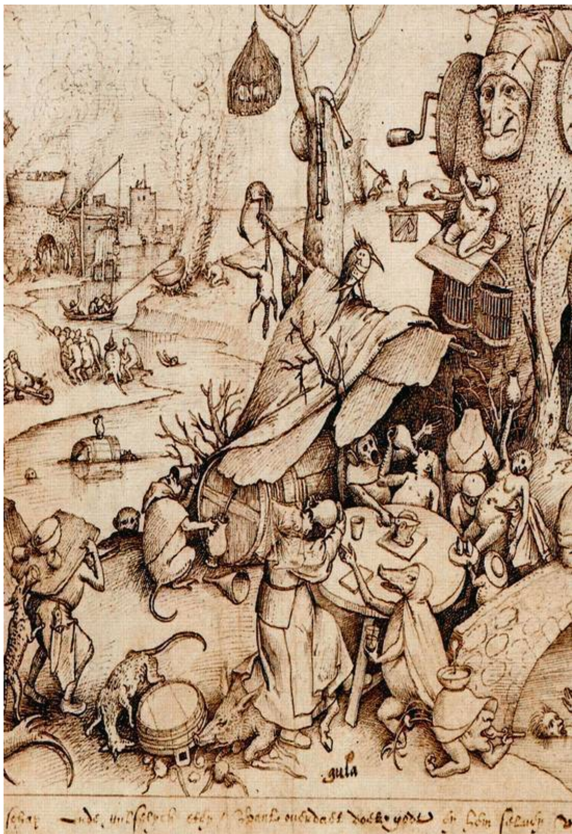
Брейгель П. Чревоугодие (фрагмент)