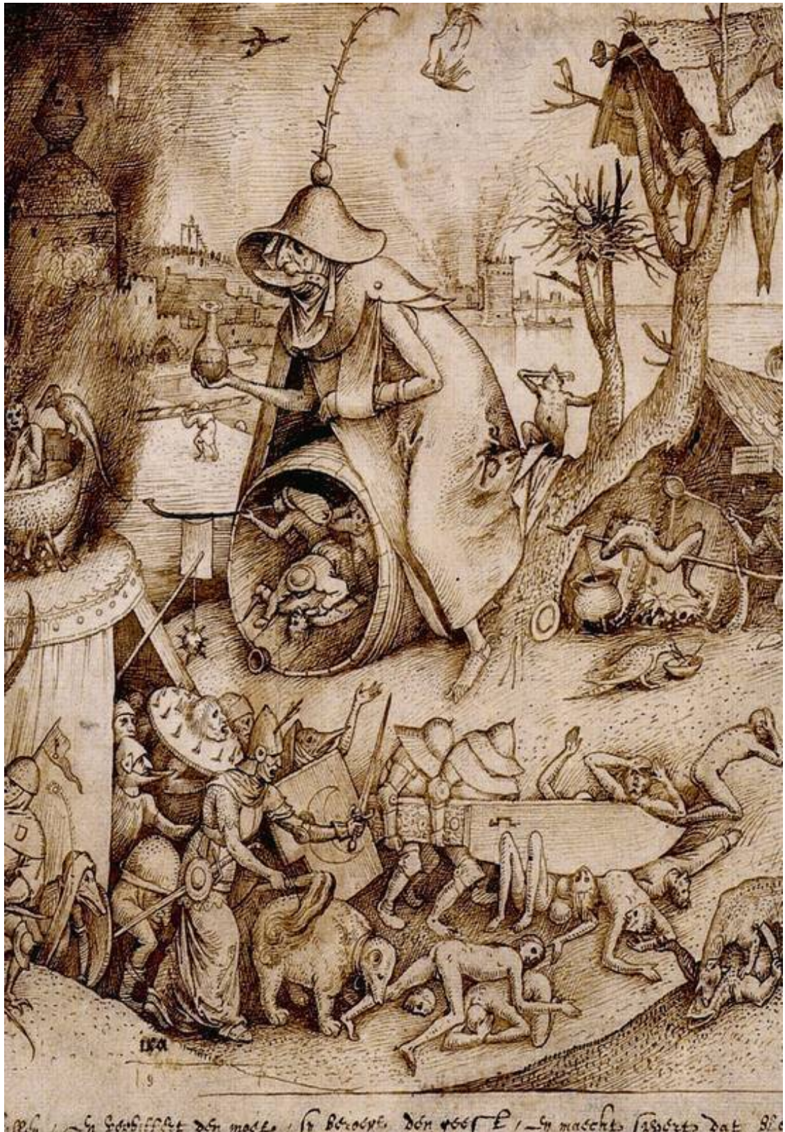
Брейгель П. Гнев (фрагмент)

Дети дерзки, привередливы, вспыльчивы, завистливы, любопытны, своекорыстны, ленивы, легкомысленны, трусливы, невоздержанны, лживы и скрытны; они легко раздражаются