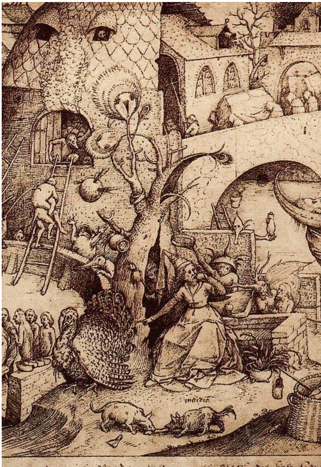
Брейгель П. Зависть (фрагмент)