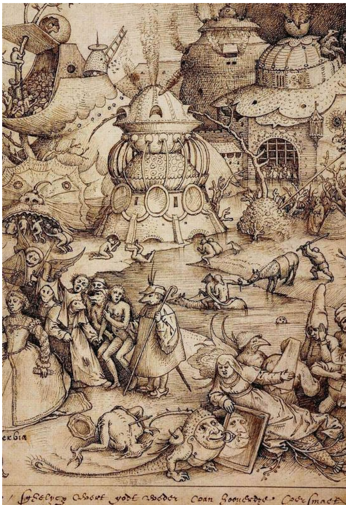
Брейгель П. Тщеславие (Гордыня) (фрагмент)