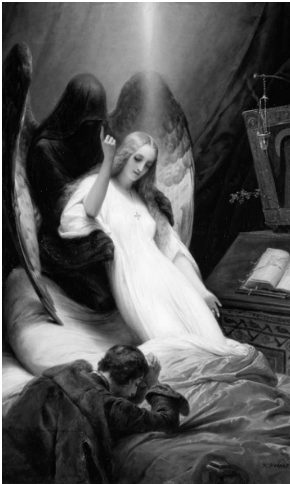
Орас Верне. Ангел смерти