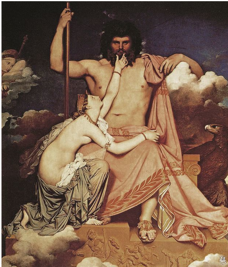
Юпитер и Фетида. Художник О. Энгр

Феретрий – древняя ипостась Юпитера, свидетельствующая