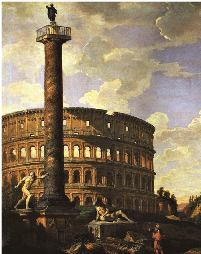
Римская фантазия (фрагмент). Художник П. Панини