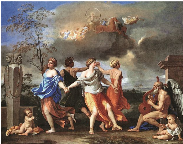
Танец под музыку времени. Художник Н. Пуссен

Рассказывают также историю о Янусе и нимфе Карне, в которую он был влюблен. Карна избегала общества мужчин, предпочитая охотиться с дротиками на зверей и птиц. Много юношей искали ее любви, и самым настойчивым она говорила, что при свете солнца ей стыдно ответить их просьбам, но предлагала пройти в темную пещеру, где обещала ласки. Сама же, вместе того чтобы идти за ними, пряталась в густом кустарнике.