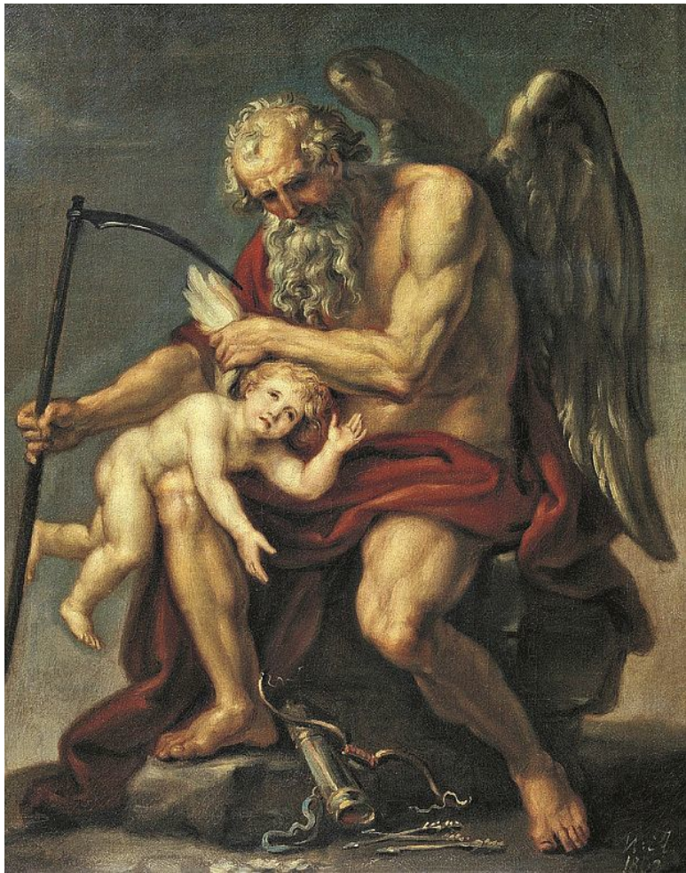
Сатурн с косой, сидящий на камне и обрезающий крылья Амуру. Художник И. Акимов