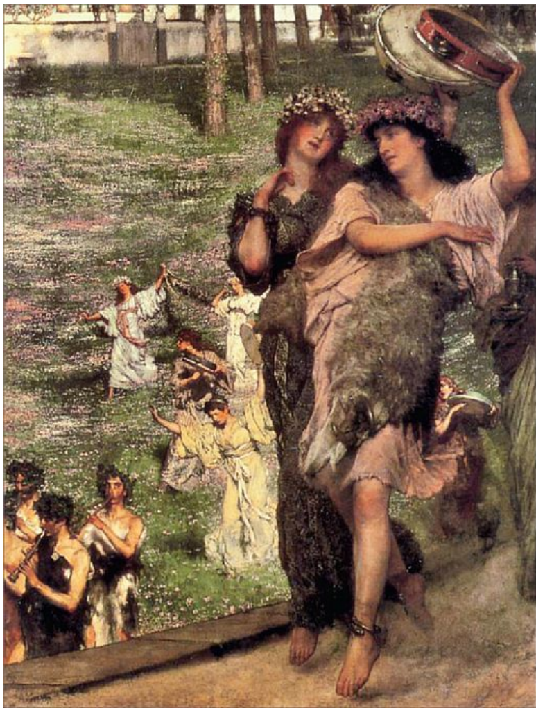
По дороге в храм. Художник Л. Альма-Тадема