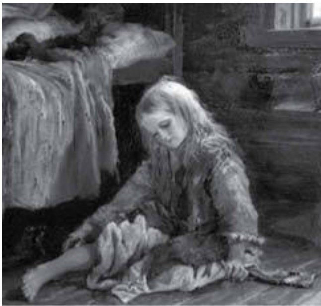
Девочка. 1877 г. Худ. Алексей Корзухин