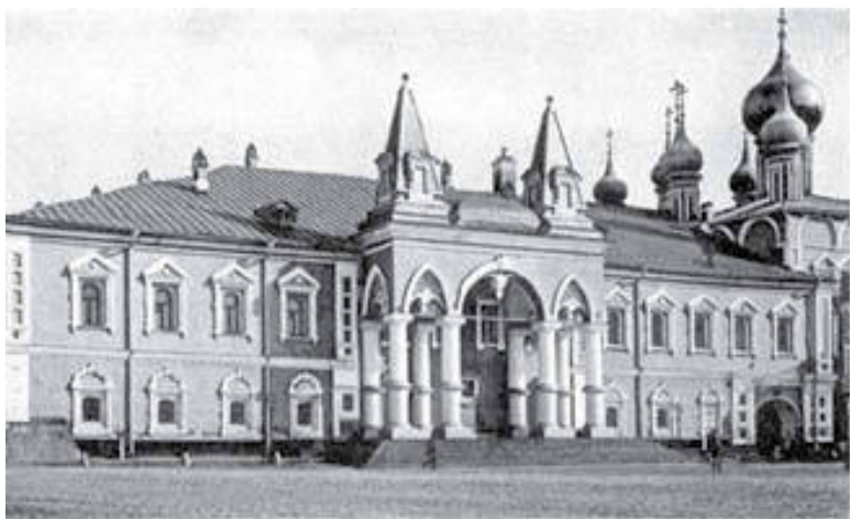
Чудов монастырь в Кремле. Начало XX в. Полностью сне-

ке человеческом, чтобы выразить сие таинственное безмолвие, исполненное чаянием оживающей земли. Когда же, в знамение Светлого Воскресения, владыка раздал свечи своим сослужителям у западных врат и, осенив врата знамением креста, впервые возгласил: «Христос воскрес!» – при громком пении сего торжественного гимна отверзлись заключенные врата; казалось. Восток свыше сиял всех изнутри ярко освещенного храма; все устремились вовнутрь его, как бы в тесные врата Небесного царства, уже отверстого для нас на земле; немой восторг проговорил слезами, и два только божественных слова: «Христос воскрес!» – могли выразить тайну неба и земли.