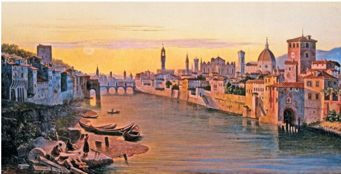
А. М. Перро. Вид реки Арно во Флоренции. 1837 г.

Вернувшись во дворец, Микеланджело сделал деревянное распятие почти натуральной величины для настоятеля Санто-Спирито: монах оказался умным человеком и захотел покровительствовать молодому гению. Он выделил ему в своей обители потайную комнатку и велел доставлять ему трупы, благодаря чему Микеланджело мог предаться своей страсти к анатомии.