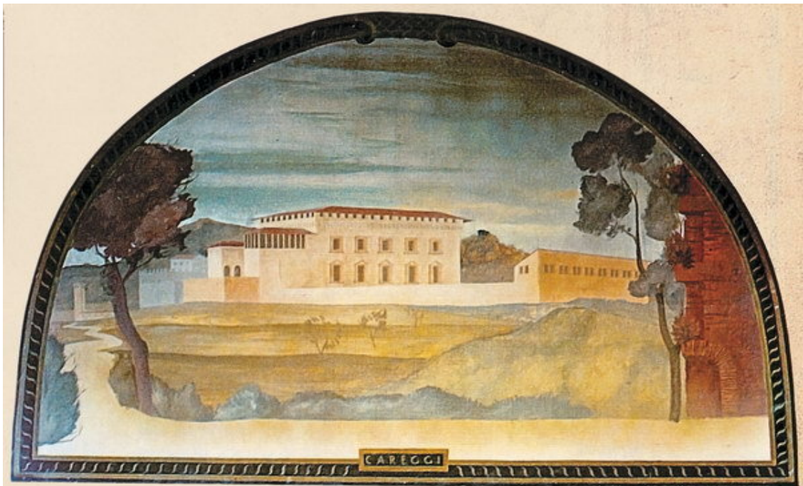
Вилла Кареджи. Из серии «Виды вилл Медичи». 1599–1609 гг.