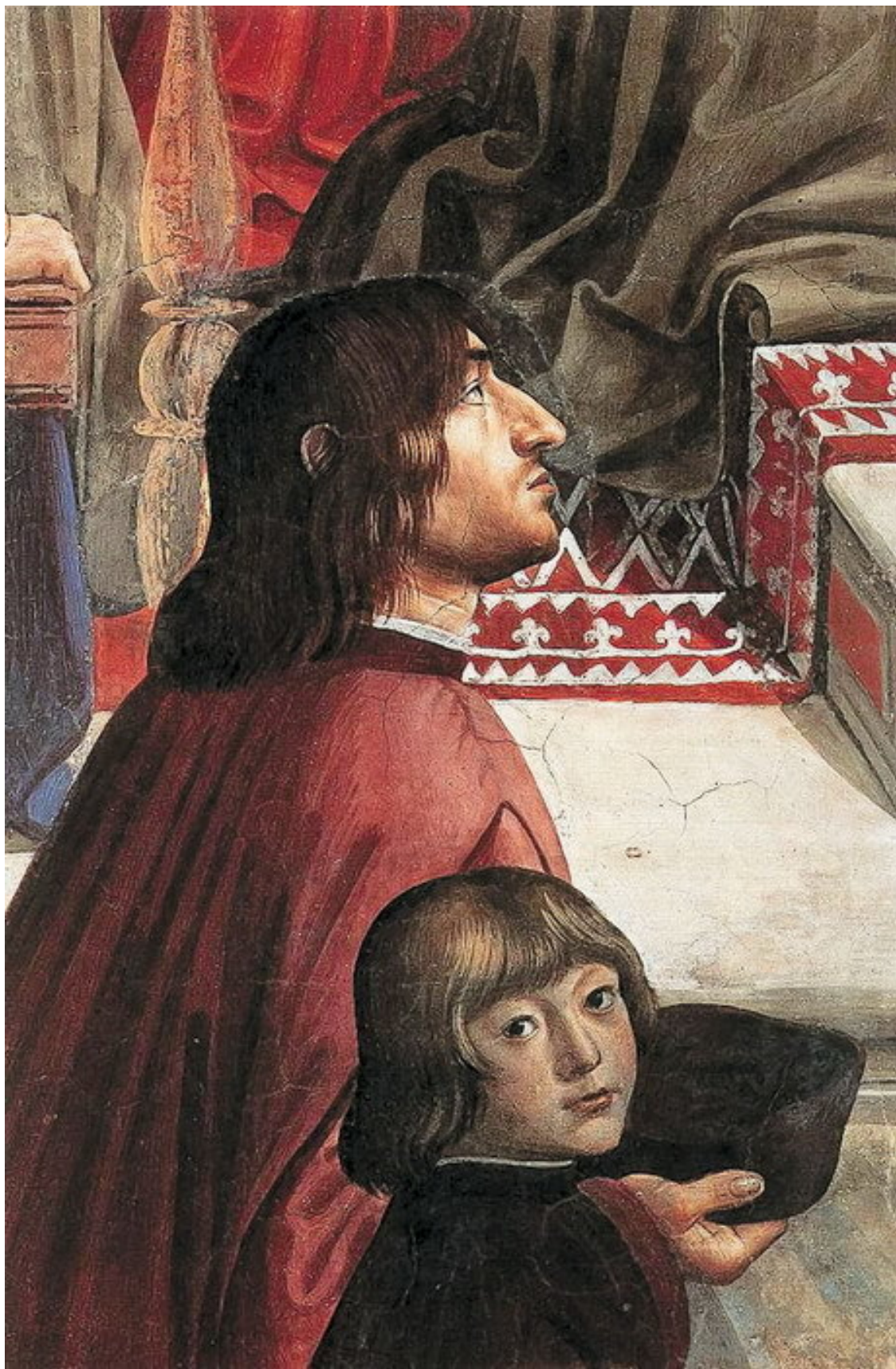
Д. Гирландайо. Утверждение устава францисканского ордена папой Гонорием III. 1482–1485 гг. Фрагмент росписи капеллы Сассетти в церкви Санта-Тринита, Флоренция. Портрет Полициано и его воспитанника Джулиано Медичи.