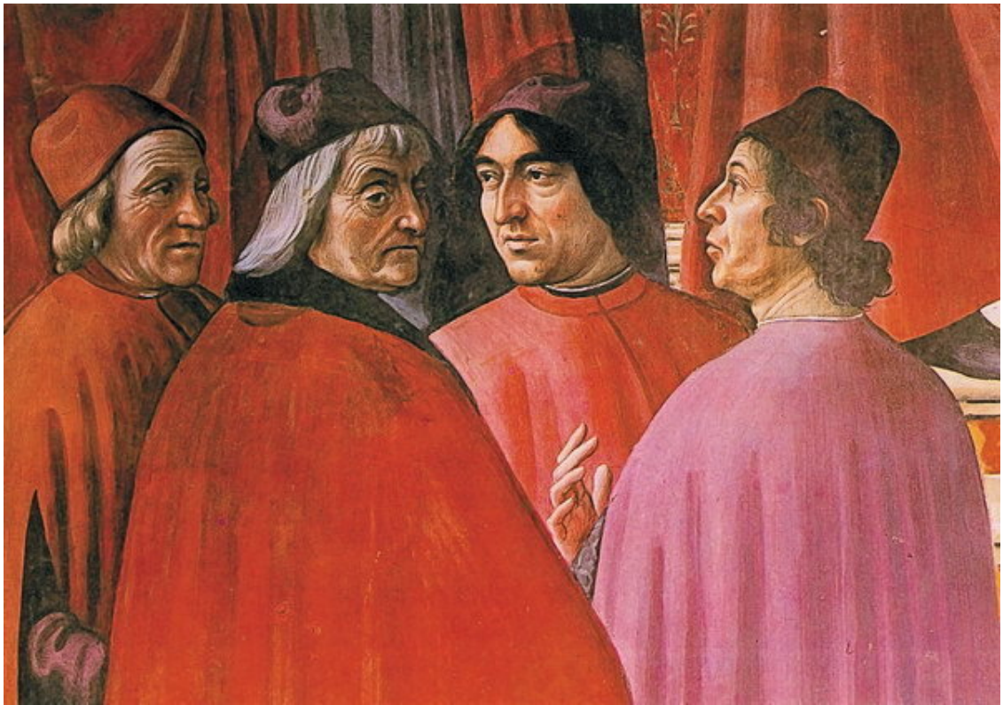
Д. Гирландайо. Благовестие Захарии. 1486–1490 гг. Фрагмент росписи капеллы Торнабуони в церкви Санта-Мария-Новелла, изображающий членов Платоновской академии Марсилио Фичино, Кристофоро Ландино, Анджело Полициано и Джентиле де Бекки.