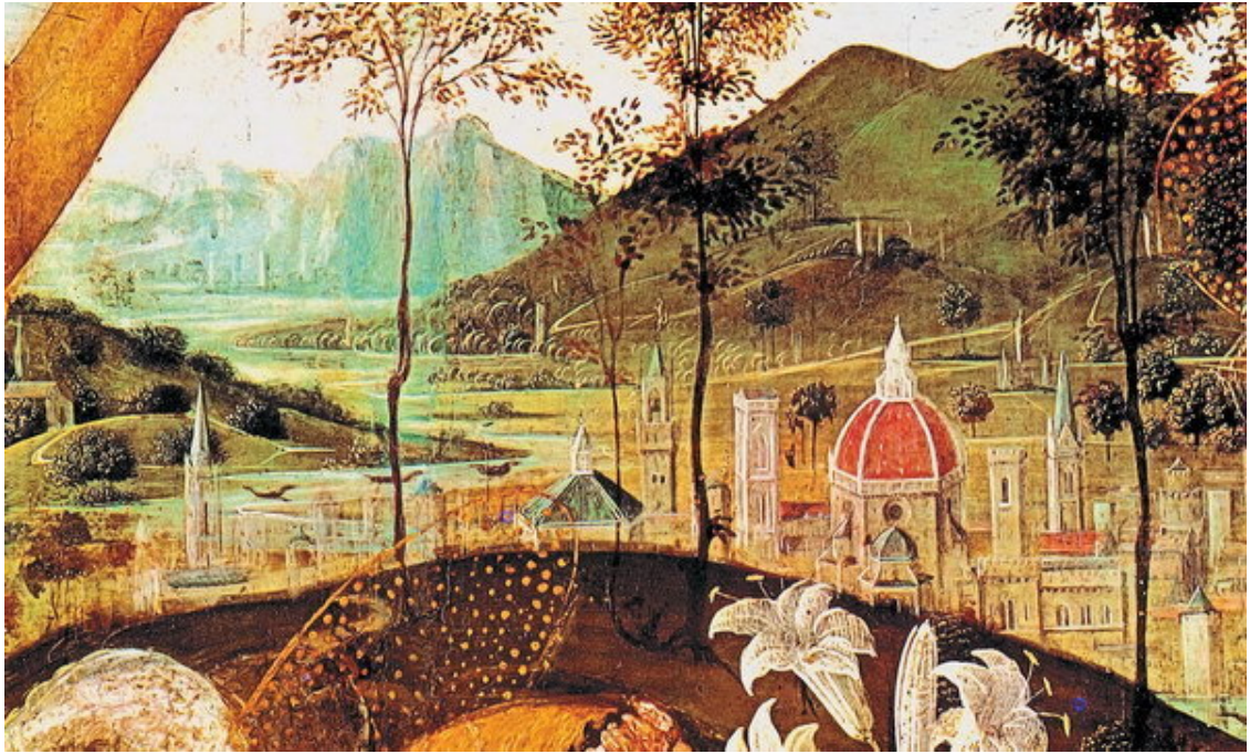
Филиппино Липпи. Панорама Флоренции. Фрагмент картины «Благовещение со св. Иосифом и св. Иоанном Крестителем». Ок. 1485 г. Национальная галерея Каподимонте. Неаполь.