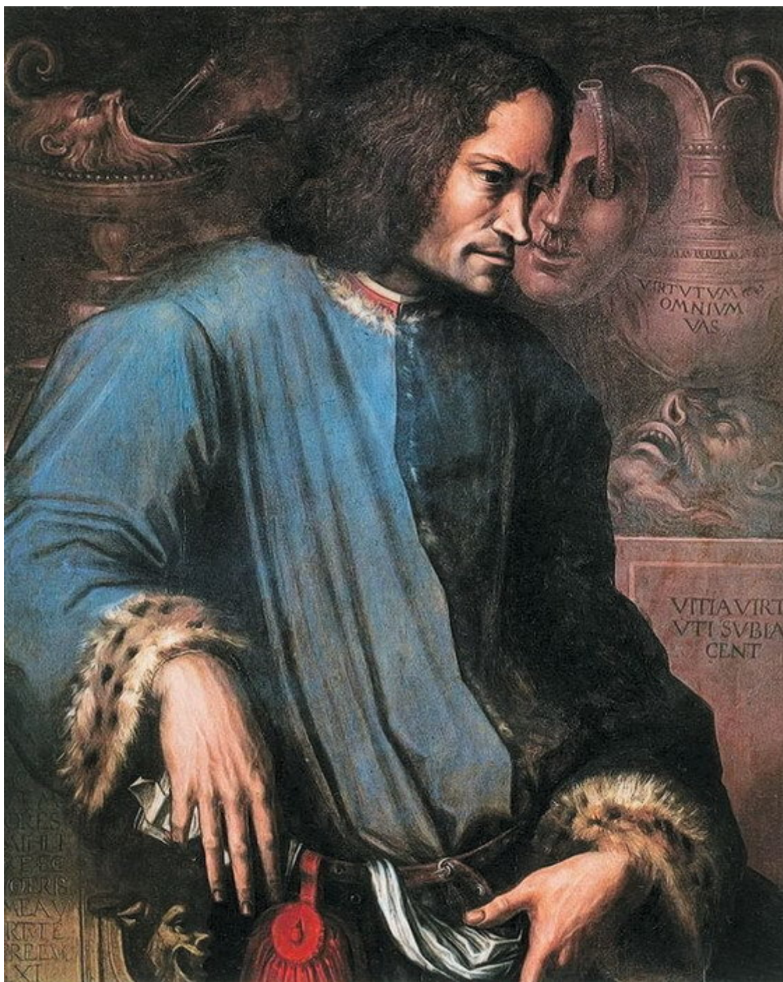
Дж. Вазари. Портрет Лоренцо Медичи. Ок. 1534 г. Галерея Уффици. Флоренция.

Понятно, что при этом великодушном правителе Микеланджело научился всему, за исключением ремесла царедворца. Вероятно, напротив, видя, что его принимают наравне с первыми людьми эпохи, он рано укрепился в этой римской гордости, которая не склонит головы ни перед какой низостью и которую он обессмертил тем, что сумел придать столь поразительную экспрессию «Пророкам» Сикстинской капеллы.