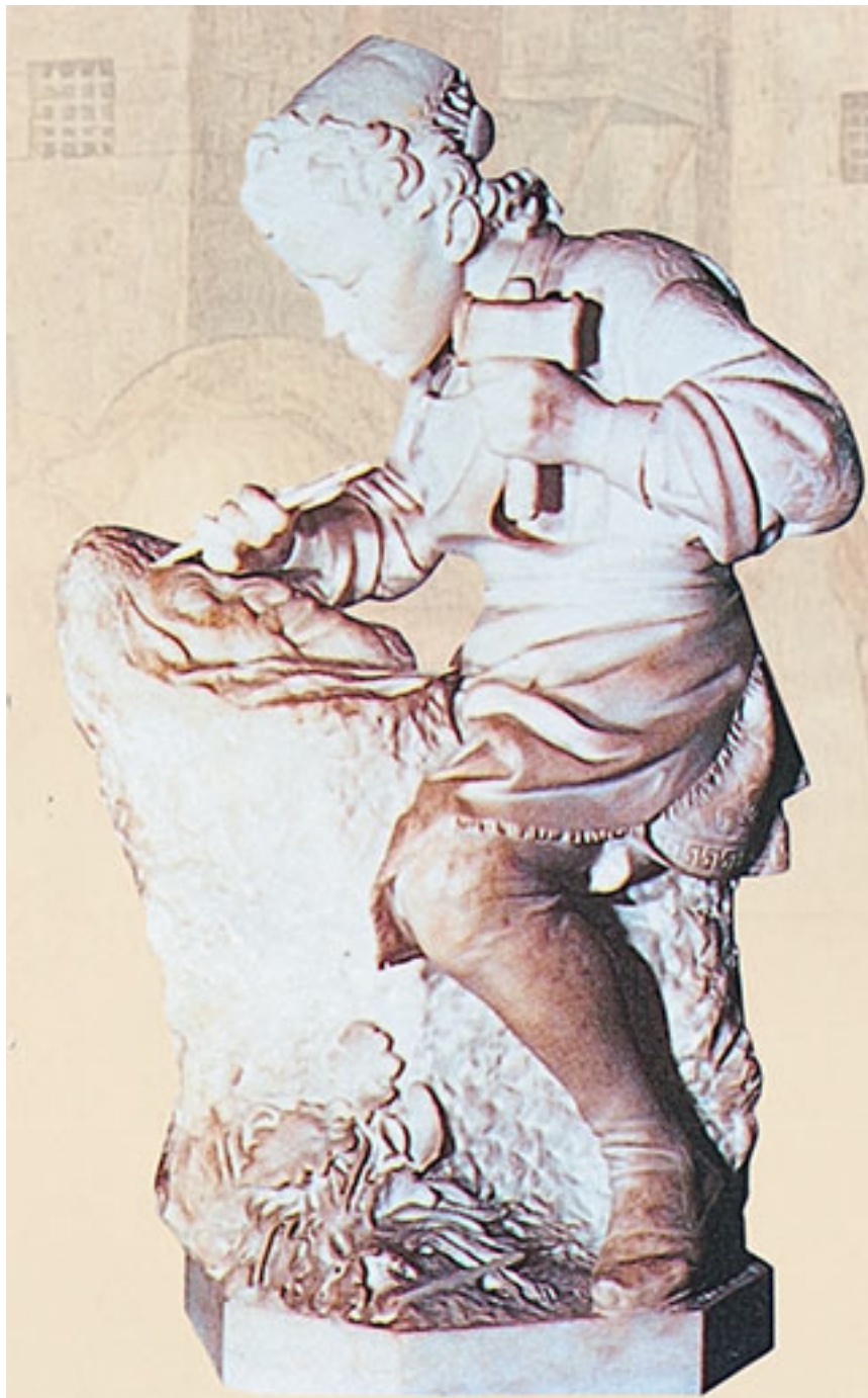
Раффаэлло Романелли. Мальчик Микеланджело высекает голову фавна. 1907 г.

Шестьдесят лет спустя Вазари, будучи в Риме, принес старому Микеланджело один из рисунков, сделанных им в мастерской Гирландайо. На выполненном пером эскизе, законченном по рисунку учителя каким-то из его товарищей, он имел дерзость придать телу новое положение. Это воспоминание юности развеселило великого художника, и он воскликнул, что хорошо помнит эту фигуру и что в детстве он знал больше, чем теперь, в старости.