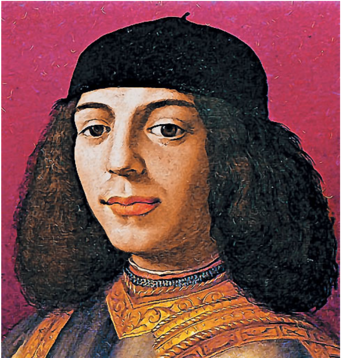
А. Бронзино. Портрет Пьетро Медичи. 1490-е гг.

Микеланджело Буонарроти. Св. Петроний. Ок. 1494–1495 гг. Церковь Св. Доминика. Болонья.