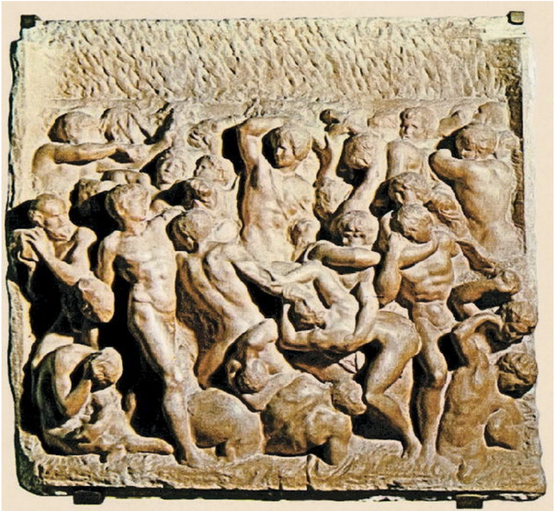
Микеланджело Буонарроти. Битва кентавров. Барельеф. Ок. 1492 г. Дом Буонарроти. Флоренция.