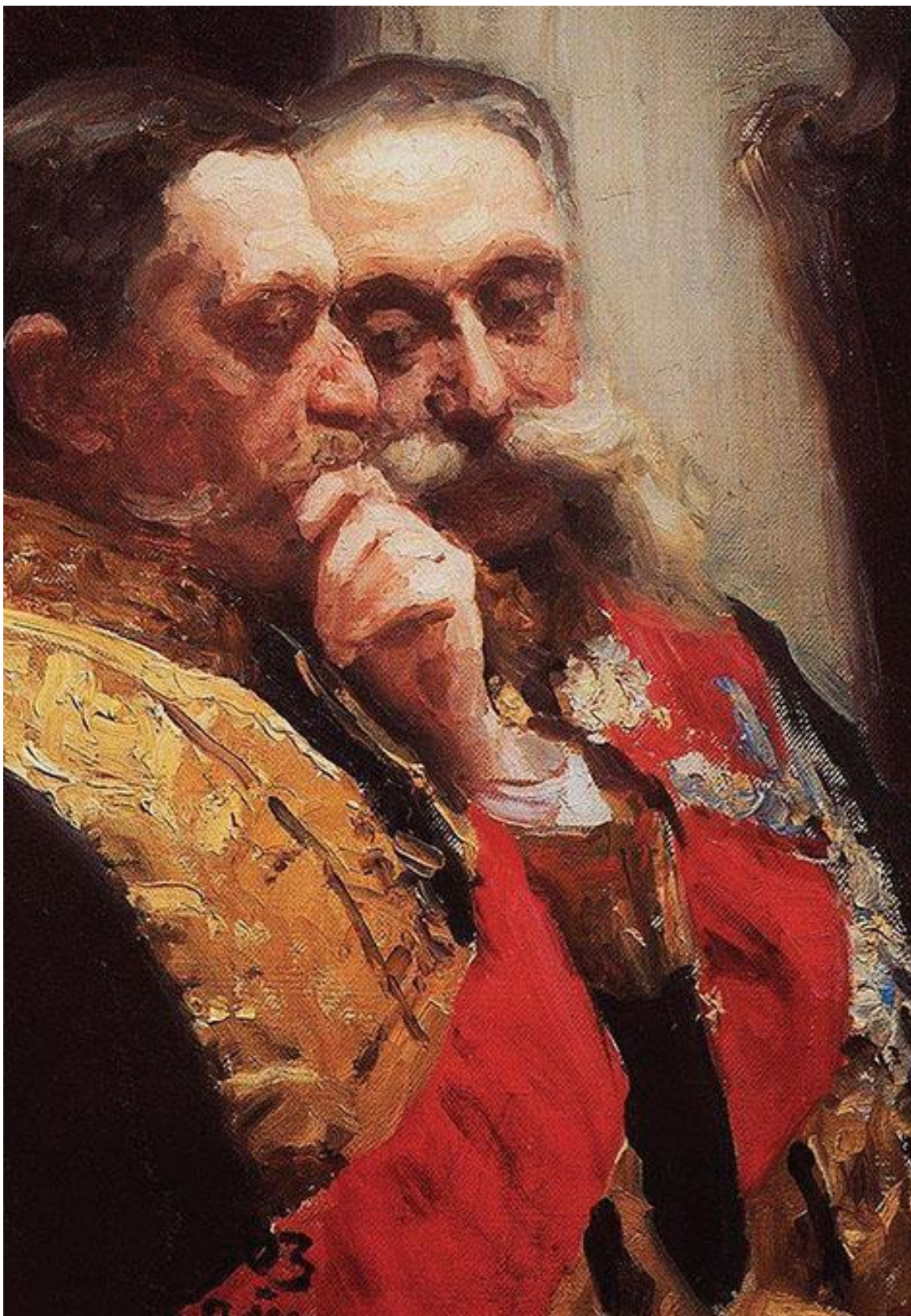
Торжественное заседание Государственного совета 7 мая 1901 года в честь столетнего юбилея со дня его учреждения (фрагмент) Репин И.Е.

Там, где великие мудрецы имеют власть, подданные не замечают их существования. Там, где властвуют невеликие мудрецы, народ бывает привязан к ним и хвалит их. Там, где властвуют еще меньшие мудрецы, народ боится их, а там, где еще меньшие, народ их презирает.