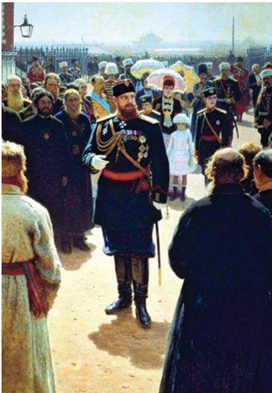
Прием волостных старшин императором Александром III во дворе Петровского дворца в Москве (фрагмент). Репин И. Е.