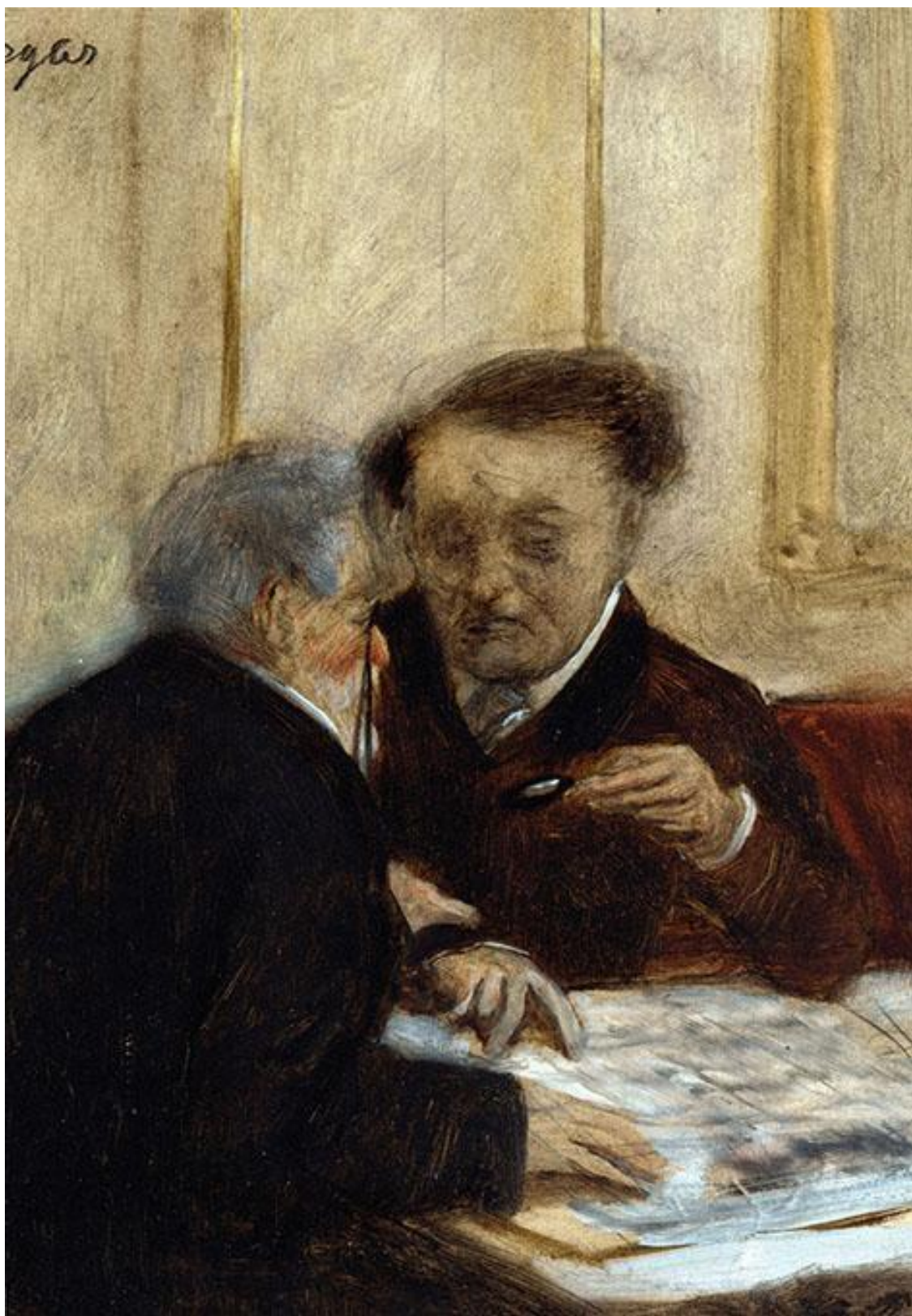
В кафе Шатодан. Дега Э.

...Демократическое государство анархично. Совершенно не управляет страной «народ» (демос); почти не управляет парламент, немного управляет кабинет министров, а более всего – бюрократия, единственный постоянный элемент власти.