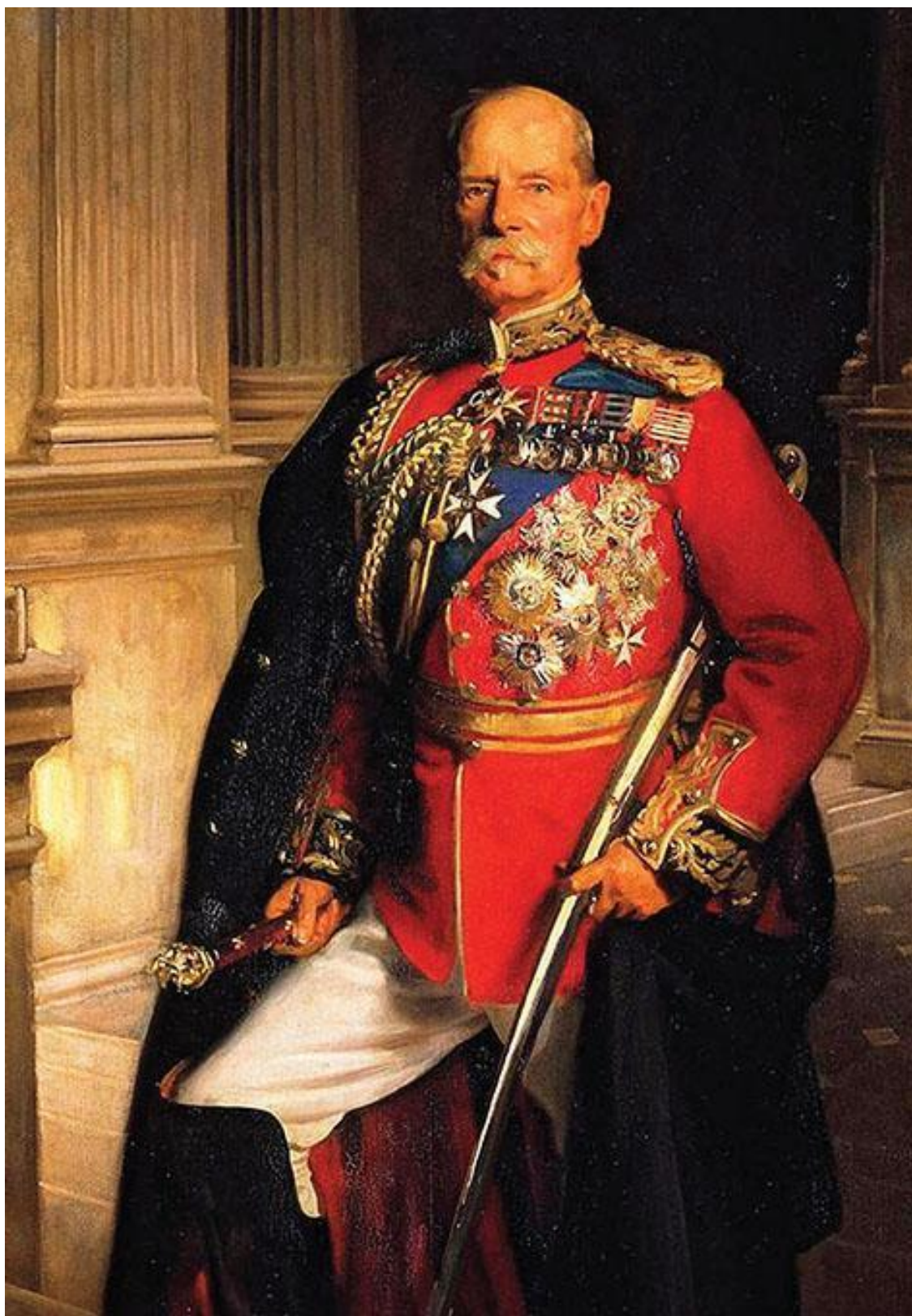
Фельдмаршал Эрл Робертс. Сарджент Дж.-С.