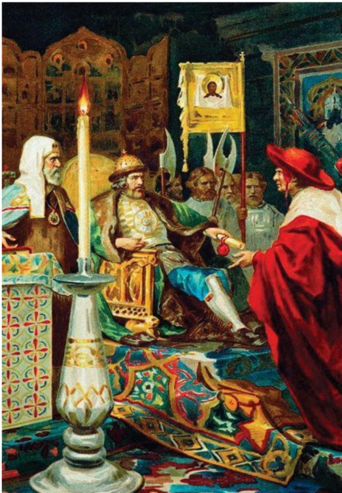
Александр Невский принимает папских легатов. Семирадский Г.