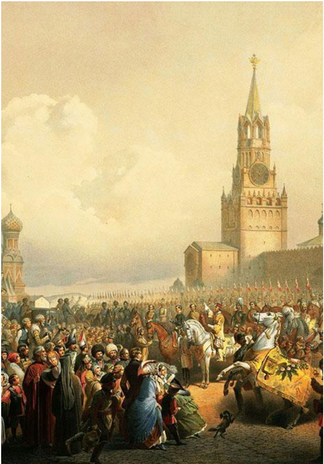
Объявление на Красной площади о дне коронации Александра II и Марии Александровны (фрагмент). Тимм В. Ф.

Почему люди следуют за большинством? Потому ли, что оно право? Нет, потому, что сильно.