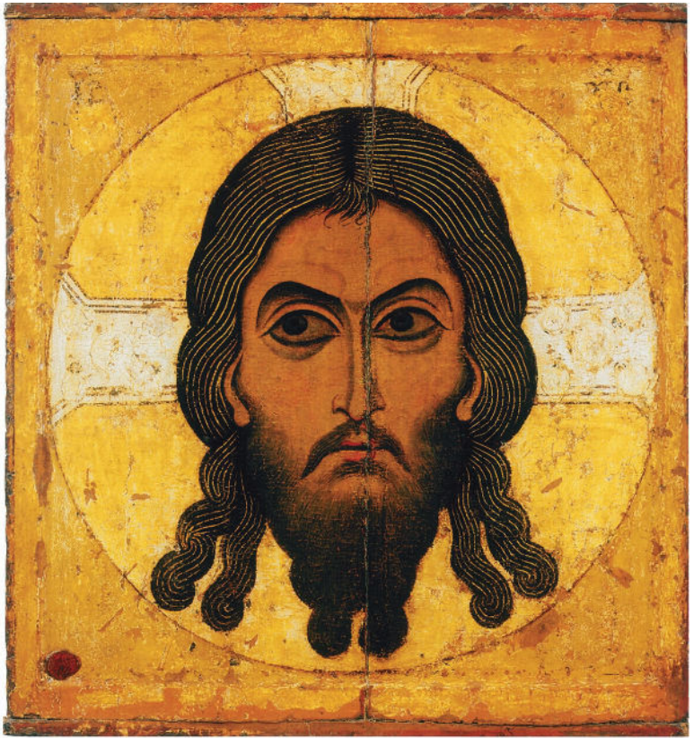
Спас Нерукотворный. Вторая половина XII в. Новгород. Государственная Третьяковская галерея, Москва