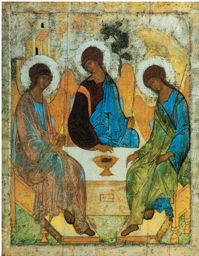
Троица. Ок. 1425–1427. Государственная Третьяков-