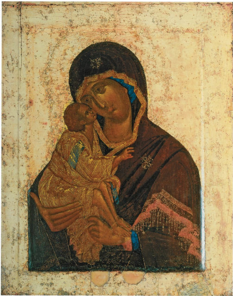
Богородица Донская. 1380–1390-е. Государственная Третьяковская галерея, Москва