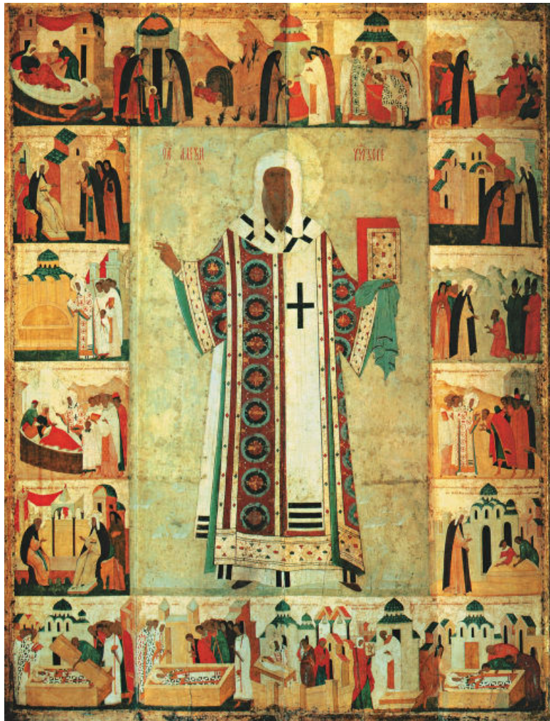
Митрополит Алексий с житием. Конец XV в. Государ-