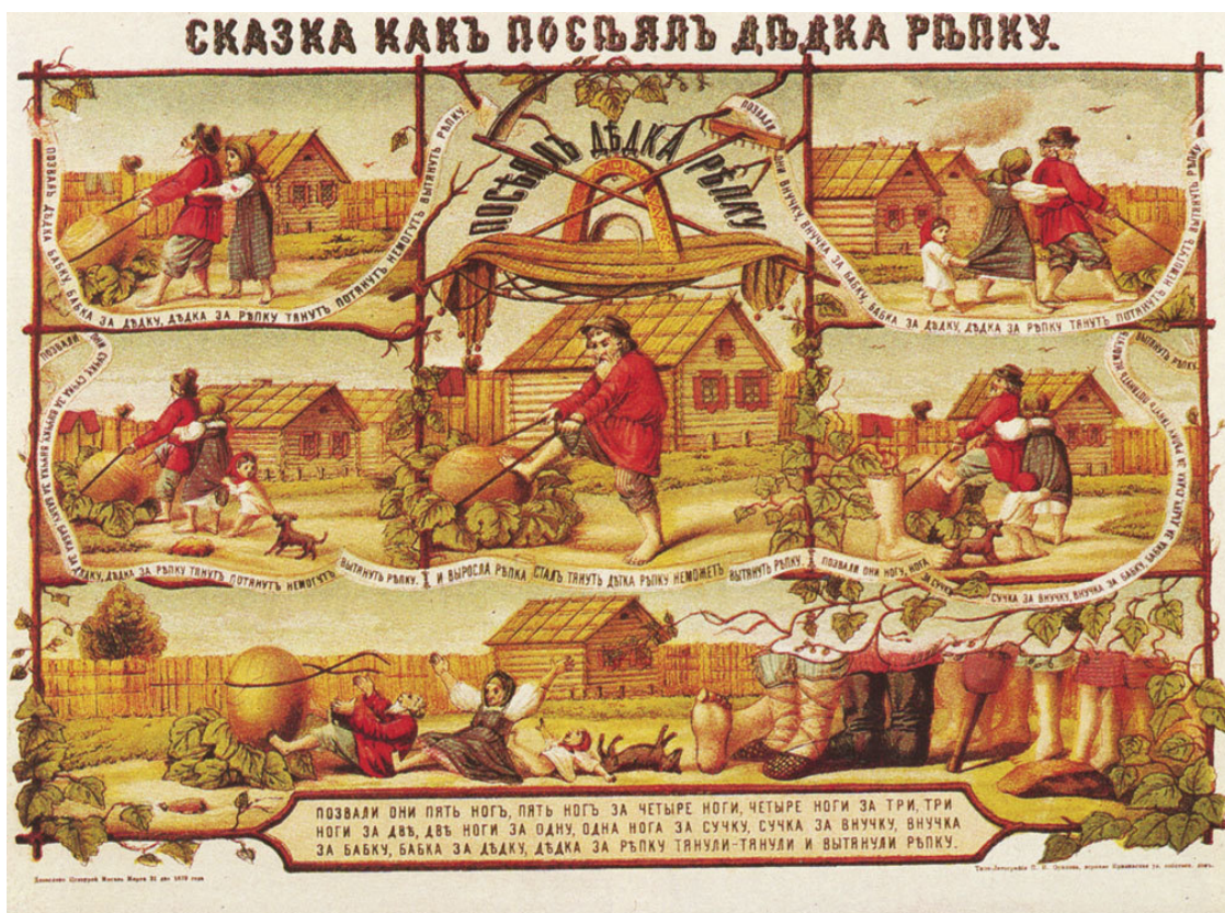
Сказка как посеял дедка репку. Хромолитогр. XIX в.

Пришла нога. Нога за сучку, сучка за внучку, внучка за бабку, бабка за дедку, дедка за репку, тянут-потянут, вытянуть не могут!