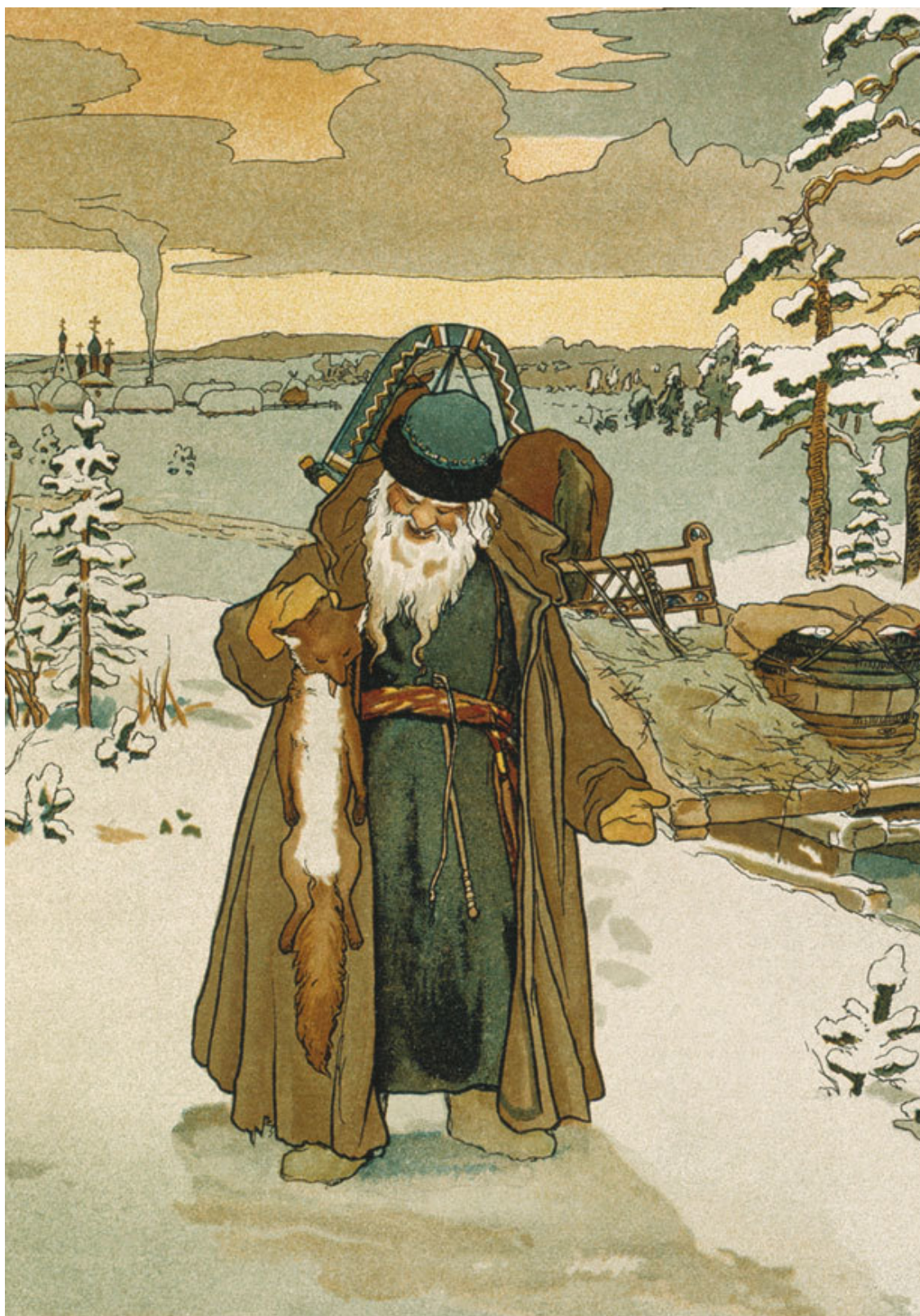
Э. Лиснер. Иллюстрация к сказке «Лисичка-сестричка и волк»