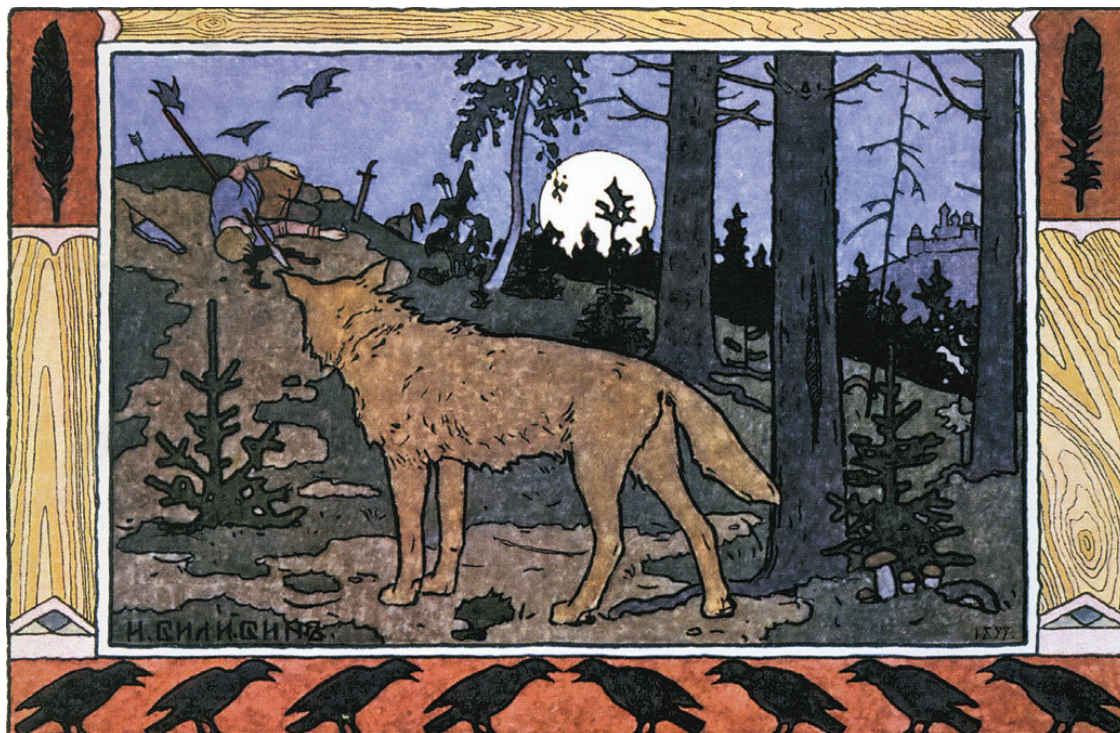
И. Билибин. Иллюстрация к «Сказке об Иване-царевиче, жар-птице и о Сером Волке»

Иван-царевич прочел эту надпись и поехал в правую сторону, держа на уме: хотя конь его и убит будет, зато сам жив останется и со временем может достать себе другого коня.