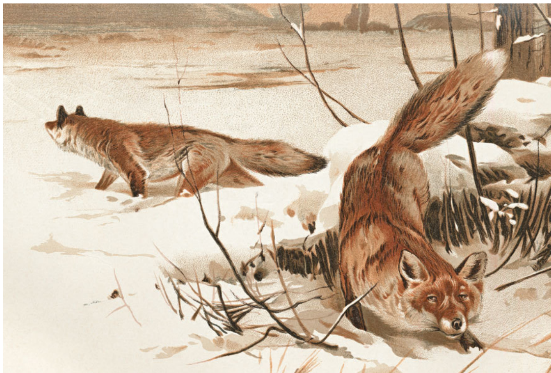
Лисица. Рисунок XIX в.

– Теперь я задам тебе жару! Ты у меня за все ответишь; попомнишь, блудник и пакостник, про свои худые дела! Вспомни, как я в осеннюю темную ночь приходила и хотела попользоваться одним куренком, а я в то время три дня ничего не ела, и ты крыльями захлопал и ногами затопал!..