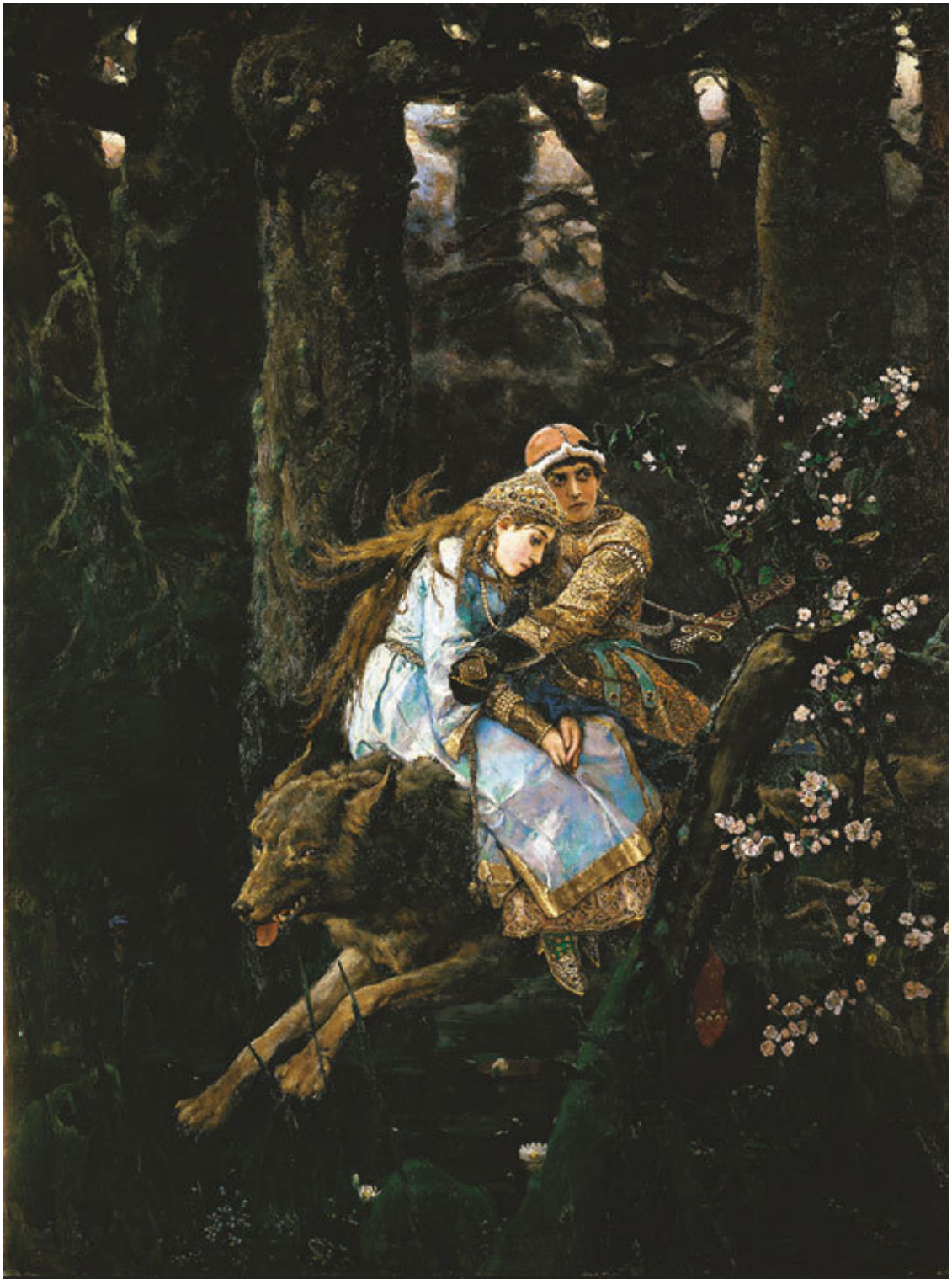
В. Васнецов. Иван-царевич на Сером, Волке

дала воды; снесла воду к петушку: он лежит, ни спышит, ни сдышит, подавился на поповом гумне бобовым зернятком!