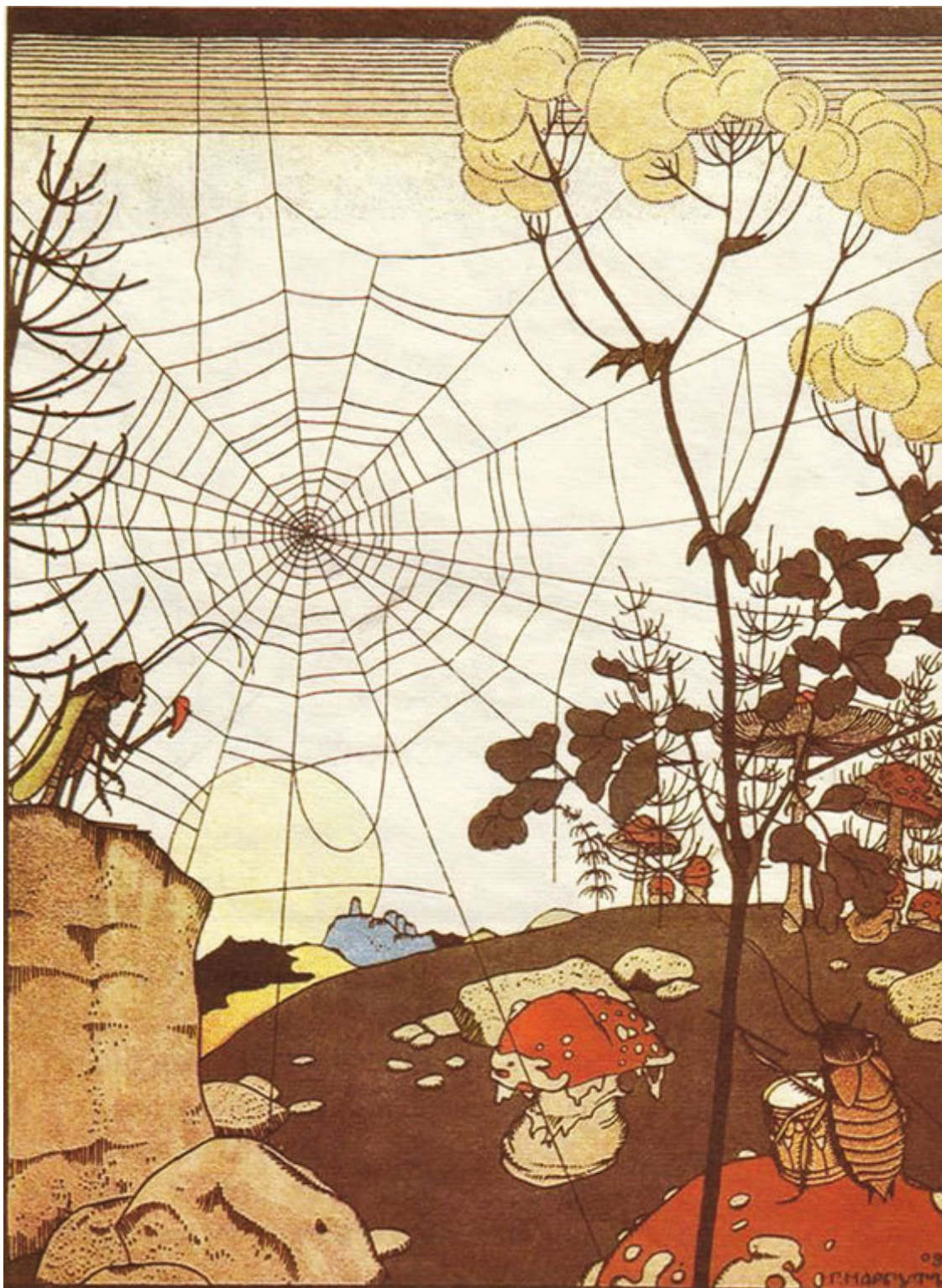
Г. Нарбут. Иллюстрация к сказке «Мизгирь»