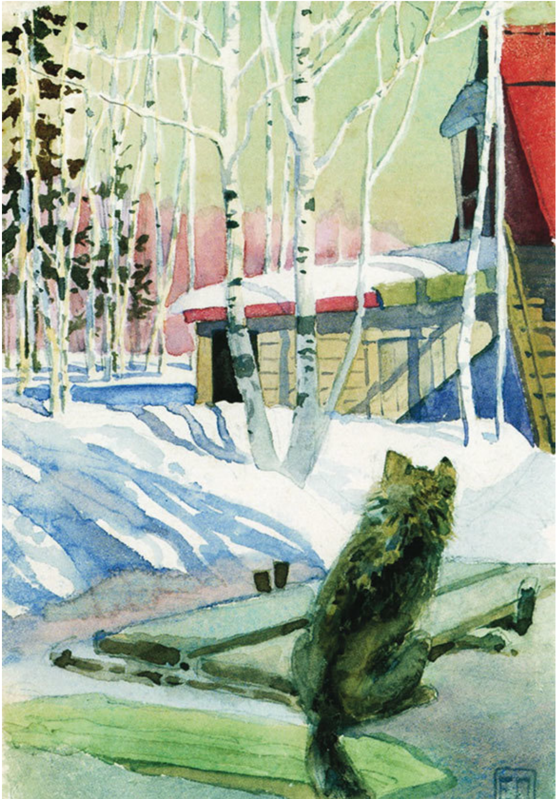
Е. Поленова. Иллюстрация к русской сказке