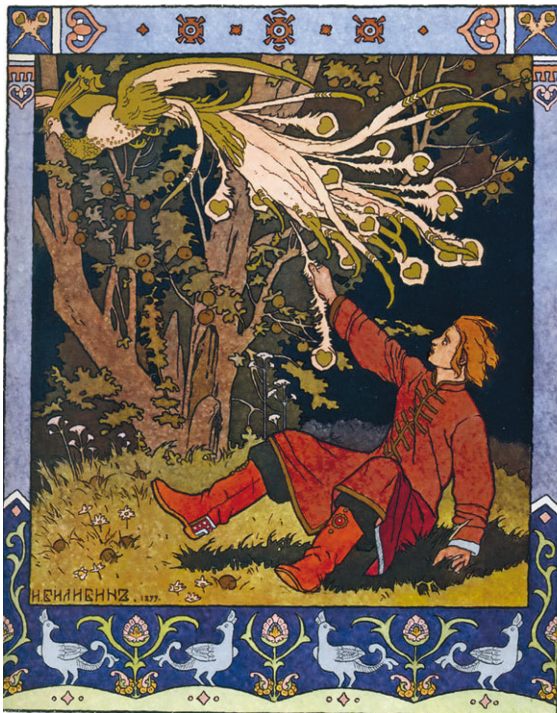
И. Билибин. Иллюстрация к «Сказке об Иване-царевиче, жар-птице и о Сером. Волке»