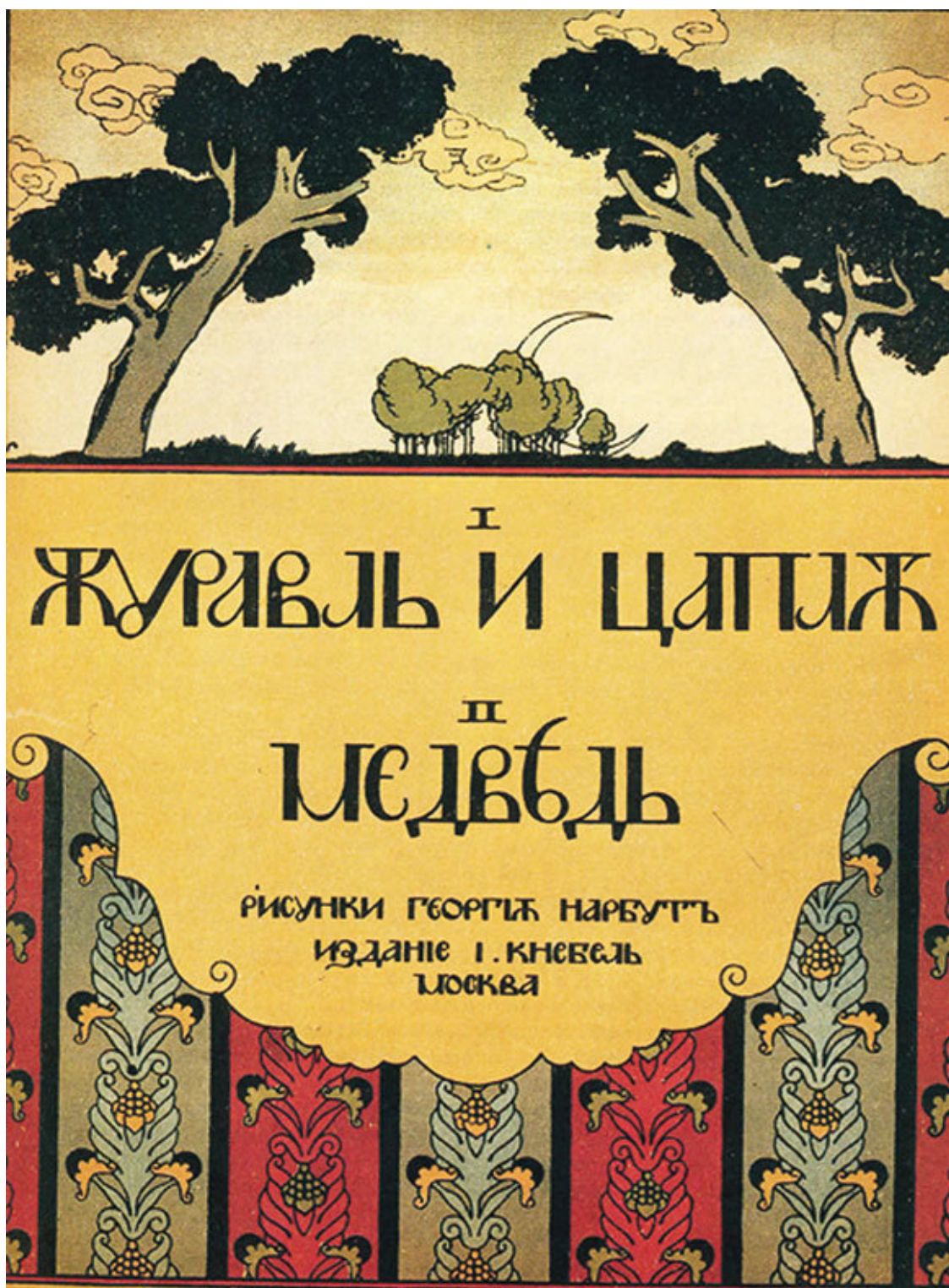
Г. Нарбут. Обложка книги сказок