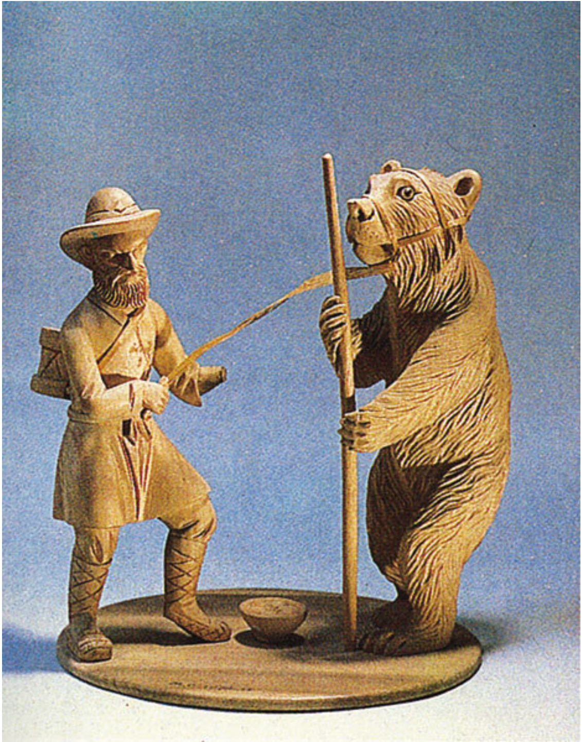
Я. Г. Чушкин. Поводырь и медведь. Конец 19 в.

– Ох, мужичок, положи меня в сани, закидай дровами да увяжи веревкой; авось подумают, что колода лежит.