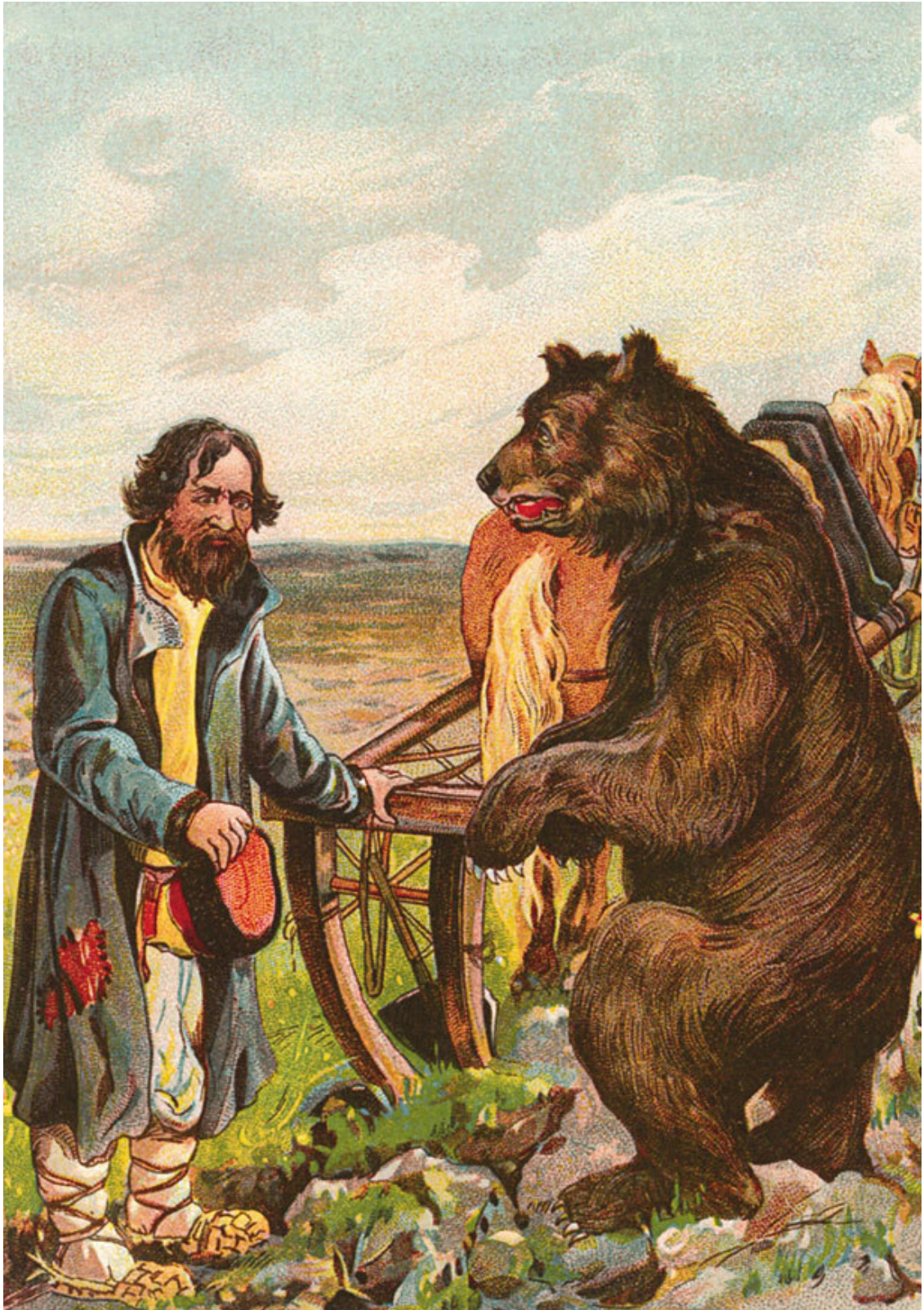
Иллюстрация к сказке «Мужик и медведь». Рисунок XIX в.

– Быть так, – сказал медведь, – а коли обманешь – так в лес по дрова ко мне хоть не езд! Сказал и ушел в дуброву. Пришло время: мужик репу копает, а медведь из дубровы выле-зает.