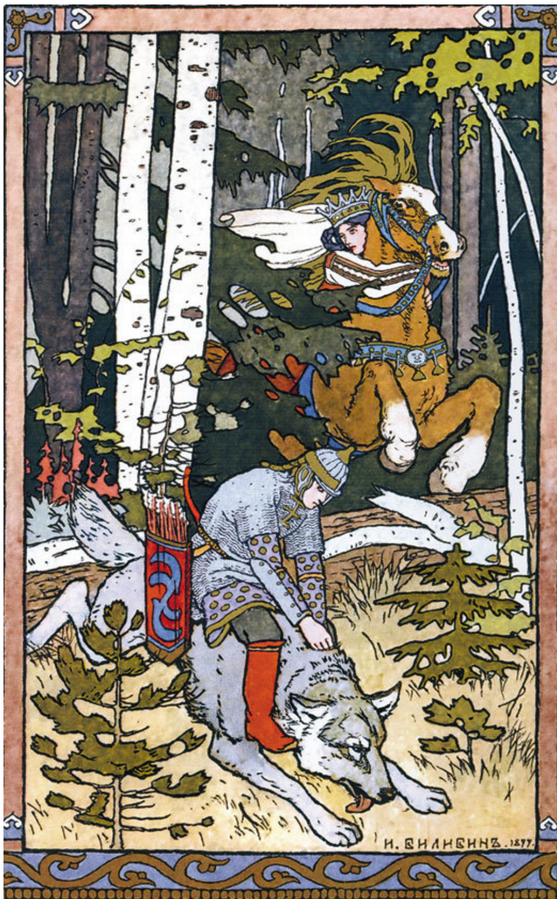
И. Билибин. Иллюстрация к «Сказке об Иване-царевиче, жар-птице и о Сером Волке»