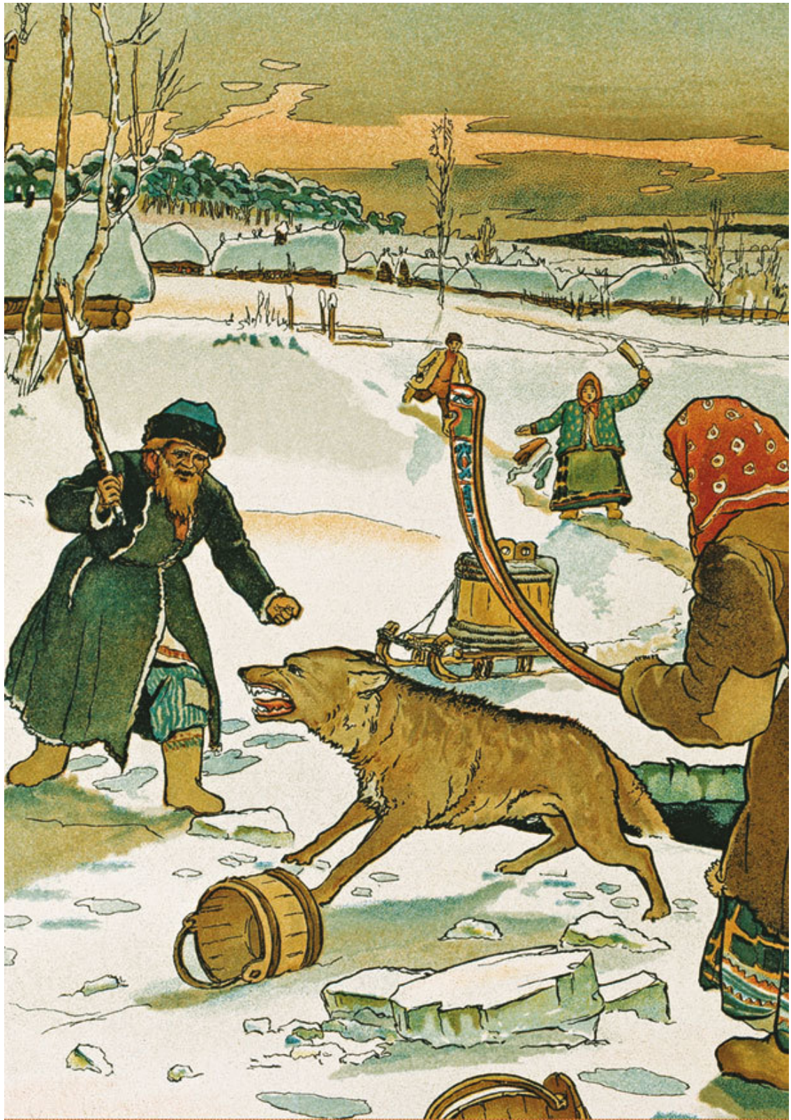
Э. Лиснер. Иллюстрация к сказке «Лисичка-сестричка и волк»

А лисичка улучила время и стала выбрасывать полегоньку из воза все по рыбе да по рыбе, все по рыбе да по рыбе. Повыбросала всю рыбу, и сама ушла.