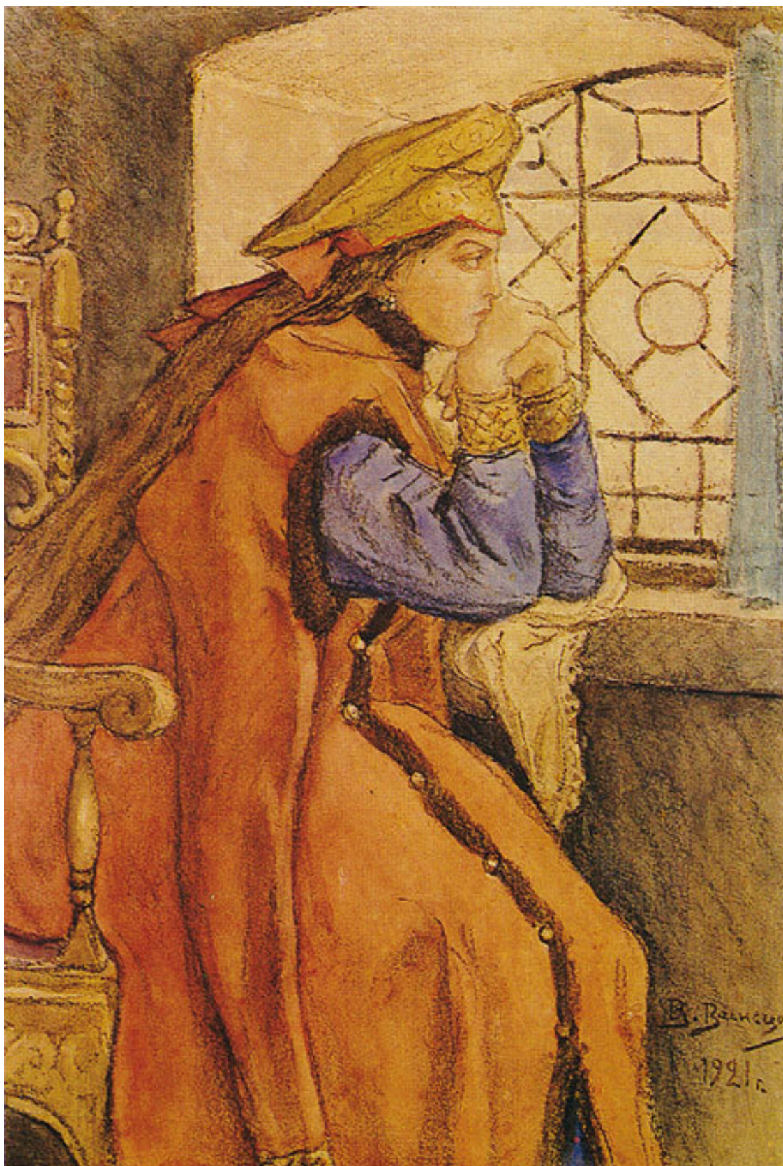
В. Васнецов. Царевна у окна