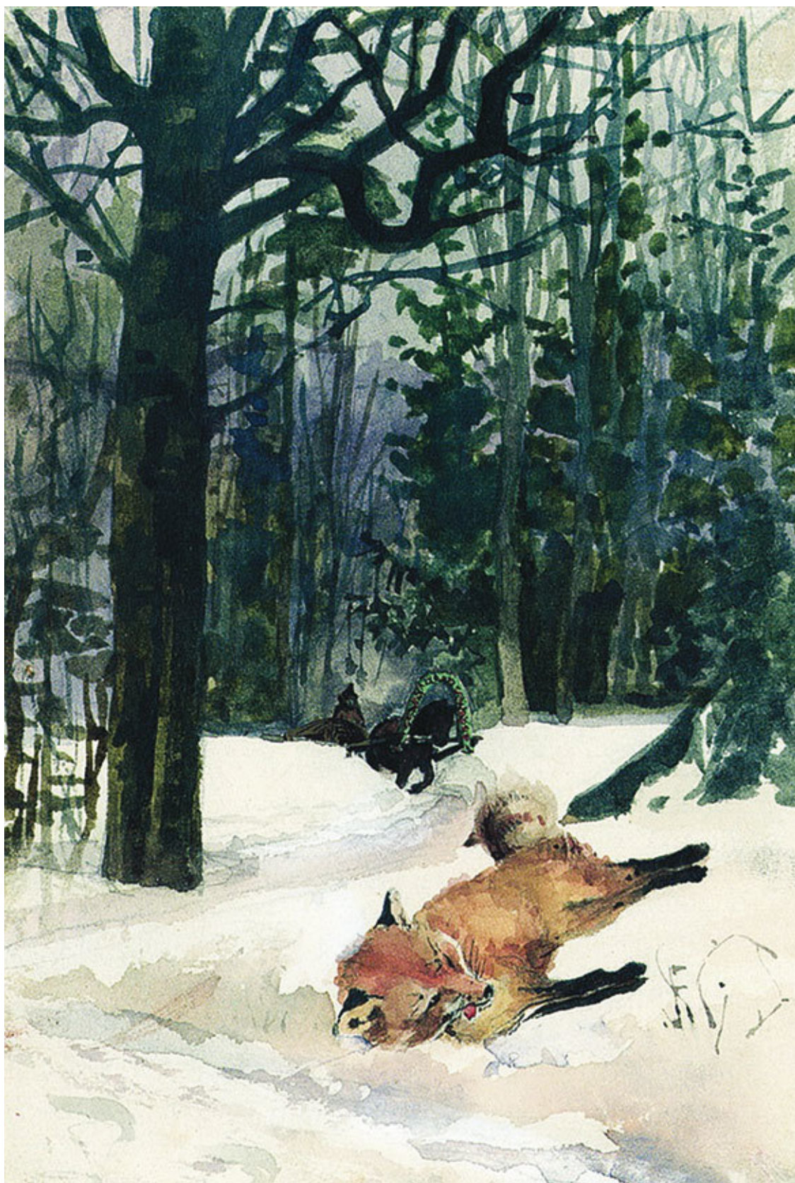
Е. Поленова. Иллюстрация к сказке «Лисичка-сестричка и волк»