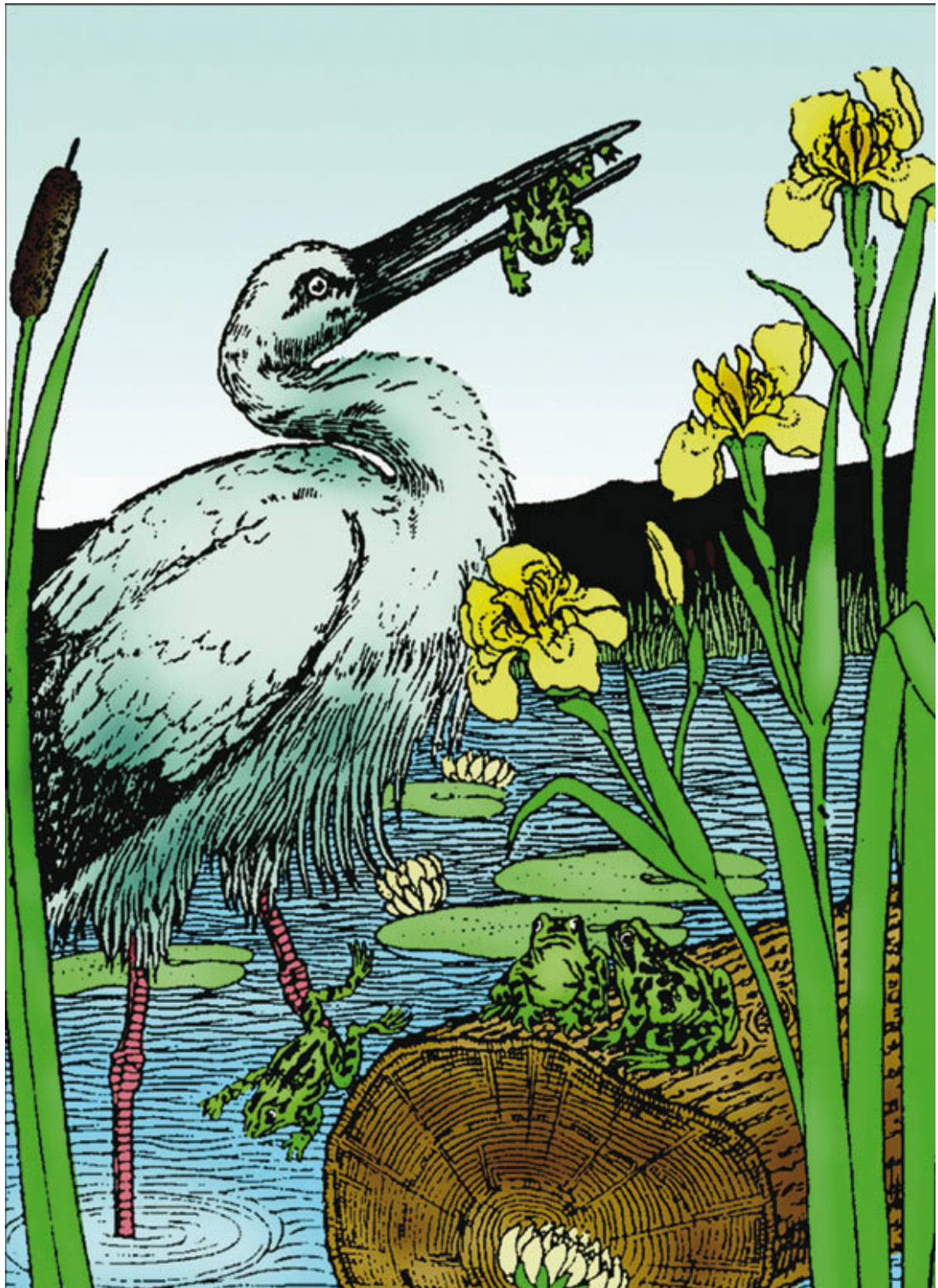
Цапля. Фрагмент иллюстрации Н. Ольшанского и П. Беллингерста