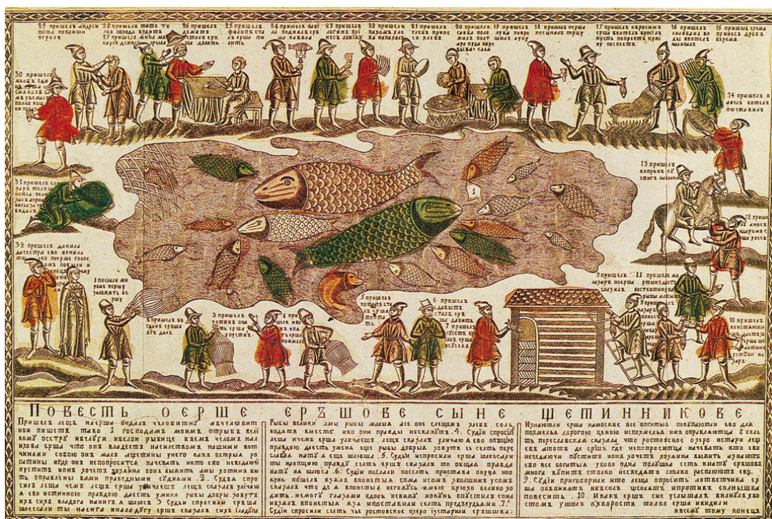
«Повесть о Ерше Ершовиче». Раскрашенная гравюра на меди. XIX в.

– Есть у меня в том свидетели и московские крепости, письменные грамоты: сорога-рыба 17 на пожаре была, глаза запалила, и понынче у нее красны.