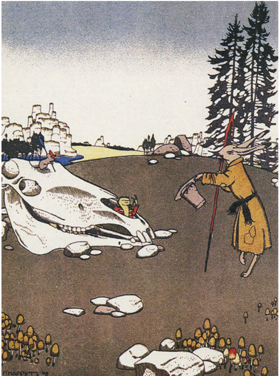
Г. Нарбут. Иллюстрация к сказке «Мизгирь»

Сверчок сел на кочок испивать табачок, а таракан ударил в барабан; клоп-блинник пошел под осиново корище, говорит: