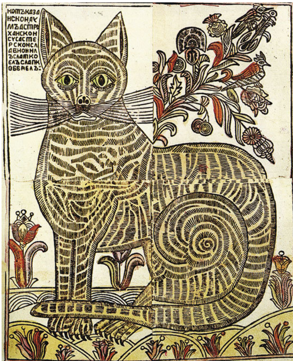
Кот казанский. Ксилография XVIII в.

Захотелось волку посмотреть на Котофея Ивановича, да сквозь листья не видать! И начал он прокапывать над глазами листья, а кот услышал, что лист шевелится, подумал, что это – мышь, да как кинется и прямо волку в морду вцепился когтями.