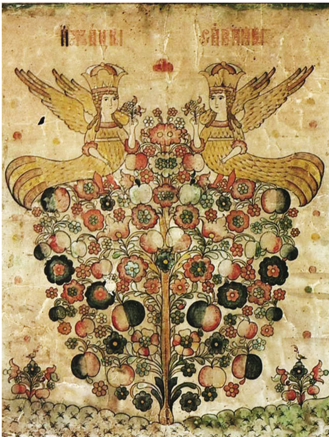
Птицы Сирины. Лубочная иллюстрация