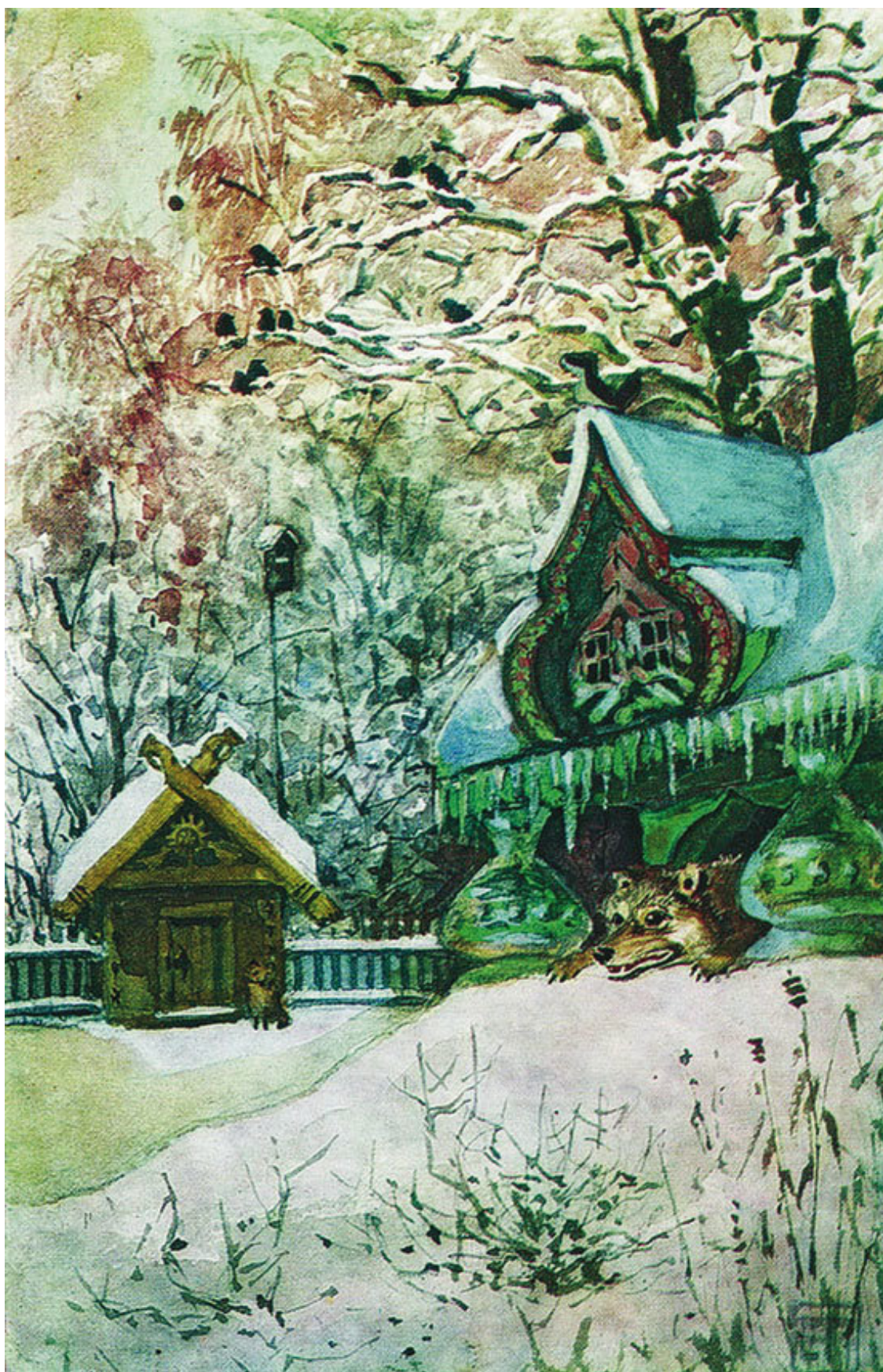
Е. Поленова. Иллюстрация к русской сказке