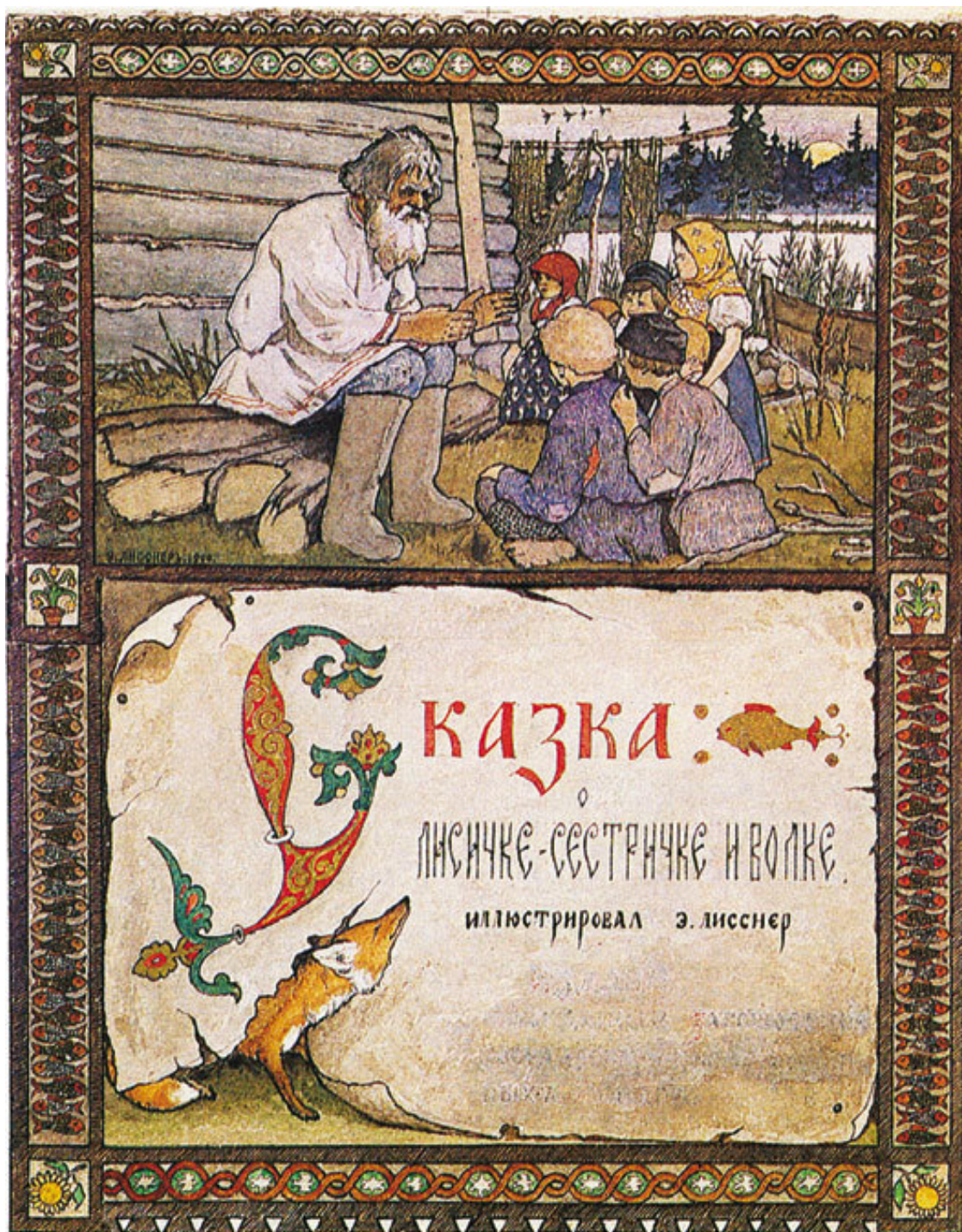
Э. Лисснер. Обложка книги, сказок

А лисичка-сестричка, покушавши рыбки, захотела попробовать, не удастся ли еще что-нибудь стянуть; забралась в одну избу, где бабы пекли блины, да попала головой в кадку с тестом, вымазалась и бежит. А волк ей на встречу: