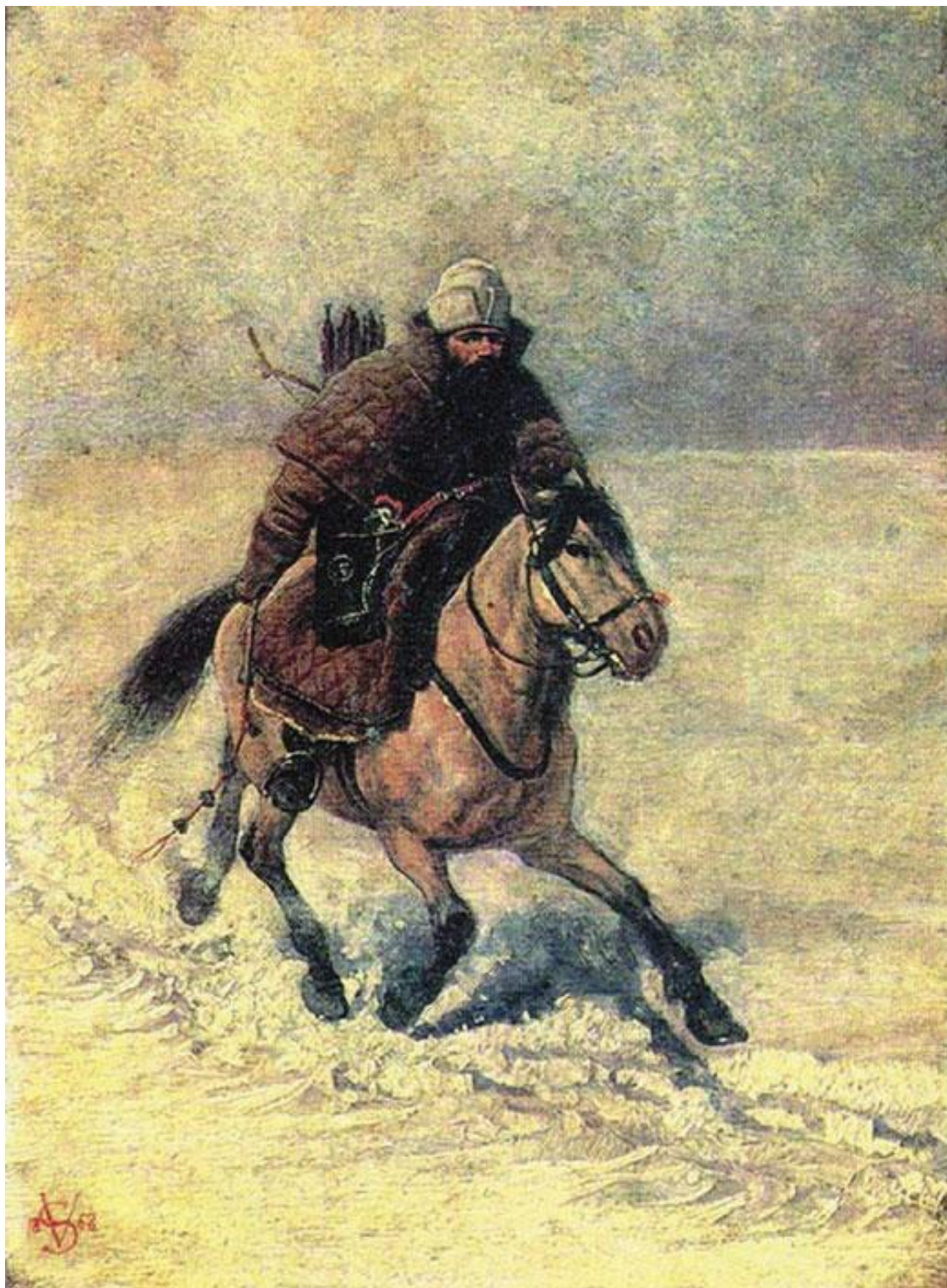
В. Шварц. Гонец. 1868 г.