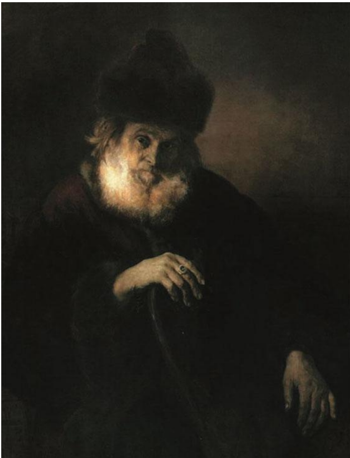
П. Чистяков. Боярин. 1876 г.

В то самое время, как Бельский и митрополит обнаруживали свое влияние, возвращая удел опальному князю, против них составлялся страшный заговор: бояре, говорит летописец, вознегодовали на князя Бельского и на митрополита за то, что великий князь держал их у себя в приближении. Эти бояре были: князья Михайла и Иван Кубенские, князь Димитрий Палецкий, казначей Иван Третьяков, с ними княжата, дворяне и дети боярские многие и новгородцы Великого Новгорода – всем городом. Шуйский находился в это время во Владимире, оберегая восточные области от набега казанцев. Имя Шуйского может объяснить нам, почему в заговоре участвовали новгородцы всем городом: один из Шуйских был последним воеводою