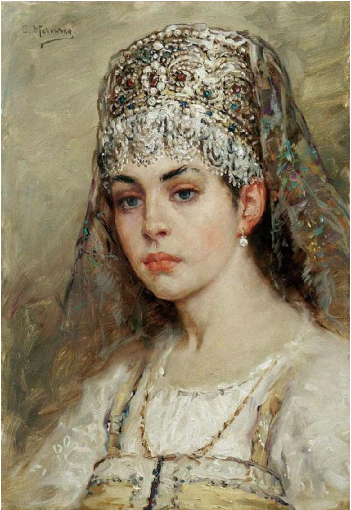
К. Маковский. Боярышня. 1880-е гг.

Опасения умирающего сбылись: тотчас после похорон Василия вдове его донесли уже о крамоле. Летописцы оставили нам об этом деле разные свидетельства: по одним, Андрей Шуйский начал подговаривать князя Бориса Горбатого к отъезду, объявил, что князь Юрий зовет его, Андрея, к себе, и он хочет к нему ехать. Горбатый не только сам не согласился отъехать, но