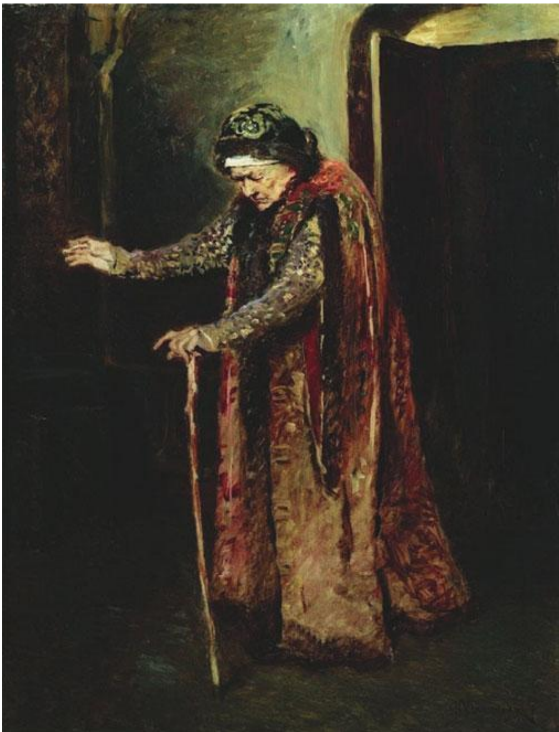
К. Маковский. Нянька Ивана Грозного. 1876 г.

Иоанну исполнилось уже тогда 13 лет. Ребенок родился с блестящими дарованиями; быть может, он родился также с восприимчивою, легко увлекающеюся, страстною природою, но, без сомнения, эта восприимчивость, страстность, раздражительность если не были произведены, то, по крайней мере, были развиты до высшей степени воспитанием, обстоятельствами детства его. Известно, что ребенок даровитый, предоставленный с раннего детства самому себе и поставленный при этом в затруднительное, неприятное положение, развивается быстро, преждевременно во всех отношениях. По смерти матери Иоанн был окружен людьми, которые заботились только о собственных выгодах, которые употребляли его только орудием для своих