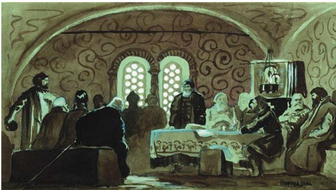
А. Рябушкин. Боярская дума. 1893 г.

Грамоты давались от имени великого князя Иоанна; при описании посольских сношений говорится, что великий князь рассуждал с боярами и решал дела; но это все выражения форменные. После этих выражений встречаем известия, что все правление было положено на великой княгине Елене; видим также, кто был главным ее советником: желая мира, литовский гетман Радзивилл отправлял послов к боярину конюшему, князю Овчине-Телепневу-Оболенскому; гонец казанский, желая отправить татарина домой, бил челом тому же боярину конюшему. После опалы Глинского, Бельского и Воронцова у Оболенского не было явных врагов и соперников; но могли ли равнодушно сносить первенствующее положение Оболенского люди, считавшие за собой более прав на такое положение? Пока жива была Елена, перемены нельзя было ожидать. 3 апреля 1538 года Елена умерла. Герберштейн говорит утвердительно, что ее отравили.