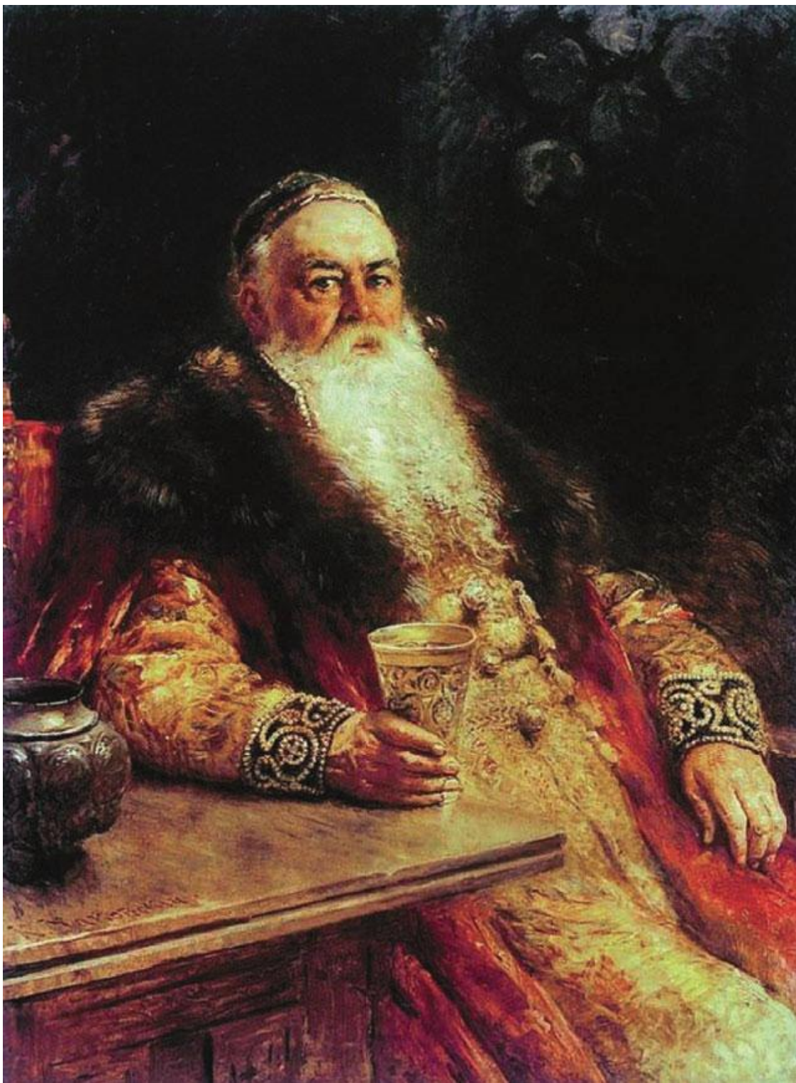
К. Маковский. Боярин с кубком. Этюд к картине «Поцелуйный обряд». 1895 г.

По возвращении из Москвы в Старицу Андрей подозрения и страха не отложил и продолжал сердиться на Елену, зачем не прибавила городов к его уделу. В Москву опять начали доносить, что Андрей собирается бежать. Елена, по свидетельству летописи, не поверила этим доносам и послала звать Андрея на совет по случаю войны казанской; Андрей отвечал, что не может приехать по причине болезни, и просил прислать лекаря. Правительница послала к нему известного нам Феофила, который, возвратившись, донес ей, что у Андрея болезнь легкая, говорит, что на стегне болячка, а лежит на постели. Тогда Елена послала опять к Андрею