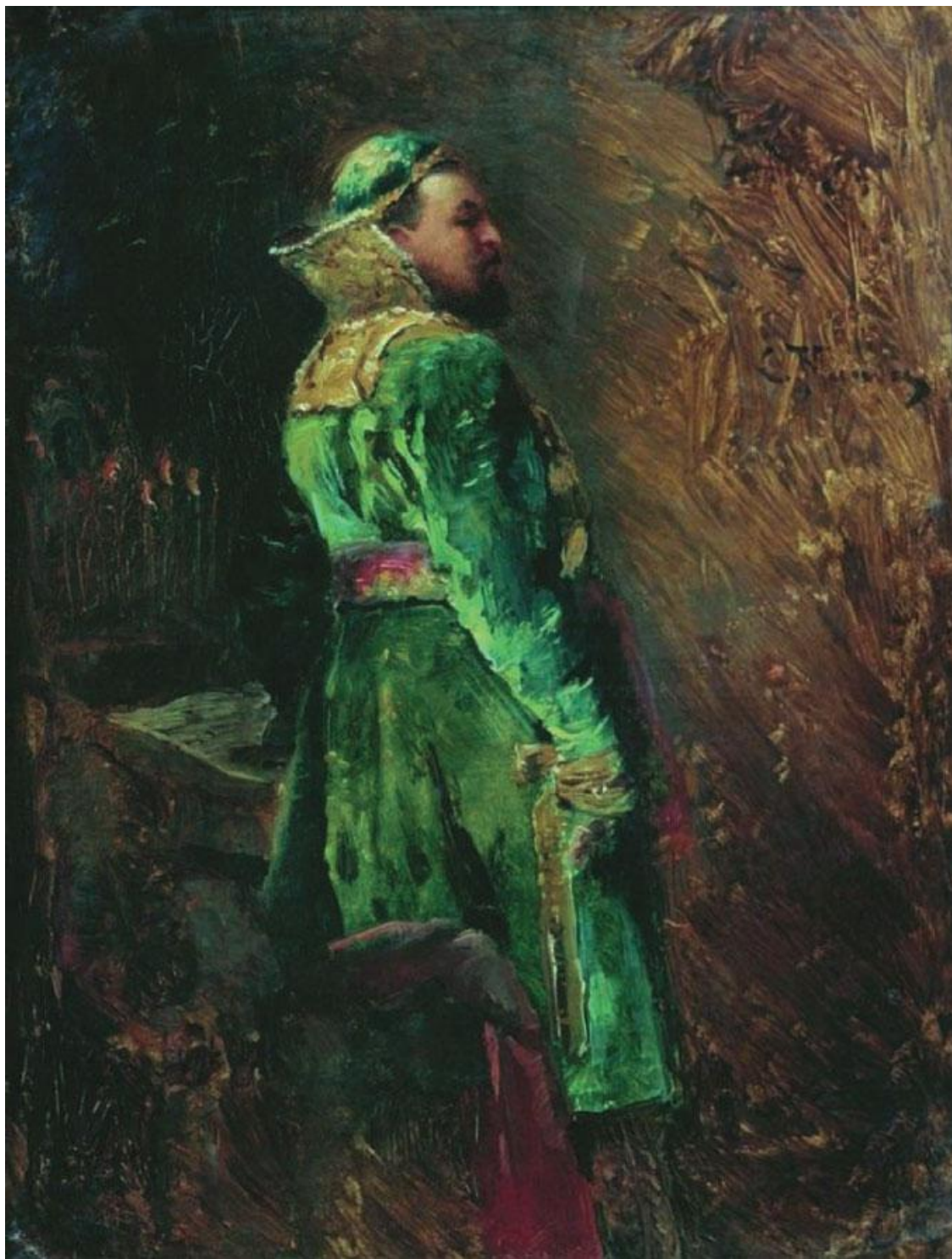
К. Маковский. Боярин. 1880 г.

Должно было ожидать, что смутами и неудовольствиями во время малолетства московского великого князя прежде всего захотят воспользоваться в Литве. Мы видели, что здесь ошиблись в расчетах на смуты при восшествии на престол Василия и должны были закрепить за сыном Иоанна III не только все приобретения последнего, но даже уступить Смоленск. Срок перемирия исходил, и престарелому Сигизмунду вовсе не хотелось начинать войны с Василием; его паны радные, по обычаю, отправили посланника Клиновского к боярам московским с просьбою уговорить великого князя прежде истечения перемирия отправить к королю великих послов для заключения вечного мира или нового перемирия; если же великий князь не