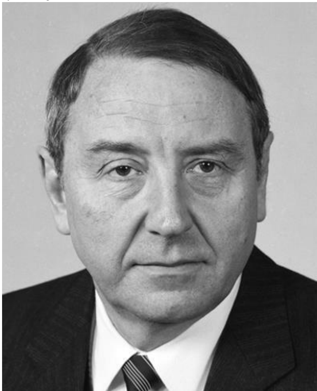
БАКЛАНОВ Олег Дмитриевич (17.03.1932–28.07.2021)

вел себя наступательно, но политическая верхушка республики отреклась от своего вчерашнего кумира. 13.03.1954 г. выведен из состава членов ЦК КПСС, исключен из партии и арестован. Весной 1956 г. стал главным обвиняемым на прошедшем в Баку закрыто-открытом процессе. По словам очевидцев, на суде держался смело. Говорил, что всегда был и остается предан партии, неизменно проводил ее политику, что так же, как он, действовали в 30-е годы и члены высшего руководства в Москве. 07.05.1956 г. приговорен Военной коллегией Верховного суда СССР к смертной казни за нарушения социалистической законности как сообщник Л.П. Берии. Подавал прошение о помиловании. 12.05.1956 г. оно было отклонено. Расстрелян. Был депутатом Верховного Совета СССР 1–3-го созывов.