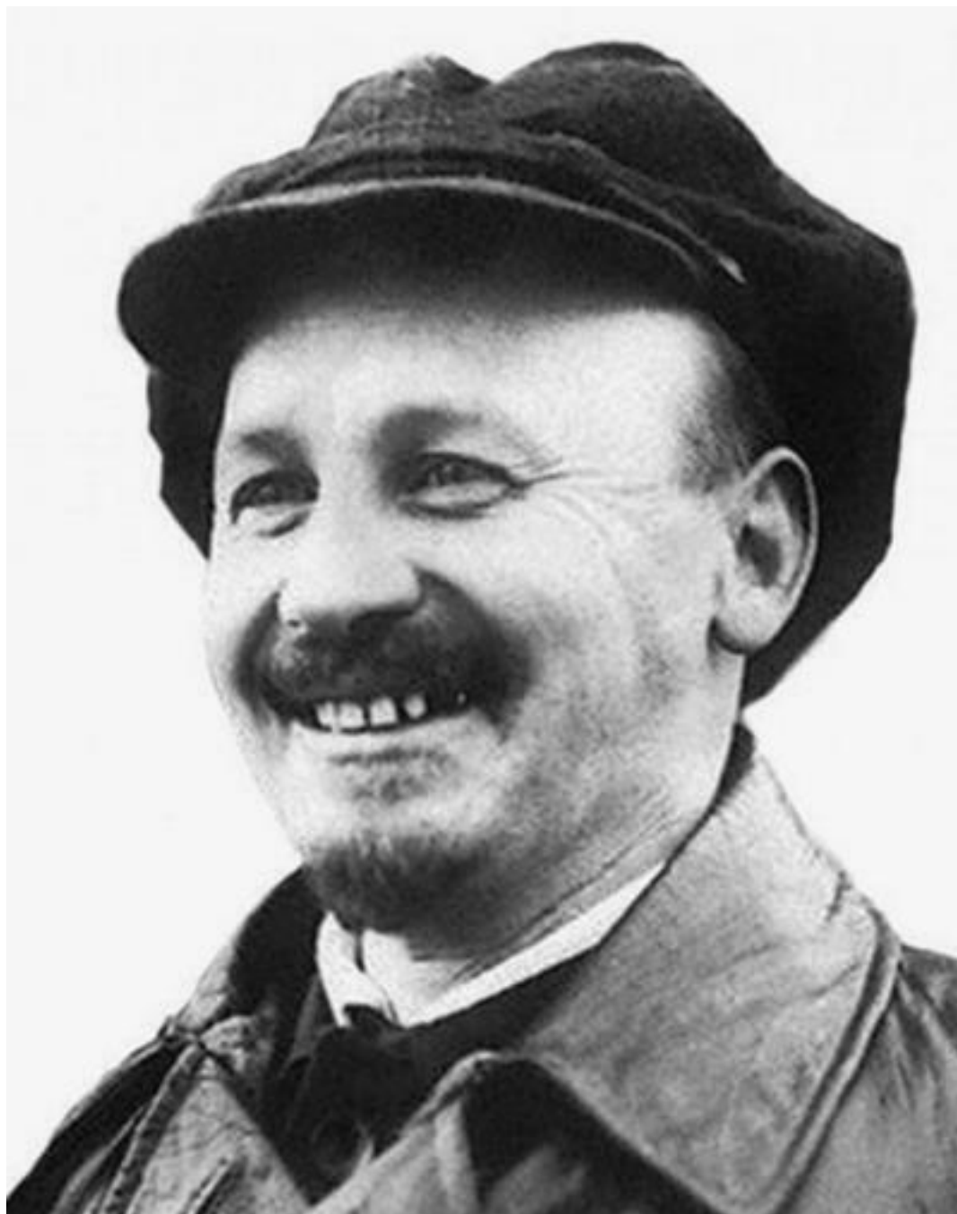
БУХАРИН Николай Иванович (27.09.1888–15.03.1938)

Член Политбюро ЦК РКП(б) – ВКП(б) с 02.06.1924 г. по 17.11.1929 г. Кандидат в члены Политбюро ЦК РКП(б) с 25.03.1919 г. по 02.06.1924 г. Кандидат в члены Оргбюро ЦК РКП(б) с 25.09.1923 г. по 23.05.1924 г. Член ЦК РСДРП(б) – РКП(б) – ВКП(б) в 1917–1934 гг. Кандидат в члены ЦК ВКП(б) в 1934–1937 гг. Член КПСС с 1906 г.