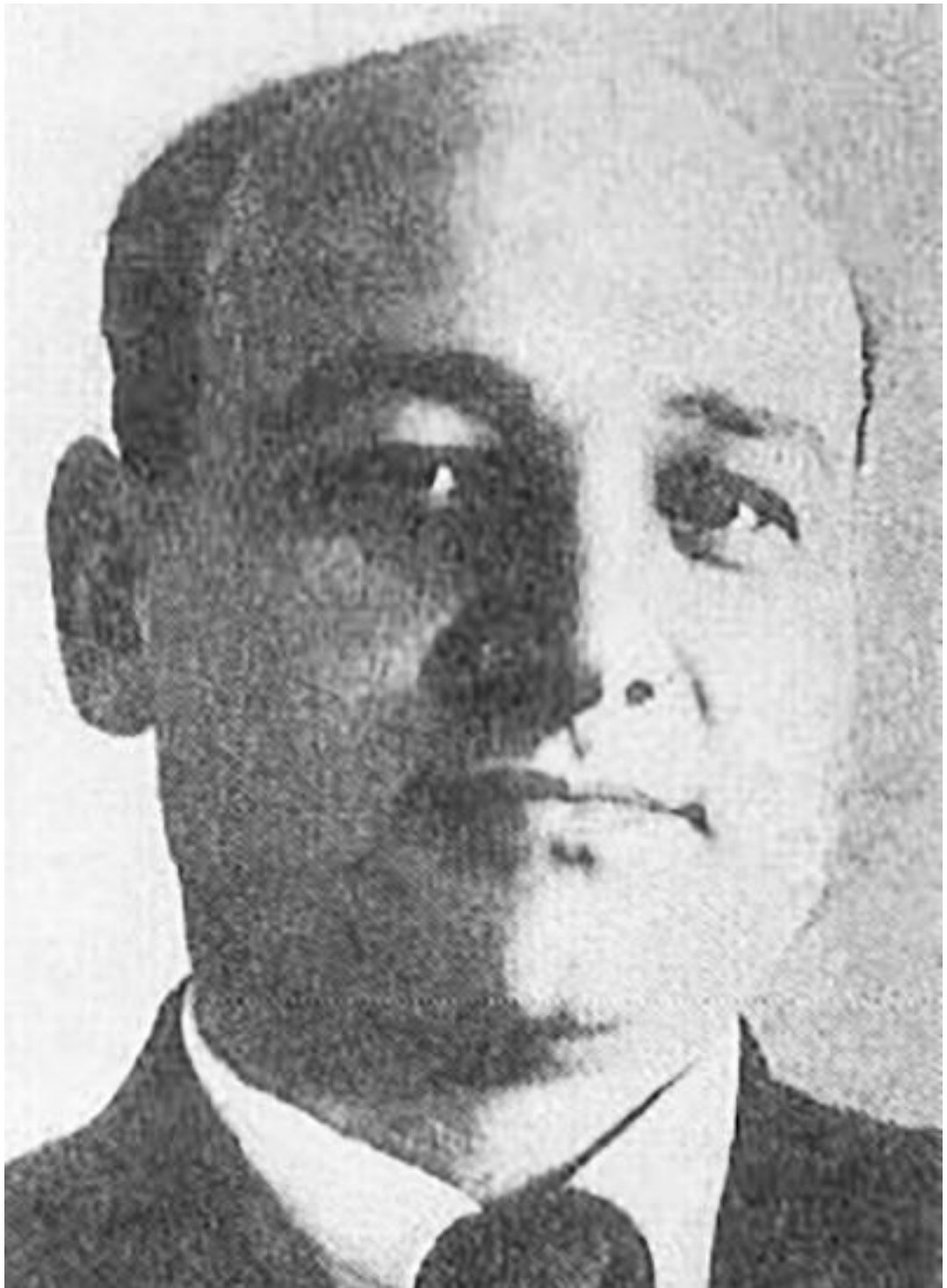
АЛЕКСАНДРОВ Георгий Федорович (22.03.1908–21.07.1961)

Член Оргбюро ЦК ВКП(б) с 18.03.1946 г. по 05.10.1952 г. Кандидат в члены ЦК ВКП(б) – КПСС в 1941–1956 гг. Член КПСС с 1928 г.