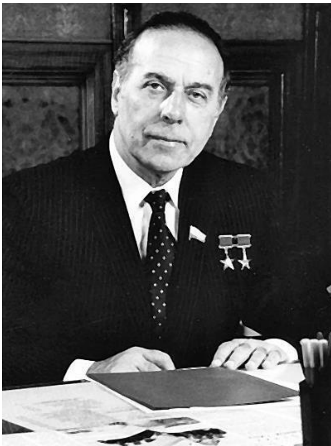
АЛИЕВ Гейдар Алиевич (Али Рза Оглы) (10.05.1923–12.12.2003)

Член Политбюро ЦК КПСС с 22.11.1982 г. по 21.10.1987 г. Кандидат в члены Политбюро ЦК КПСС с 05.03.1976 г. по 22.11.1982 г. Член ЦК КПСС в 1971–1989 гг. Член КПСС с марта 1945 г. по июль 1991 г.