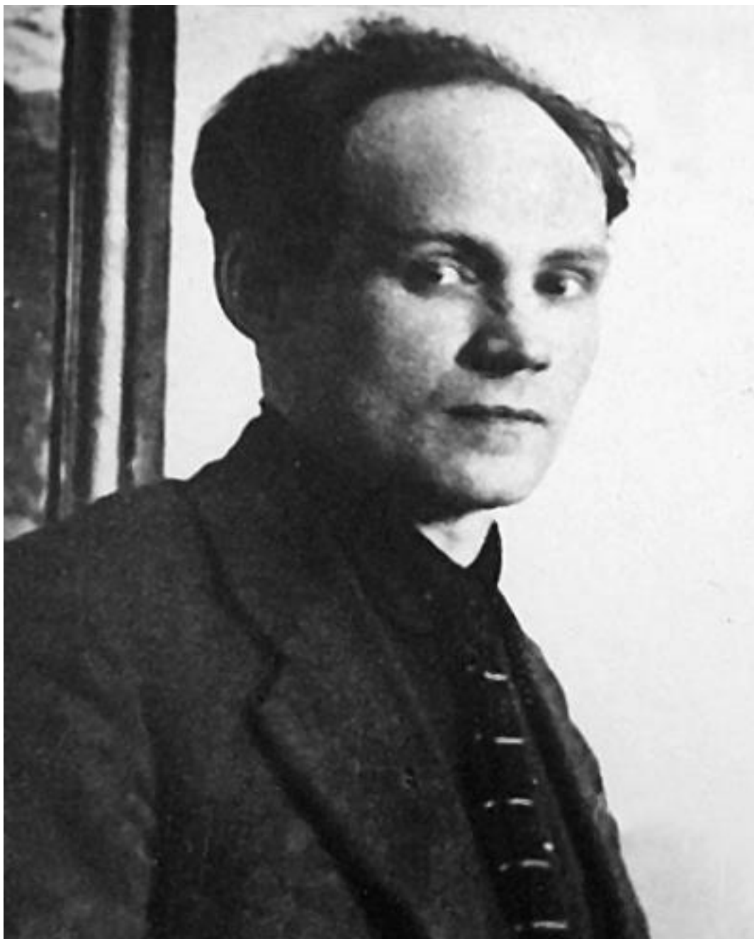
АНТИПОВ Николай Кириллович (03.12.1894–29.07.1938)

Кандидат в члены Оргбюро ЦК РКП(б) – ВКП(б) с 02.06.1924 г. по 18.12.1925 г. и с 11.04.1928 г. по 26.06.1930 г. Член ЦК партии в 1924–1937 гг. Член КПСС с 1912 г.