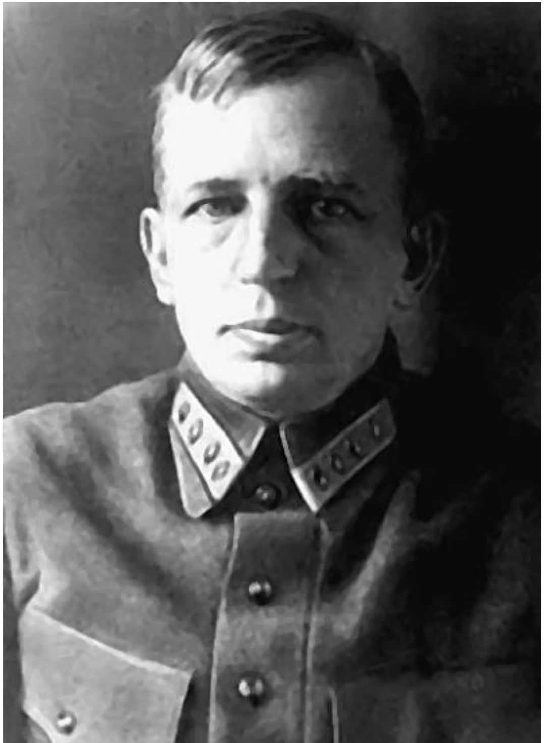
БУБНОВ Андрей Сергеевич (22.03.1884–01.08.1938)

Избран членом Политбюро ЦК РСДРП(б) 10(23).10.1917 г. Член Оргбюро ЦК РКП(б) – ВКП(б) с 02.06.1924 г. по 26.01.1934 г. Секретарь ЦК РКП(б) с 30.04.1925 г. по 18.12.1925 г. Кандидат в члены Секретариата ЦК ВКП(б) с 01.01.1926 г. по 26.06.1930 г. Член ЦК РСДРП(б) – РКП(б) – ВКП(б) в 1917–1918, 1924–1937 гг. Кандидат в члены ЦК РСДРП – РКП(б) в 1912–1917, 1919–1920, 1922–1924 гг. Член КПСС с 1903 г.