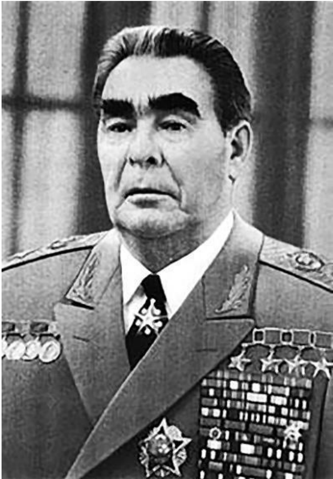
БРЕЖНЕВ Леонид Ильич (19.12.1906–10.11.1982)

на пенсии. Получала 430 рублей. Муж тяжело болел, сама тоже подолгу не покидала больничную палату. Сожалела, что не родила еще раз: «Были бы дети, внуки».