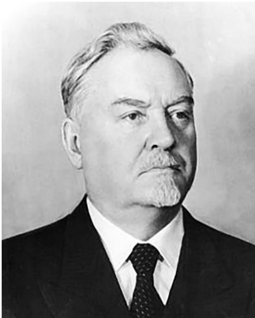
БУЛГАНИН Николай Александрович (30.05.1895–24.02.1975)

Член Политбюро (Президиума) ЦК ВКП(б) – КПСС с 18.02.1948 г. по 05.09.1958 г. Кандидат в члены Политбюро ЦК ВКП(б) с 18.03.1946 г. по 18.02.1948 г. Член Оргбюро ЦК ВКП(б) с 18.03.1946 г. по 05.10.1952 г. Член ЦК ВКП(б) – КПСС в 1937–1961 гг. Кандидат в члены ЦК ВКП(б) в 1934–1937 гг. Член КПСС с 1917 г.