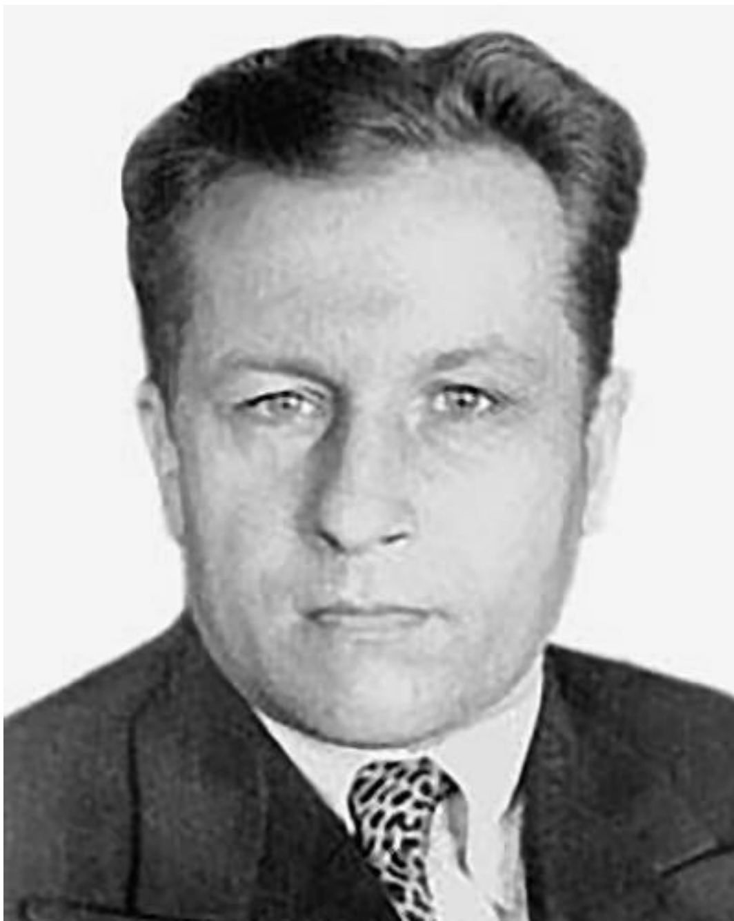
АНДРИАНОВ Василий Михайлович (21.03.1902–03.10.1978)

Член Президиума ЦК КПСС с 16.10.1952 г. по 05.03.1953 г. Член Оргбюро ЦК ВКП(б) с 18.03.1946 г. по 05.10.1952 г. Член ЦК ВКП(б) в 1939–1956 гг. Член КПСС с 1926 г.