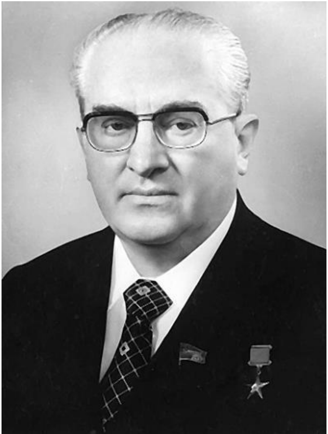
АНДРОПОВ Юрий Владимирович (15.06.1914–09.02.1984)

Генеральный секретарь ЦК КПСС с 12.11.1982 г. по 09.02.1984 г. Член Политбюро ЦК КПСС с 27.04.1973 г. по 09.02.1984 г. Кандидат в члены Политбюро с 21.06.1967 г. по 27.04.1973 г. Секретарь ЦК КПСС с 23.11.1962 г. по 21.06.1967 г. и с 24.05.1982 г. по 12.11.1982 г. Член ЦК КПСС в 1961–1984 гг. Член КПСС с 1939 г.