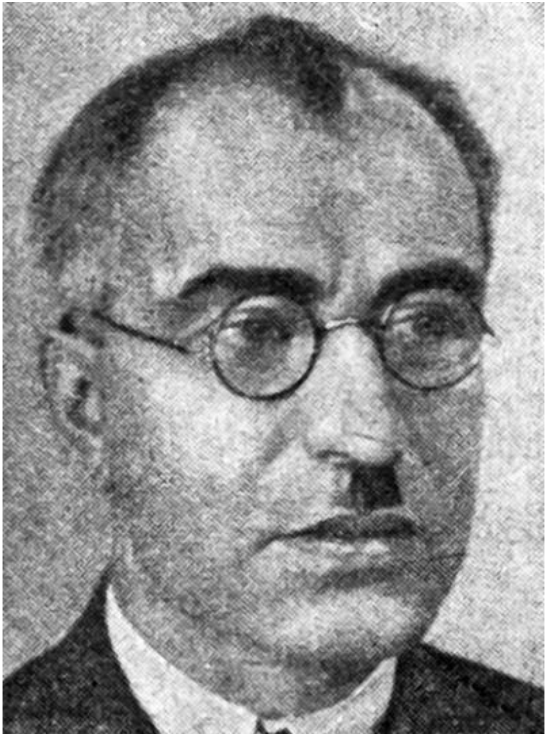
БАГИРОВ Мир Джафар Аббасович (17.09.1895–26.05.1956)

Кандидат в члены Президиума ЦК КПСС с 05.03.1953 г. по 17.07.1953 г. Член ЦК ВКП(б) – КПСС в 1937–1954 гг. Кандидат в члены ЦК ВКП(б) в 1934–1937 гг. Член КПСС с марта 1917 г. по 13.03.1954 г.