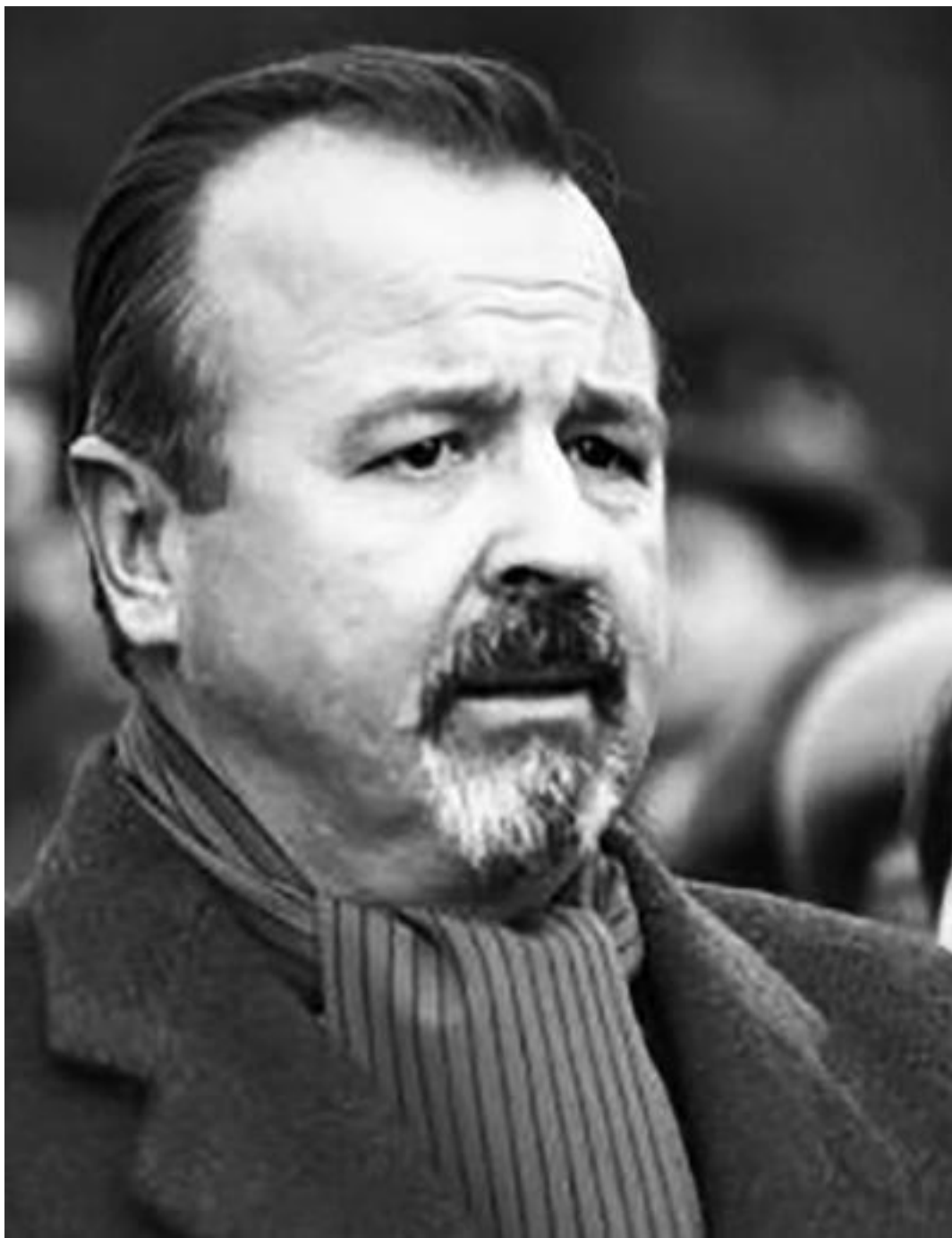
АННУС Лембит Эльмарович (17.09.1941– 04.07.2018)

Член Политбюро ЦК КПСС с 31.01.1991 г. по 23.08.1991 г. Член ЦК КПСС в июле 1990 г. – августе 1991 г. Член КПСС с 1963 г.