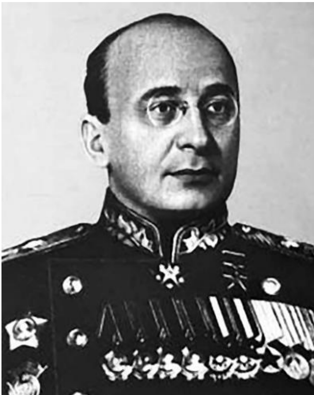
БЕРИЯ Лаврентий Павлович (29.03.1899–23.12.1953)

ного Совета СССР 2–5-го созывов. С 1960 г. был на пенсии. Похоронен на Новодевичьем кладбище в Москве.