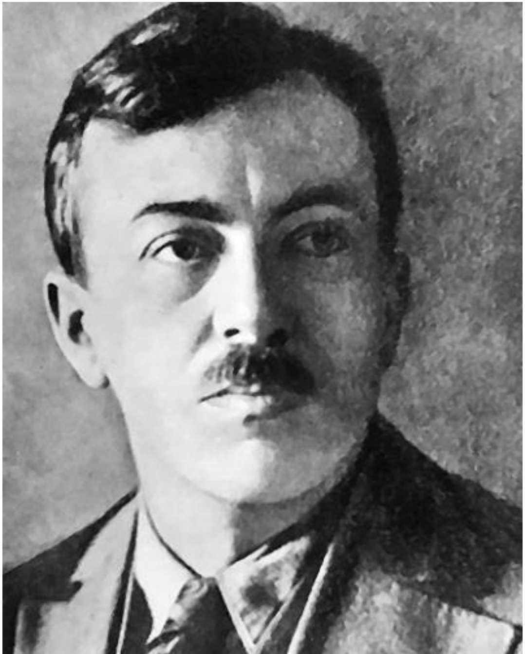
АКУЛОВ Иван Алексеевич (12.04.1888–30.10.1937)

Член Оргбюро ЦК ВКП(б) с 13.07.1930 г. по 02.10.1932 г. Член ЦК ВКП(б) в 1927–1930 гг. Член ЦКК РКП(б) – ВКП(б) в 1923–1925, 1930–1934 гг. Член КПСС с 1907 г.