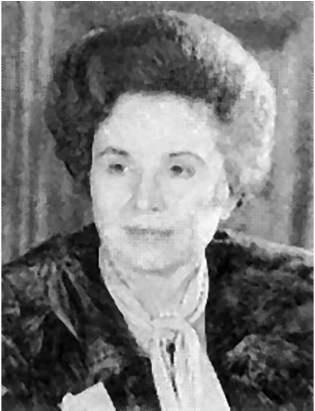
БИРЮКОВА Александра Павловна (25.02.1929–20.02.2008)

Кандидат в члены Политбюро ЦК КПСС с 30.09.1988 г. по 13.07.1990 г. Секретарь ЦК КПСС с 06.03.1988 г. по 30.09.1988 г. Член ЦК КПСС в 1976–1990 гг. Кандидат в члены ЦК КПСС в 1971–1976 гг. Член КПСС с 1956 г.