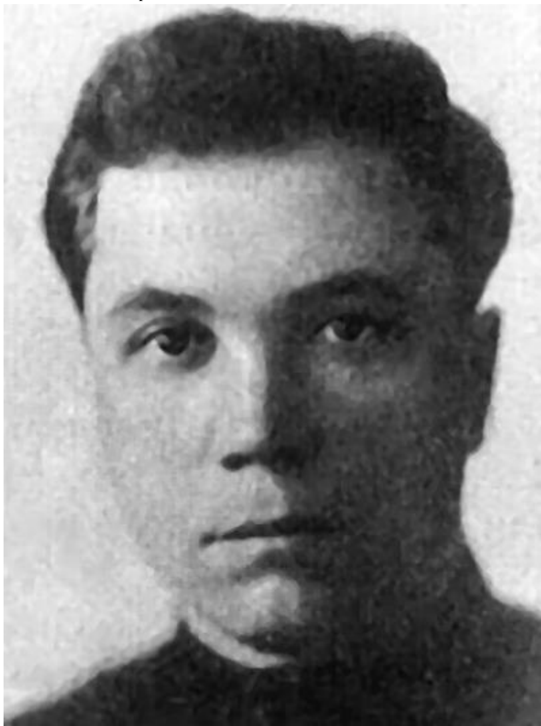
БЕЛОБОРОДОВ Александр Георгиевич (14.10.1891–10.02.1938)

настоящем революционном романтике, большевистском новаторе. 14.04.1937 г. освобожден от работы в ЦК. 12.10.1937 г. арестован, через два дня умер в Лефортовской тюрьме, где его сразу же подвергли жестоким избиениям. В деле К.Я. Баумана имеется лишь один документ – написанное им в день смерти заявление. Оно залито кровью... Избирался членом ВЦИК и ЦИК СССР. Реабилитирован Главной военной прокуратурой в июле 1955 г. и Прокуратурой СССР в июне 1989 г. В партии восстановлен КПК при ЦК КПСС в августе 1955 г. Обладатель партийного билета за номером 30.