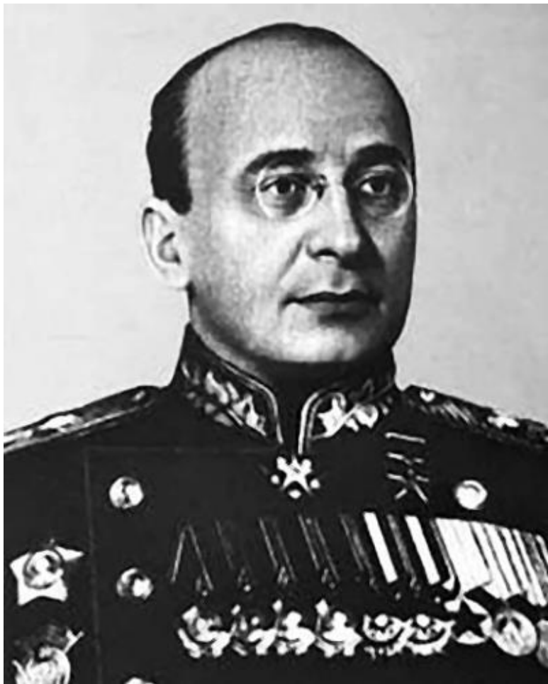
БЕРИЯ Лаврентий Павлович (29.03.1899–23.12.1953)