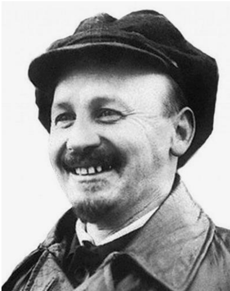
БУХАРИН Николай Иванович (27.09.1888– 15.03.1938)