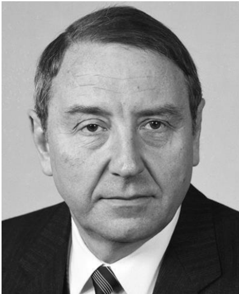
БАКЛАНОВ Олег Дмитриевич (17.03.1932– 28.07.2021)