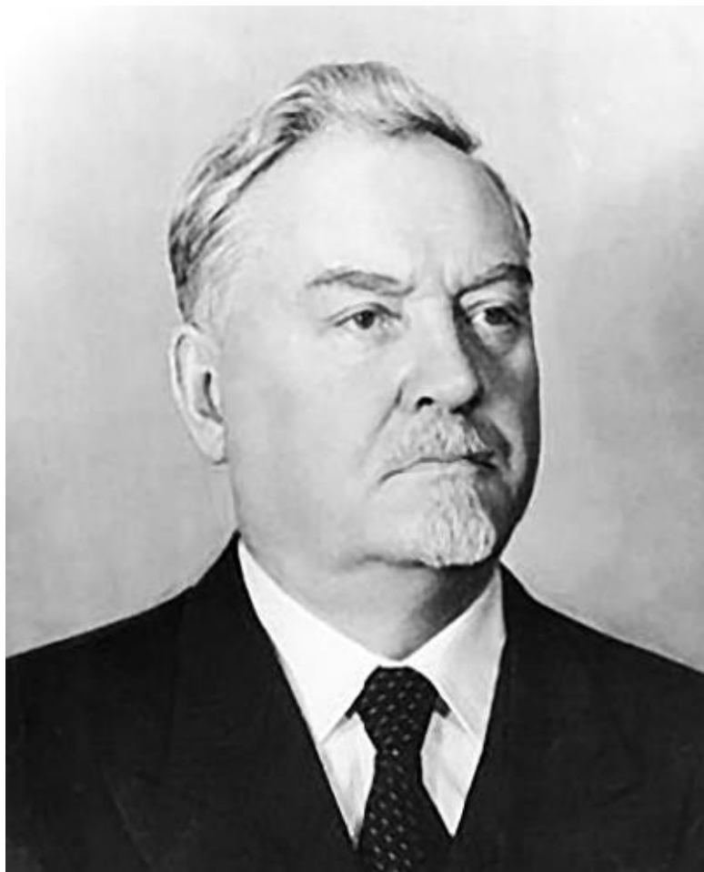
БУЛГАНИН Николай Александрович (30.05.1895– 24.02.1975)