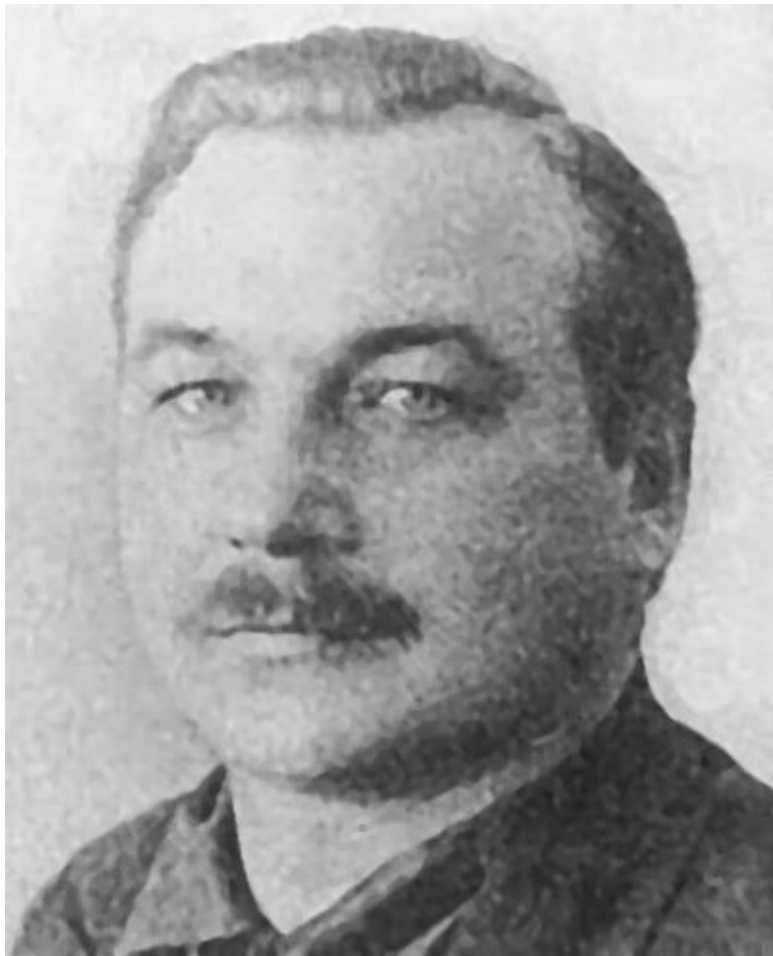
БАУМАН Карл Янович (17.08.1892–14.10.1937)