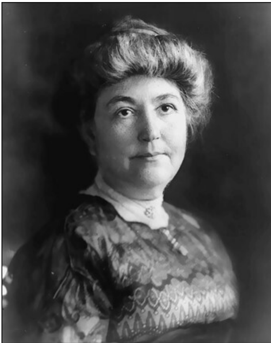
Элен Вильсон в 1912 г.

Элин делала все, чтобы помочь Вудро. Она редактировала тексты его речей, выучила немецкий, чтобы помогать ему в научной работе, много читала и следила за всеми важными новинками в искусстве и литературе, чтобы вовремя ознакомить с ними Вудро, который слишком увлекся политикой и мог попасть впросак, продемонстрировав неосведомленность о новом прославленном романе или пьесе. Элин была не только возлюбленной и заботливой женой, она была еще и тайным советником Вудро Вильсона. Она никогда с ним не спорила, но иногда поправляла его, деликатно спросив: «О Вудро, ты же не думаешь так всерьез, или?..» И он обычно со смехом отвечал: «Мадам, я, конечно, так и думал, пока ты не призвала меня к порядку».