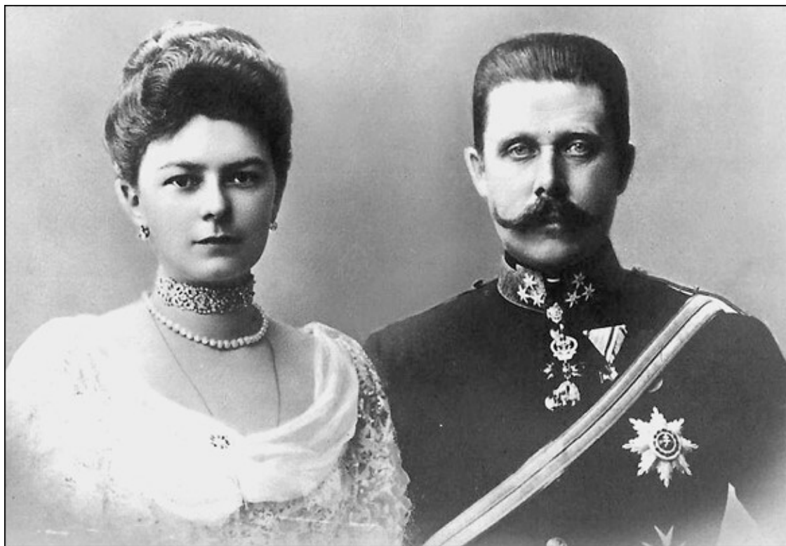
Эрцгерцог Франц-Фердинанд с супругой. Старинная открытка

17 марта 1898 года эрцгерцог был назначен заместителем главнокомандующего австро-венгерской армией, по сути – военным «заместителем» императора. И уже с 1906 года эрцгерцог принимал активное участие в решении внешнеполитических вопросов, расставляя на важные посты людей из своего окружения. К несчастью для себя и своей семьи, именно Франц-Фердинанд оказался одним из инициаторов аннексии Боснии и Герцеговины в 1908 году... Что и стало причиной покушения в Сараеве.