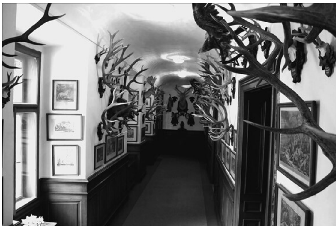
Охотничьи трофеи Франца-Фердинанда в его замке