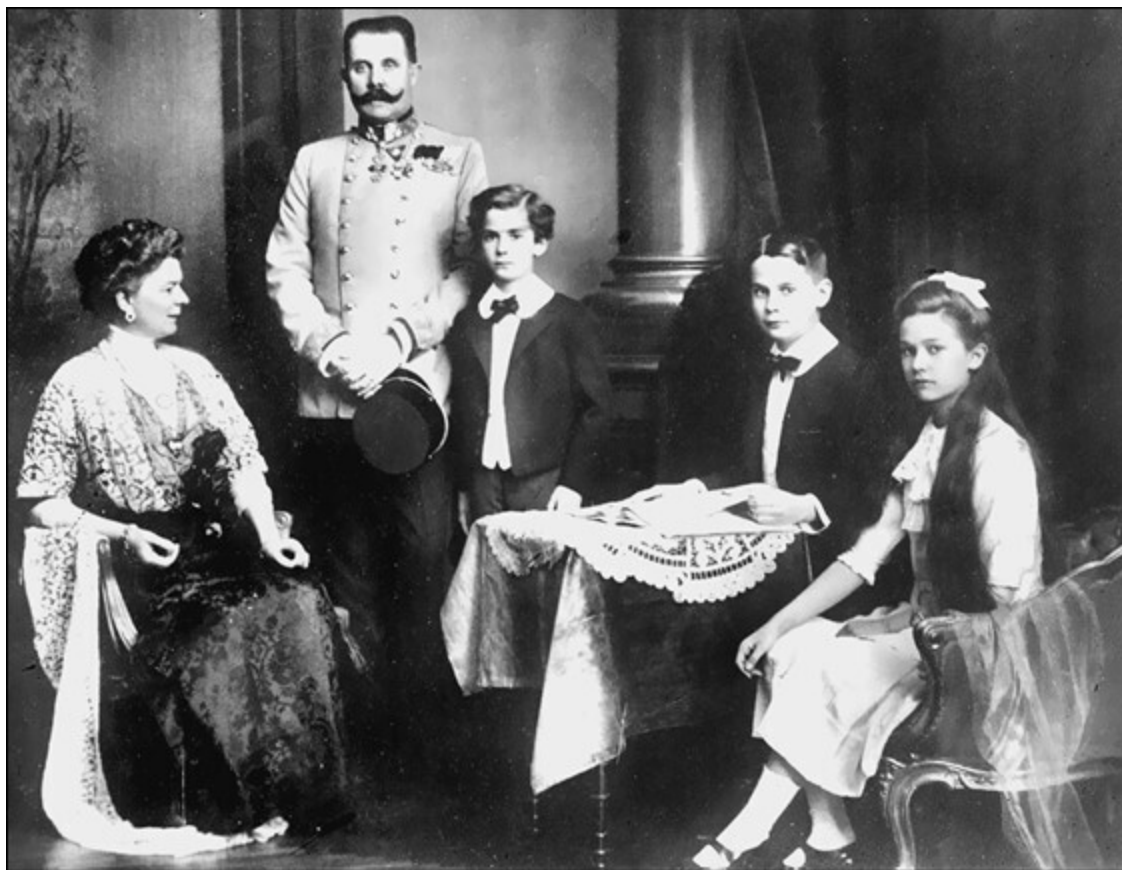
Эрцгерцог Франц-Фердинанд с семьей

Эрнст умер в 1954 году, оставив после себя двоих сыновей: Франца-Фердинанда и Эрнста.