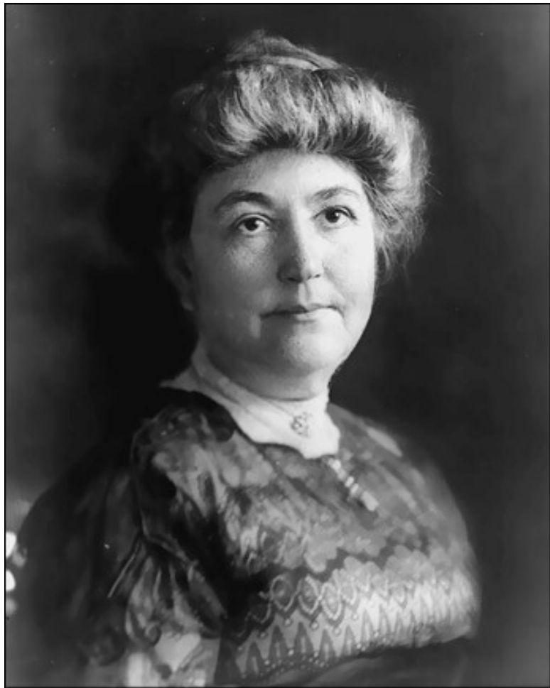
Эллен Вильсон в 1912 г.