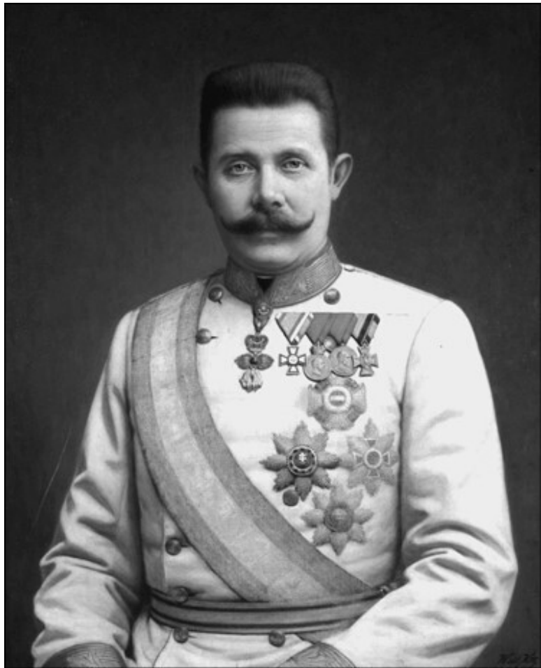
Эрцгерцог Франц-Фердинанд. Художник В.-А. Витта