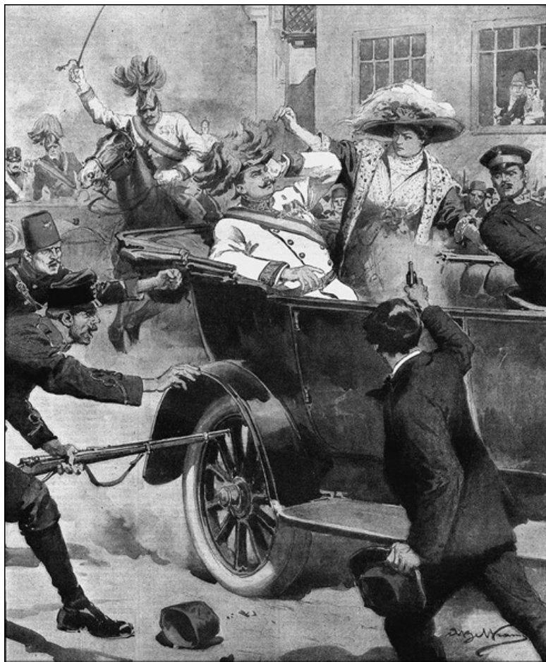
Убийство Франца-Фердинанда в Сараево. Художник А. Бельтраме