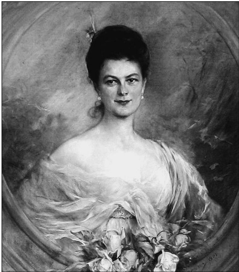
София Хотек. Художник Й.-А. Конпай

Можно себя представить гнев Франца-Фердинанда, возмущенного публичным унижением любимой супруги. Имен-