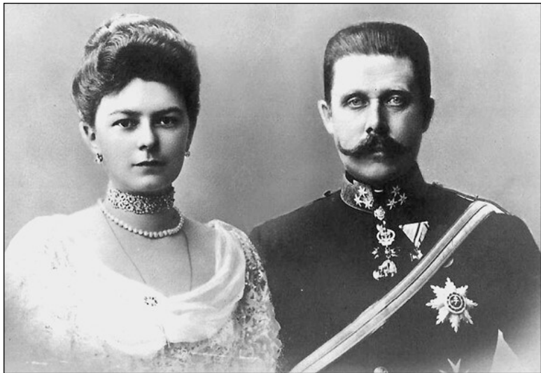
Эрцгерцог Франц-Фердинанд с супругой. Старинная от- крытка

17 марта 1898 года эрцгерцог был назначен заместителем главнокомандующего австро-венгерской армией, по сути – военным «заместителем» императора. И уже с 1906 года эрцгерцог принимал активное участие в решении внешнеполитических вопросов, расставляя на важные посты людей из своего окружения. К несчастью для себя и своей семьи, именно Франц-Фердинанд оказался одним из инициаторов аннексии Боснии и Герцеговины в 1908 году... Что и стало причиной покушения в Сараеве.