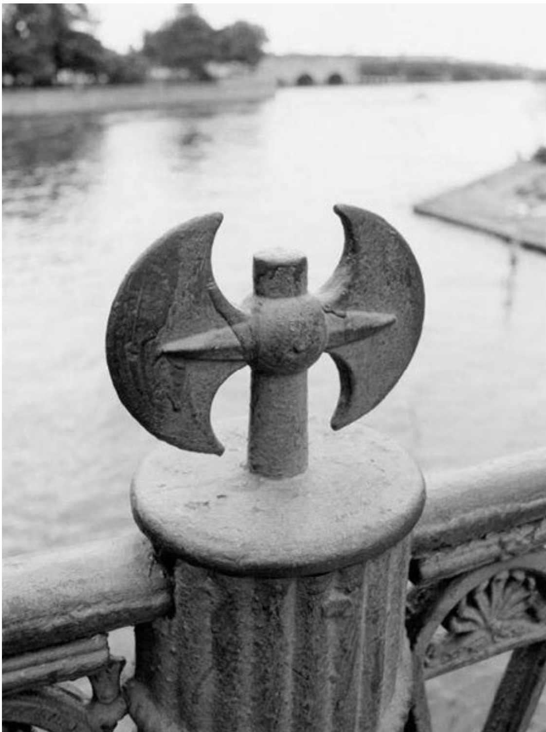
Фото 3. Ленинград, 1989

В. П. Ленинград периода моего девичества, конечно же, в двух словах не опишешь, тем более что такие литературные попытки предпринимались неоднократно, но хотелось бы отметить, что круглая дата советской Олимпиады случилась в один и тот же год, что и мое 12-летие.