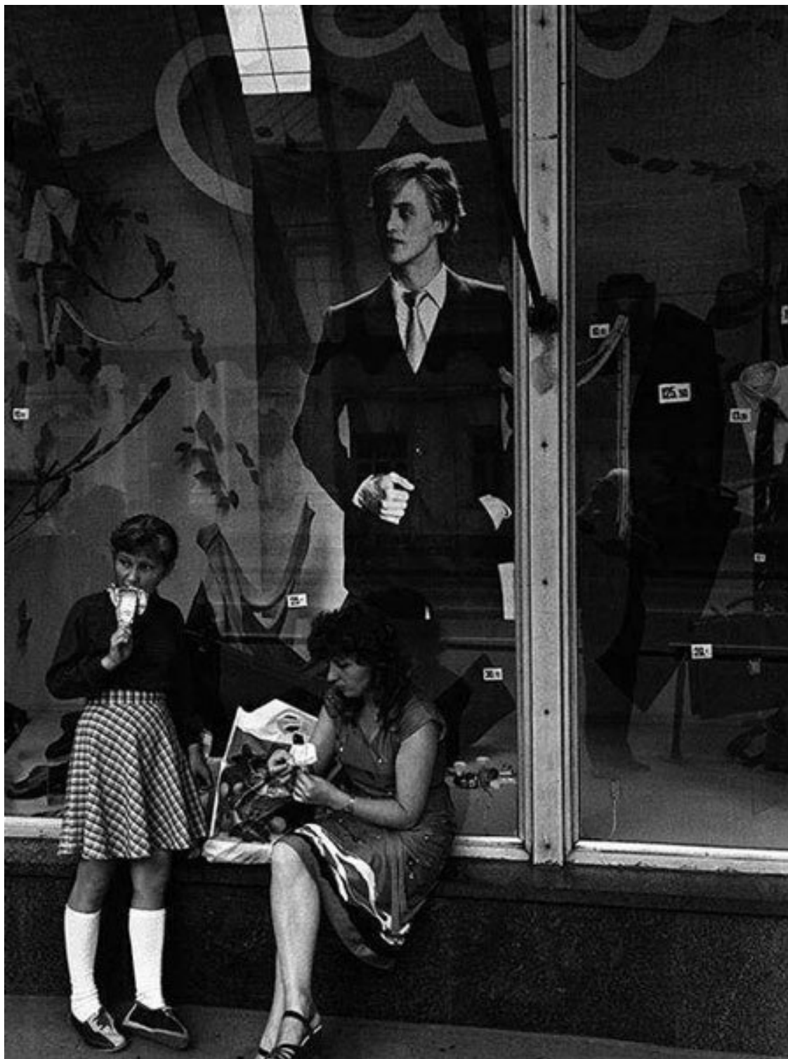
Фото 2. Москва, фото Александра Слюсарева, 1985

О. Х. Сейчас, проезжая мимо «Щелчка», даже удивляешься, что тут могло что-нибудь возникнуть и быть вообще. Казалось бы, что близостью к метрополитену и к другим коммуникациям можно было хоть как-то объяснить то, что происходило в те времена лично у меня.