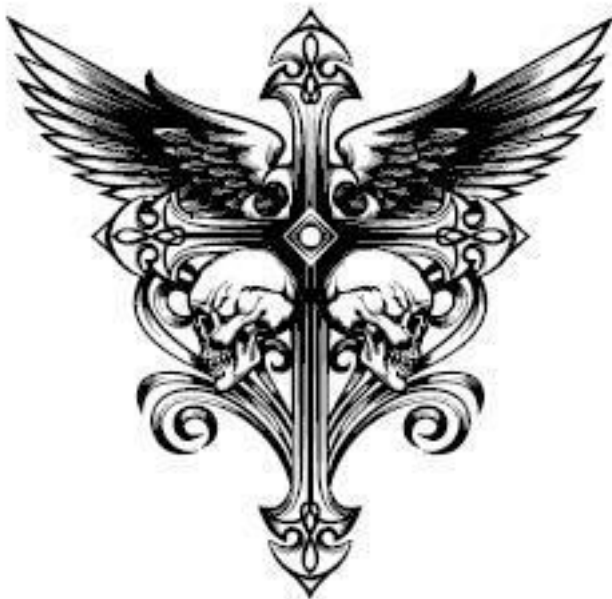
Иллюстрация на обложке Тищенко Ирины (Soma) Арты на форзацах Яны Слепцовой (Panda)